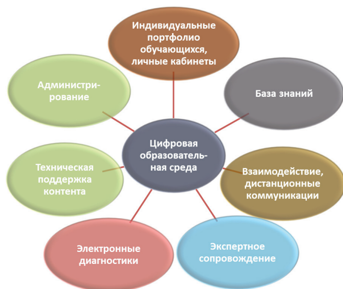
Рисунок 2 – Структурные элементы цифровой образовательной среды (составлено автором).

Критериями, которые целесообразно использовать при разработке инновационной образовательной платформы, по нашему мнению, являются: удобство пользователя; элементы обучения; формы связи; управление учебным контентом; инструменты мотивации; бизнес-модель; управление пользователями; электронные диагностики.