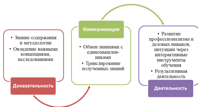
Рисунок 3 – Развитие компетентности обучающегося, посредством интеграции онлайн- и офлайн-форматов (составлено автором).

Обобщение зарубежных практик реализации онлайн-обучения позволяет схематично представить и формализовать систему навыков, получаемых посредством дистанционных форм обучения: деятельность, коммуникация и доказательность (рис. 3).