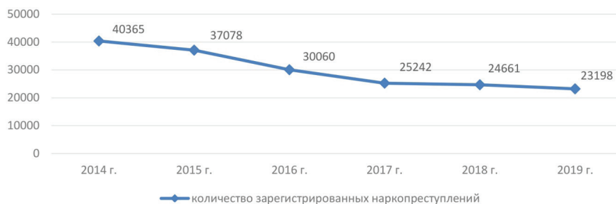
Рисунок 4 — Динамика числа зарегистрированных наркопреступлений в Сибирском федеральном округе за 2014–2019 гг.

Наркомания как негативное социальное явление криминализирует социальную среду, разрушает политическую, культурную и социальную структуру общества. Динамика числа зарегистрированных наркопреступлений в Сибирском федеральном округе отражена на рисунке 4.