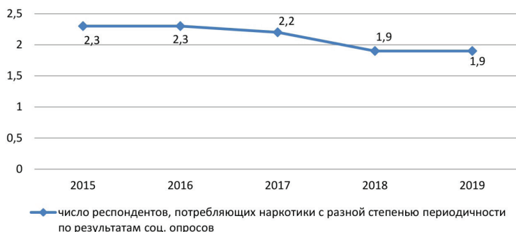
Рисунок 1 — Оценка наркоситуации по результатам социологических исследований в ходе ежегодного мониторинга, млн чел.

коэффициент латентности наркоситуации. Хотя и результаты социологических исследований самого высокого уровня достоверности допускают 5% погрешности. При сопоставлении данных статистического анализа (отраженных в таблице 1) и данных социологических исследований (отмеченных на рисунке 1) данный коэффициент по России ежегодно может составлять кратность от 7 до 8 раз.