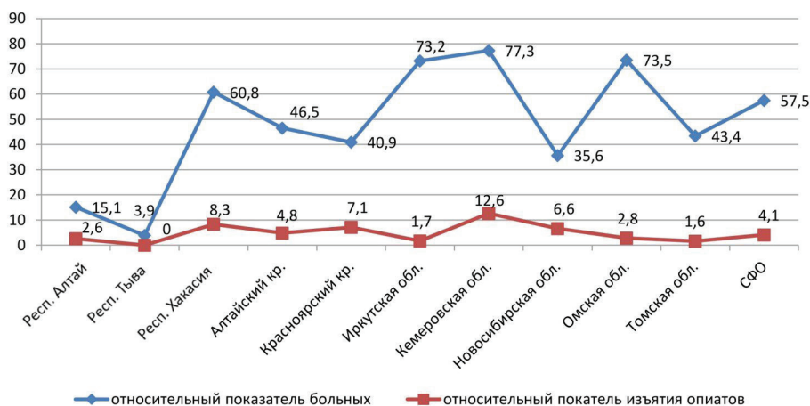
Рисунок 2 — Соотношение относительных показателей больных с диагнозом «наркомания» как следствие употребления опиатов и относительных показателей изъятия наркотиков опийной группы.

тиков на территорию региона прежде всего по так называемому северному маршруту, а распространенность наркотиков опийной группы в удаленных от границы регионах говорит и о транзите наркотиков опийной группы вглубь территории округа и в субъекты Федерации, расположенные на территориях других федеральных округов. Вместе с тем правоохранительными органами Сибирского федерального округа принимаются значительные меры по противодействию распространению и транзиту наркотиков опийной группы. В округе ежегодно изымаются из незаконного оборота значительные объемы наркотических средств и психоактивных веществ как в целом, так и опийной группы в частности, что отражено на рисунке 3.