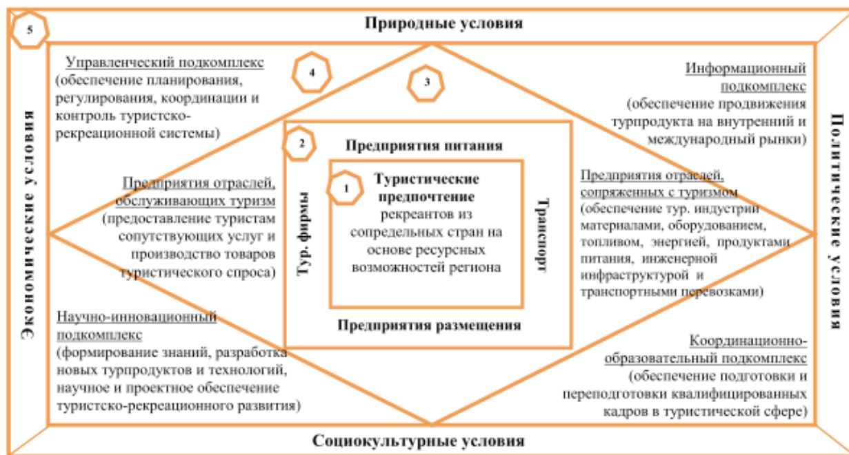
Рис. 5. Структура целевого регионального туристского кластера под потребителя в пределах трансграничных территорий (по: [8; 10])

Внешняя среда, способствующая практическому воплощению кластерного подхода в развитии рекреации, должна обеспечить заинтересованность потенциальных участников к объединению в кластер. Важно содействие как в экономическом, так и в организационно-управленческом аспектах, например, создание благоприятного инвестиционного климата, формирование активной кредитной политики со стороны исполнительной власти территории, содействие государства в развитии внешних связей между малым и средним бизнесом региона и иностранных государств, максимально полное использование возможностей по созданию привлекательного «туристского образа» региона и отдельных его центров и др.