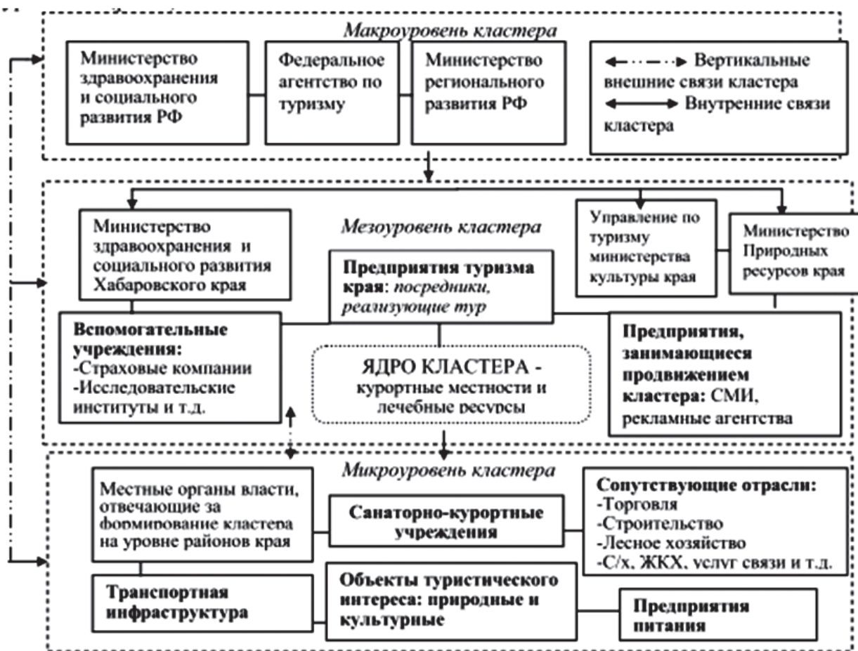
Рис. 3. Структура ЛОТК (по: [6])