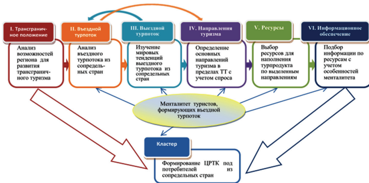
Рис. 4. Алгоритм формирования целевого регионального туристского кластера под потребителя в пределах трансграничных территорий (по: [8; 10])