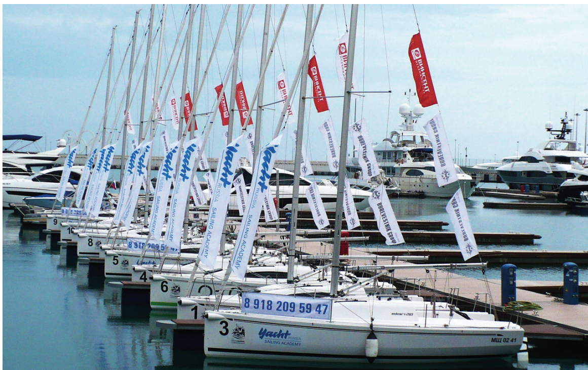
Рис. 2. Килевые яхты «ELAN 210» в яхтенном порту Сочи