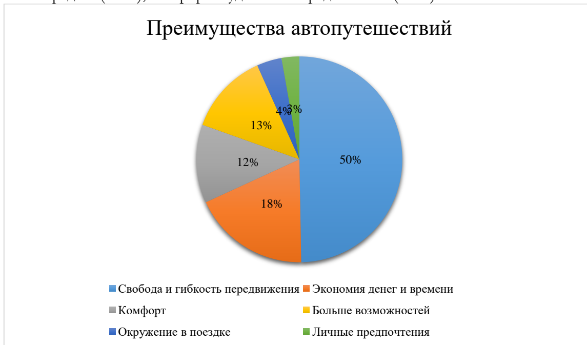
Рисунок 1. Преимущества автопутешествий Figure 1. Benefits of Road Trips

Преимущества автомобильных путешествий, по мнению российских автопутешественников можно разделить на шесть основных категорий. Три основных преимущества автомобильных путешествий по мнению российских автопутешественников (рисунок 1): свобода передвижения (49 %); экономия средств (27 %); комфорт и удобство передвижения (22 %).