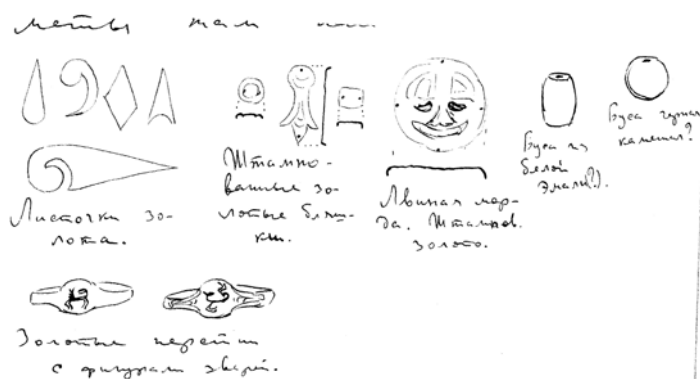
Рис. 4. Рисунки М.П. Грязнова в письме №7. Автограф. Чернила

Спасибо за рисунки и сообщение о бронзовых предметах Барнаульского музея. Нарисованные Вами два ножа, а также, по-видимому, и остальные предметы я видел и зарисовал. Часть из них мне, может быть, удастся нынче к весне опубликовать.