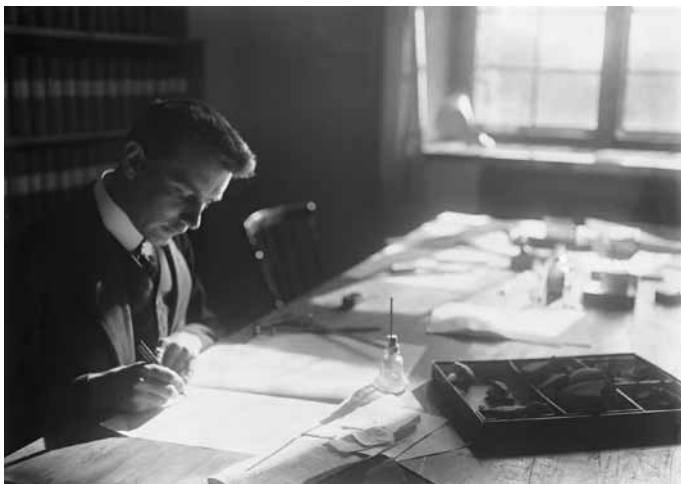
Рис. 1. А.М. Тальгрэн в 1920-е гг.

С 1926 г. между Грязновым и Тальгреном завязалась переписка и, судя по всему, по инициативе финского ученого. По контексту первого письма можно понять, что Грязнов отвечает на вопросы Тальгрена и обращается к нему как к хорошо знакомому коллеге. Длилась переписка, к сожалению, недолго – около пяти лет и прервалась, вероятно, в середине 1930 г. Прежде чем перейти к характеристике писем, несколько слов о том, какой научный путь прошли наши корреспонденты к тому времени.