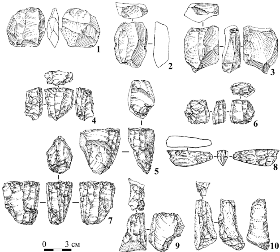
Рис. 3. Плоскостные, объемные, торцовые и клиновидные микронуклеусы: 1-3 – плоскостные микронуклеусы; 4, 9, 10 – объемные подпризматические микронуклеусы; 5, 6 – торцовые микронуклеусы; 7, 8 – клиновидные нуклеусы

Последний, четвертый, тип микронуклеусов, выделенный в комплексах первого этапа РВП стоянки Т-4, представлен одним изделием. Это подпризматический двуплощадочный микронуклеус (рис. 3.-4). Широкая плоскость и узкие стороны этого очень мелкого нуклеуса несут негативы снятия микропластинок, ударной площадкой для каждого фронта служил предыдущий фронт скалывания. Плоский контрфронт покрыт коркой.