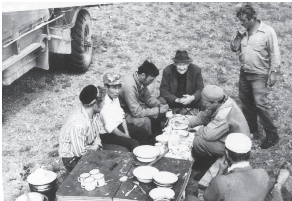
Рис. 3. В археологической экспедиции в Монголии под руководством академика А.П. Окладникова (1979 г.)

рантуру Алтайского государственного университета (АГУ) к основателю этого вуза А.П. Бородавкину. Но потом его перевели в Новосибирск, где в 1977 г. состоялась защита кандидатской диссертации. Научным руководителем являлся всемирно известный советский археолог и академик А.П. Окладников. В 1988 г. Ю.С. Худяков защитил докторскую диссертацию.