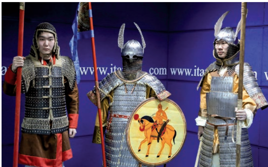
Рис. 4. Предметные научно-исторические реконструкции комплексов вооружения и одежды воинов Южной Сибири, Центральной и континентальной Восточной Азии эпохи Древности и раннего Средневековья (мастер – Ю.А. Филиппович)

монгольских панцирников XIII–XIV вв., сибирско-татарских воинов, русских казаков и стрельцов XVI–XVII вв. (рис. 4; 5). В настоящее время работы ученых НГУ экспонируются в университетах и музейных собраниях России, Казахстана, Монголии, Китая