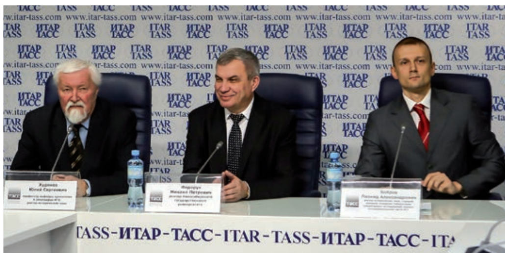
Рис. 5. Ю.С. Худяков (слева), ректор НГУ М.П. Федорук (в центре) и Л.А. Бобров на пресс-конференции в ИТАР ТАСС, посвященной проекту «С сибирским воином через века» (2014 г.)