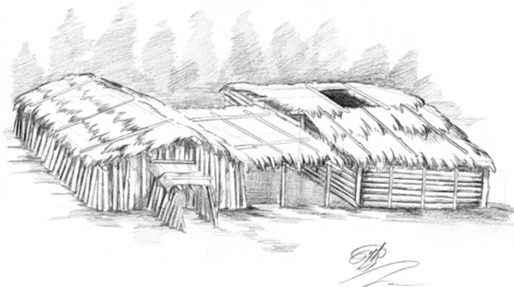
Рис. 3. Реконструкция жилища (художник Д.А. Белоногов)

Реконструкция жилища (рис. 3). Форма и строение стен жилища реконструируется по системе ям и соединяющих их канавок, отмеченных вдоль материковой границы постройки, а также ям, расположенных на площади жилища. Диаметр ям составлял 16–20–30 см, толщина канавок, соединяющих ямки, составляла 6–10, реже 16 см для камеры 1 и 15–25 см для камеры 2.