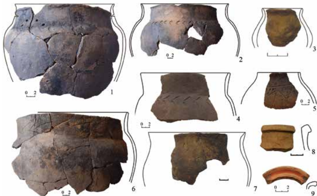
Рис. 4. Керамика с городища Дикая Яма: 1–7 – саргатская; 8–9 – среднеазиатская

Диаметр горшков – от 4–9 до 40 см. Венчики сосудов преимущественно округлые (36,2%), в относительно равных долях встречаются плоские, с карнизиком внутрь или наружу, скошенные внутрь, приостренные, отогнутые. Шейки сосудов в основном отогнутые (60,3%) либо вертикальные (24,1%), редко – наклоненные внутрь (6,9%), в профиле чаще отогнутые (65,5%), около трети – прямые (34,5).