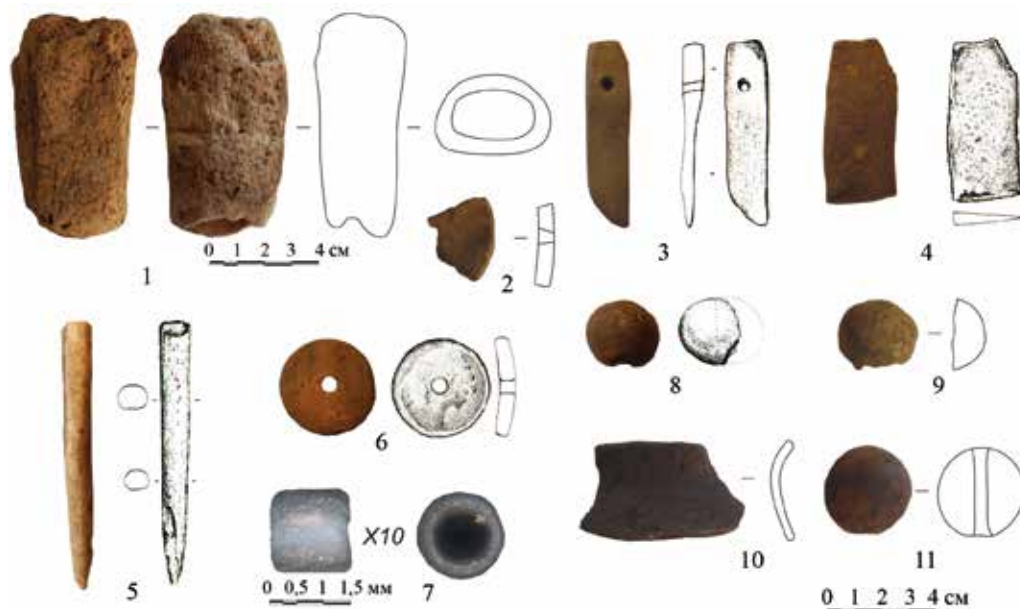
Рис. 5. Инвентарь с городища Дикая Яма: 1 – рукоять (кость); 2, 6, 8–9, 11 – пряслица (2, 6 – керамика; 8–9, 11 – глина); 3 – оселок (камень); 4 – нож (железо); 5 – проколка(?) (кость); 7 – бисер (стекло с позолотой); 10 – скребок (керамика)

Дисковидные пряслица из стенок сосудов (рис. 5.-2, 6) – одно целое пряслице и один фрагмент. Диаметр изделий составляет 5,0 и 2,3 см соответственно, толщина стенки – 0,7 см. Данный тип пряслиц широко распространен территориально и хронологически, начиная с позднего бронзового века.