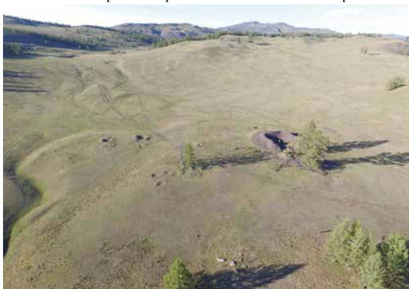
Рис. 2. Современный вид на Пазырыкский могильник. На переднем плане – южная часть комплекса с «царским» курганом №5. Съемка с дрона