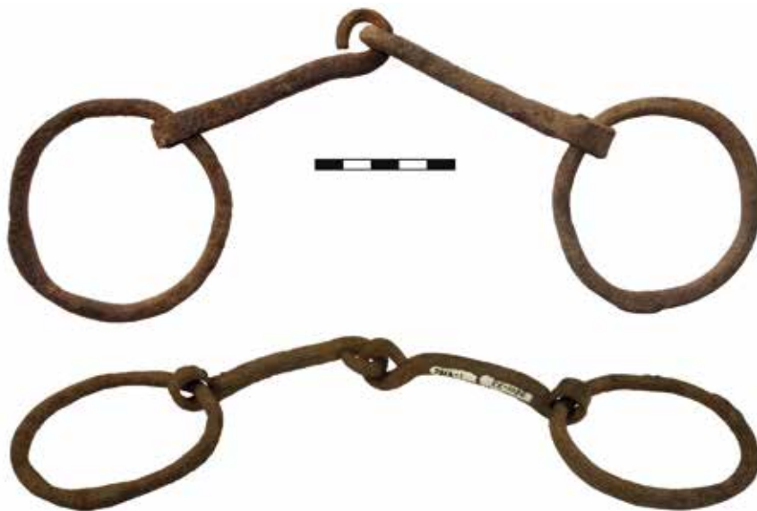
Рис. 4. Удила и псалии из впускного захоронения монгольского времени. Государственный Эрмитаж, колл. №2814-1.

Объект №13 представлял собой овальную насыпь размером 6,5×7,5 м и высотой 0,2 м. Под наземным сооружением никаких дополнительных конструкций и находок не обнаружено.