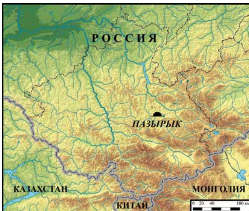
Рис. 1. Карта-схема расположения комплекса Пазырык

Следует отметить, что С.С. Сорокин, в отличие от большинства своих предшественников и современников, после исследования объектов засыпал все свои раскопы. Однако в настоящее время в результате осуществленной рекультивации крайне сложно идентифицировать сильно задернованные объекты, изученные археологом. Кроме