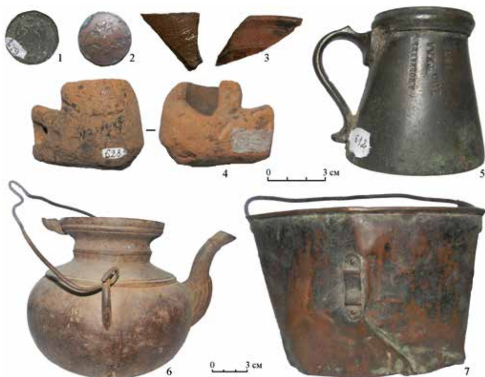
Рис. 3. Находки с редута Свистунского: 1, 2 – монеты; 3 – керамика; 4 – трубка курительная; 5 – мерка пороховая; 6 – рукомойник; 7 – котелок походный солдатский образца 1910 г.