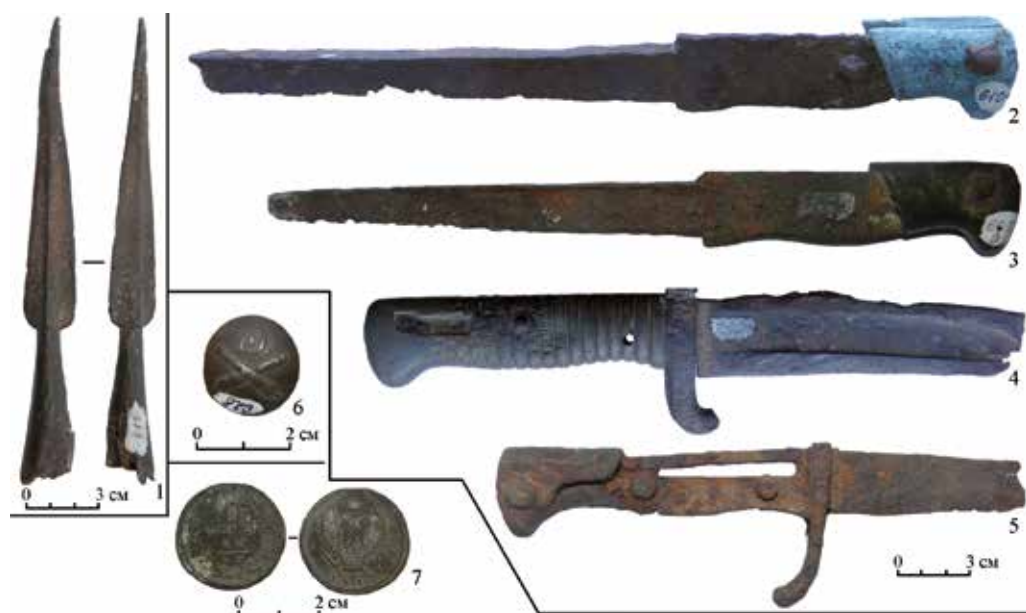
Рис. 2. Находки с редута Свистунского: 1 – наконечник пика; 2–5 – штыки; 6 – пуговица; 7 – монета