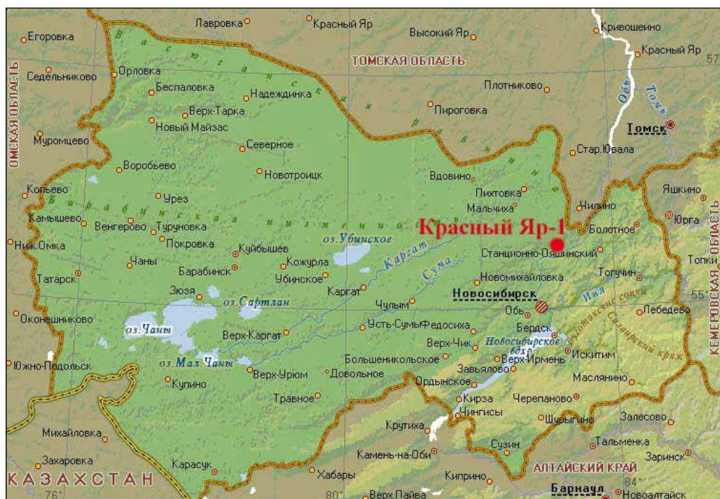
Рис. 1. Карта расположения комплекса археологических памятников Красный Яр-1

вслед за М.П. Грязновым и в соответствии с его концепцией считала карасукскими. После осмотра разрушавшегося памятника Т.Н. Троицкой были выявлены 118 курганов и поселение с мощным зольником. Было принято решение начать там полевые исследования. Причинами раскопок именно этого памятника Т.Н. Троицкая называла то, что на одной территории находились археологические объекты двух эпох (карасукской и средневековья), а культурный слой карасукского времени значителен и богат находками. Кроме того, курганы подвергались постоянному хищению и требовали охранных мероприятий.