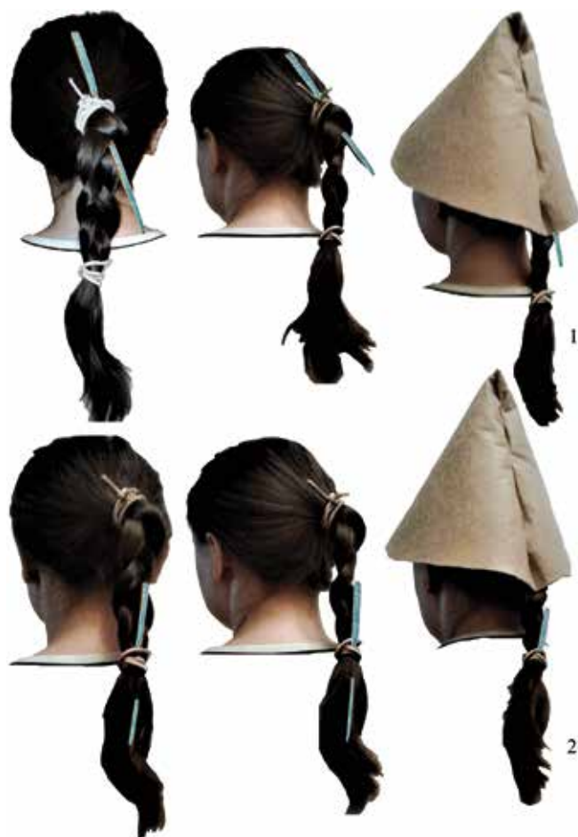
Рис. 3. Варианты гипотетической реконструкции прически с заколкой: 1 – в верхней части косы; 2 – в нижней части косы