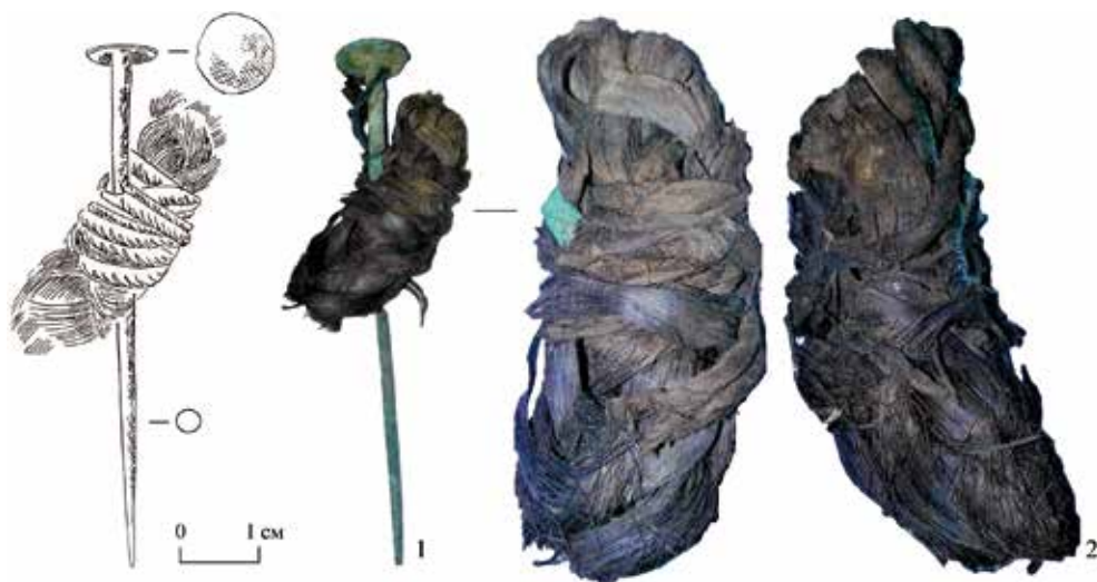
Рис. 2. Фрагмент косички на бронзовой заколке:

Выявленный элемент прически представляет собой остатки трех или четырех слабо переплетенных прядей, стянутых шерстяным шнурком в пучок, в центральную часть которого продета бронзовая «гвоздевидная» заколка. Органические остатки сохранились благодаря плотности созданного «узла» прически и заколки. Пряди на небольшом (2,5×1 см) фрагменте несколько раз переплетены между собой (рис. 2).