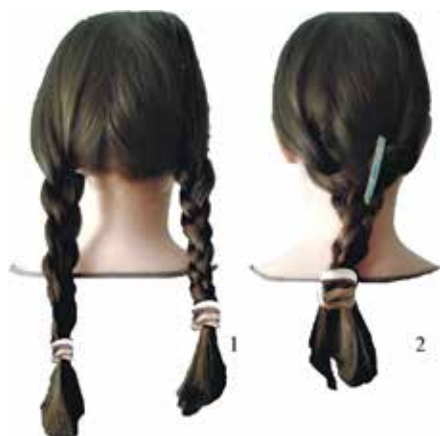
Рис. 4. Гипотетическая реконструкция прически с двумя косичками (1) и заколкой (2)