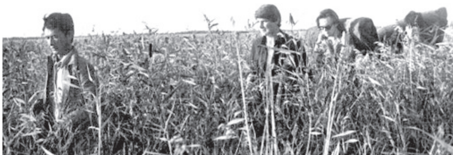
Рис. 5. Горно-Алтайская АО. Полевые будни экспедиции. Июль 1977 г.