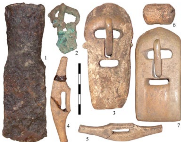
Рис. 3. Туэкта. Находки из кургана №9: 1 – железо; 2 – цветной металл; 3–7 – кость (рог?)

191/199. В самом конце рукописной описи под номером 671 обозначен «мешочек кожаный в отдельных кусках» из кургана №9 (старый номер 200) из кургана №9 памятника Туэкта. Он был обнаружен «...у середины северной стенки могилы». Другие сведения отсутствовали. По всей видимости, их можно будет восстановить по архивным источникам. На данном этапе важно их продемонстрировать в рамках запланированного контекста.