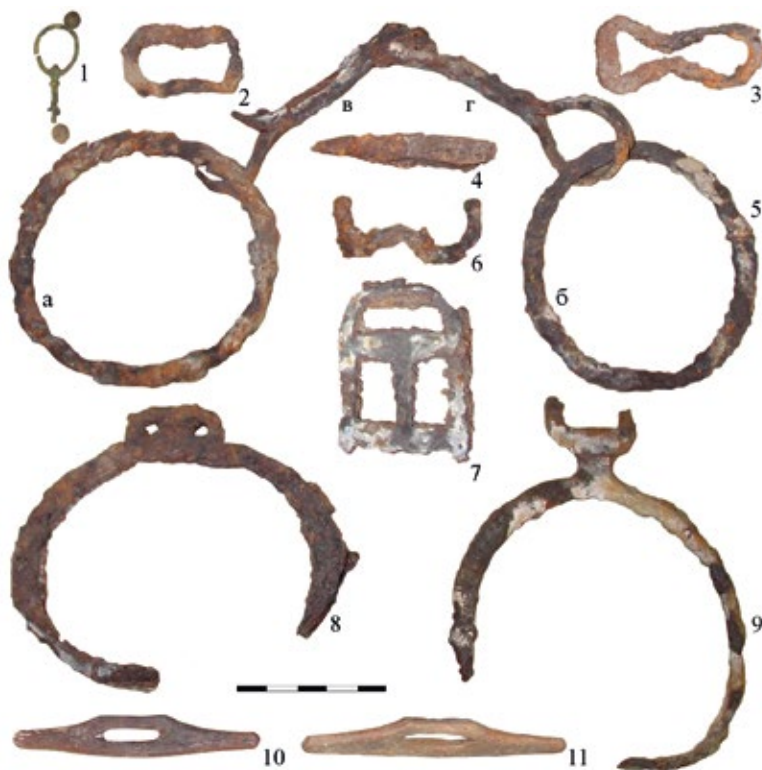
Рис. 1. Курай-VI. Находки из кургана №1: 1 – цветной металл, стекло (?); 2–9 – железо; 10–11 – кость (рог?)