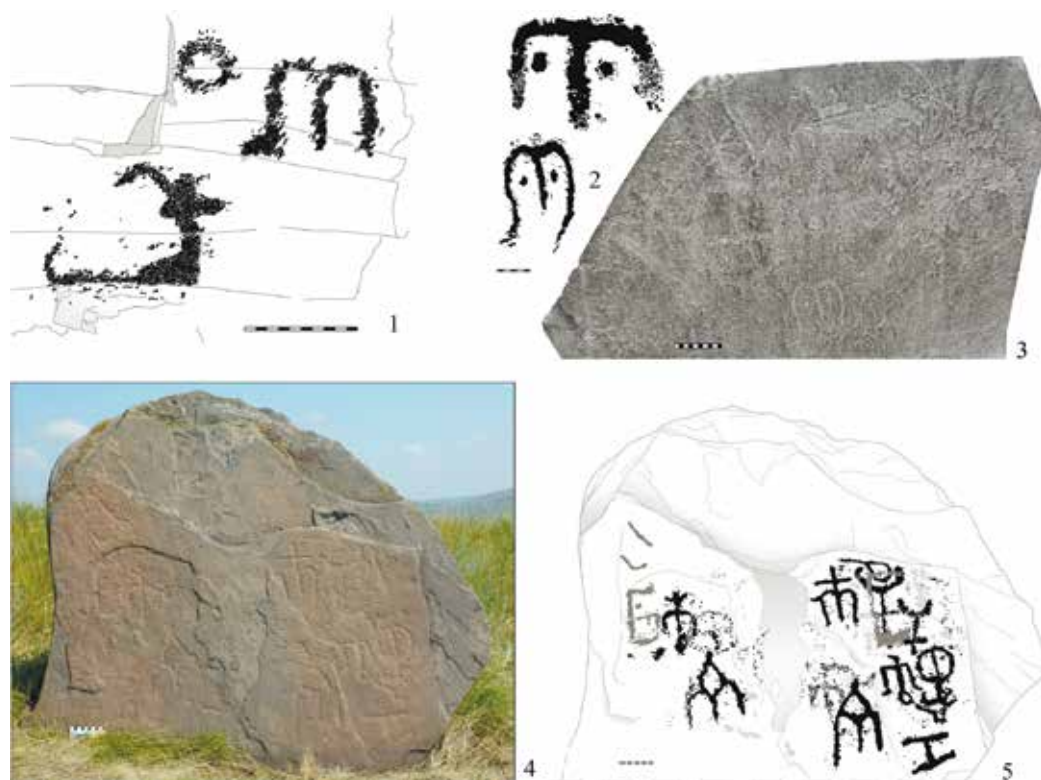
Рис. 3. «М-образные тамги» в петроглифах долины р. Ини:

1 – II Ильинская писаница; 2–5 – курганные камни под горой Георгиевской