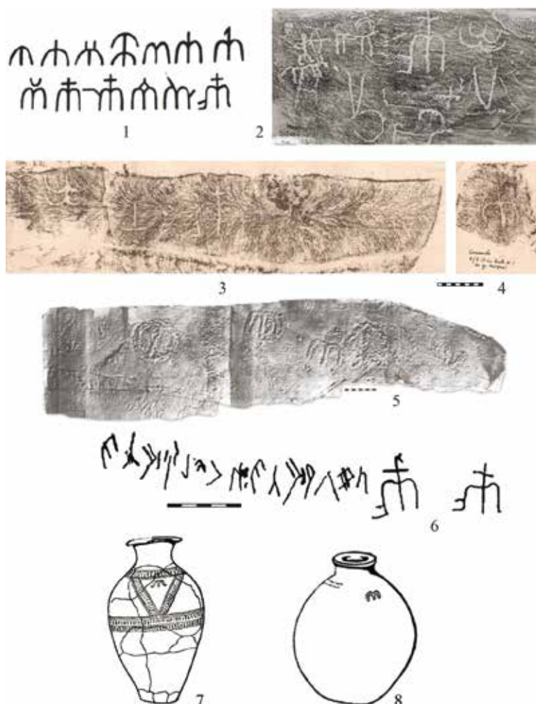
Рис. 2. «М-образные» тамги в петроглифах Среднего Енисея и на предметах из закрытых комплексов: 1 – материалы А.В. Адрианова (по: [Кызласов, 1965, рис. 8.-23–31]); 2 – Куня (по: [Есин, 2017, рис. 3]); 3, 4 – Оглахты (копии Н.В. Леонтьева в фондах музея-заповедника «Томская Писаница», ОФ №7359 (3), 7356 (4)); 5 – Копёнская писаница (по: [Миклашевич, 2018, рис. 11]); 6 – Тепсей (по: [Кляшторный, 2006, рис. 4]); 7 – могильник у с. Тесь (по: [Евтюхова, 1948, рис. 7]); 8 – могильник Джесос (по: [Евтюхова, 1948, рис. 10])

Особенностью «М-образных» тамг на курганных камнях могильников долины р. Ини является не только большее разнообразие вариаций, чем на скалах (на Ильинских писаницах их шесть, тогда как на курганных камнях в три раза больше), но и то, что представлены они скоплениями. Подобные скопления тамг, известные на многих памятниках и в разных регионах, в научной литературе названы «энциклопедиями» [Драчук, 1975, с. 105] и неоднократно анализировались специалистами [Яценко, 2001, с. 8; Marsadolov, Yatsenko, 2004; Рогожинский, 2012, с. 212; Мухарева, 2015, с. 79; и др.]. На курганных камнях долины р. Ини они выявлены трижды. Самое крупное скопление включает 12 знаков (рис. 3.-3, 4),