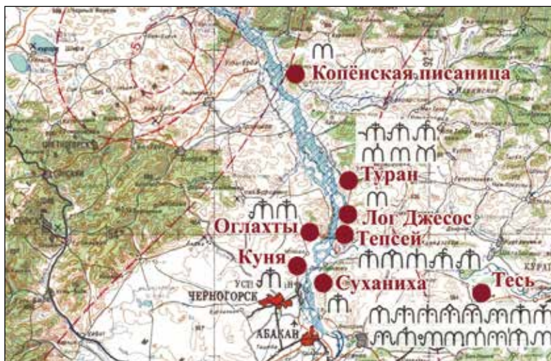
Рис. 1. Карта-схема распространения «М-образных» тамг в петроглифах Среднего Енисея

К настоящему времени на многих петроглифических комплексах Среднего Енисея выявлена представительная серия тамгообразных знаков (рис. 1). Они отдаленно напоминают букву «М», но на деле отличны от нее во многих деталях, что делает название «М-образные» весьма условным : 1) нет верхних острых углов, верхние выступы закруглены; 2) левая и правая половины прилегают вплотную; 3) внешние края не наклонены под углом наружу. Так, в архивных материалах А.В. Адрианова, собранных еще в начале XX в. и представленных в одной из публикаций Л.Р. Кызласова [1965, рис. 8.23–31], фиксируется 13 разновидностей тамг данного типа (рис. 2.-1) на Туране, Тепсее и Суханихе. Сравнительно недавно стало известно, что А.В. Адриановым подобные тамги были зафиксированы и на Копёнской писанице [Миклашевич, 2018, рис. 4.-11]. В 1960-е гг. такие знаки были выявлены на тубинском склоне горы Тепсей [Sher, 1995, р. 49, 51, 54]. По материалам Н.В. Леонтьева из фондов музея-заповедника «Томская Писаница» (см.: [Мухарева, Русакова, 2011, с. 148]) они известны в одном из пунктов горного массива Оглахты (рис. 2.-3, 4); среди петроглифов на Соснихе [Миклашевич и др., 2012, с. 28], Куне [Есин, 2017, рис. 3], а также Учуме [Трофимов и др., 2018, с. 137].