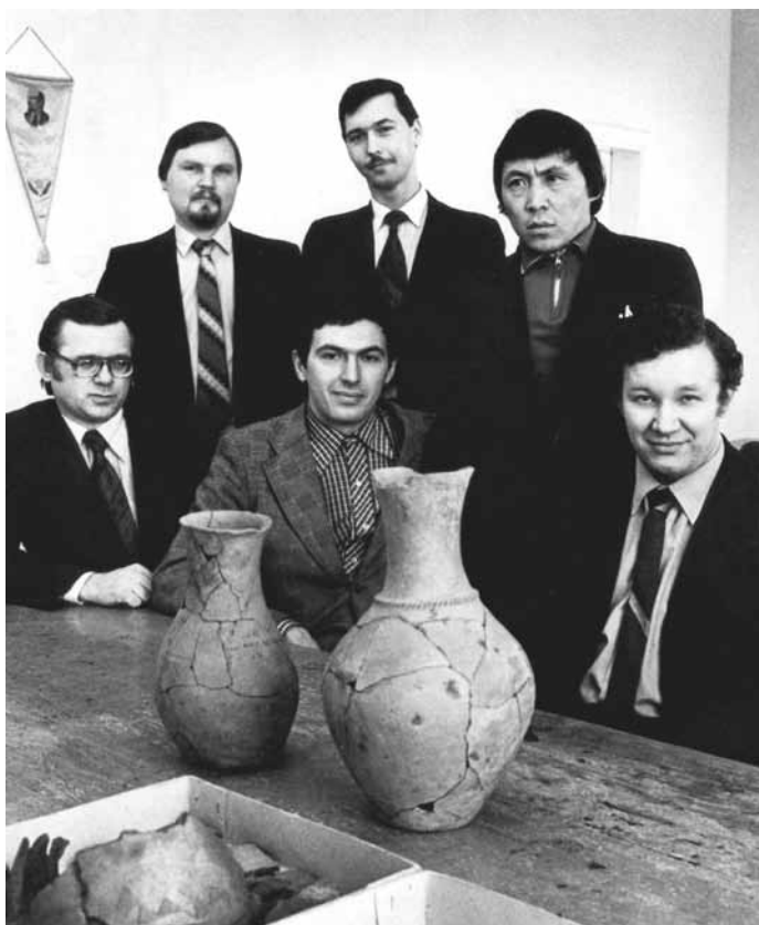
Коллектив лаборатории археологии, этнографии и истории Алтая (начало 1980-х гг.)

Все это позволило Ю.Т. Мамадакову в 1990 г. успешно защитить диссертацию на соискание ученой степени кандидата исторических наук по теме «Культура населения Центрального Алтая в первой половине I тыс. н.э.» [Мамадаков, 1990]. Защита состоялась в тогдашнем Институте истории, филологии и философии СО АН СССР (г. Новосибирск). Научным руководителем этой квалификационной работы являлся член-корреспондент АН СССР В.И. Молодин. Основным научным достижением Ю.Т. Мамадакова