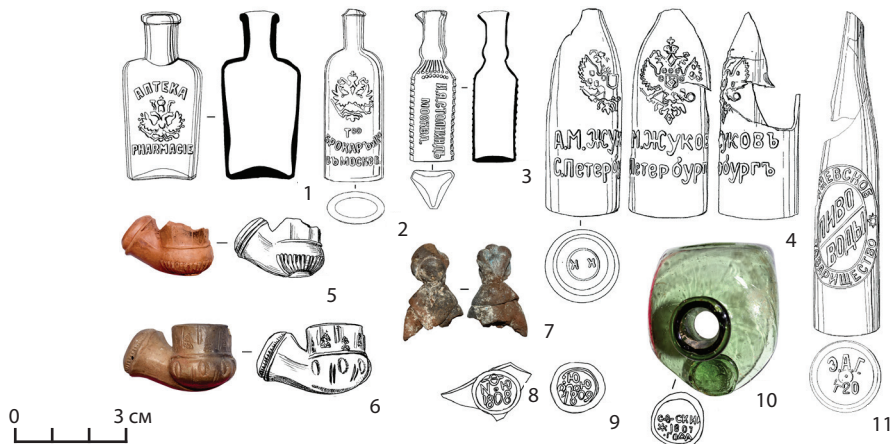
Рис. 7. Вещи из погребов: 1–4, 11 — стеклянная посуда; 5, 6 — глиняные курительные трубки; 7 — фрагмент глиняной дымковской игрушки; 8–10 — пломбы от стеклянных коньячных бутылок Fig. 7. Things from the cellars: 1–4, 11 — glassware; 5, 6 — clay smoking pipes; 7 — a fragment of a clay Dymkov toy; 8–10 — brands from glass cognac bottles

А.М. КРЮКОВА ... НЕМЪ НОВГОРОДЕ». Кроме того, сохранились две керосиновые лампы с клеймами всероссийской выставки 1882–1886 гг. и изображением императора Александра III. На фарфоровой посуде были обнаружены клейма Рижского завода (1864–1880 гг.), Тверской фабрики (1870–1889 гг.), заводов А.Г. Зацепина (1885–1898 гг.), Карякина и Рахманова (1886–1894 гг.), М.М. Куринова (конец XIX — начало XX в.), И.Е. Кузнецова (1880–1913 гг.), братьев Барминых (1895–1918 гг.), Будянской (1889–1917 гг.), Дмитровской (1891–1918 гг.), Волховской (1880–1918 гг.) фабрик (Музина, 1995; Селиванов, 2002; Дулькина, 2003; Русский фаянс..., 2010).