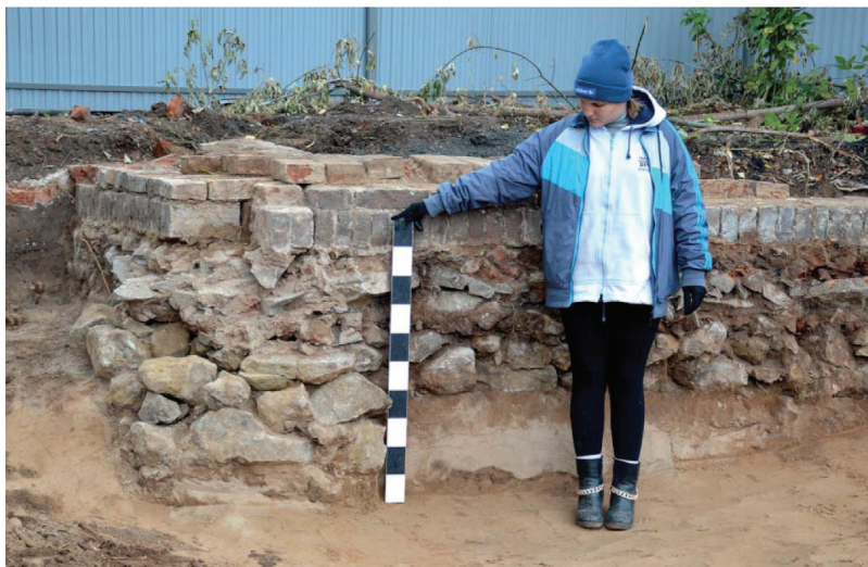
Рис. 4. Сооружение №3. Фиксация бутовой кладки фундамента