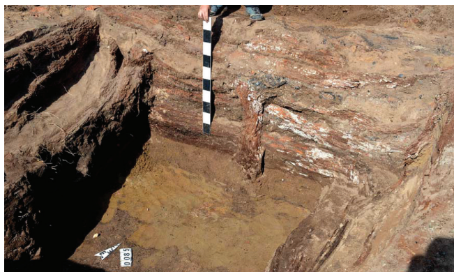
Рис. 5. Остатки деревянной конструкции в погребе №85 Fig. 5. Remains of a wooden structure in cellar №85

ца XVIII — 1-й половины XIX в. (рис. 7.-5, 6) (Самигулов, 2005, с. 298; Головчанский, 2018, с. 122; Татауров, 2020, с. 79), а также фарфоровая посуда с клеймами завода Тереховых и Киселева (1830–1850 гг.), Дулевской фабрики (1854–1864 гг.). В одной из мелких ям, находящихся рядом, был обнаружен фрагмент гжельской помадной банки, относящейся ко 2-й половине XVIII — началу XIX в. (Головчанский, 2018, с. 122). Таким образом, сооружение №2 (дом №140) можно связать с расположенными рядом объектами и отнести к началу XIX в.