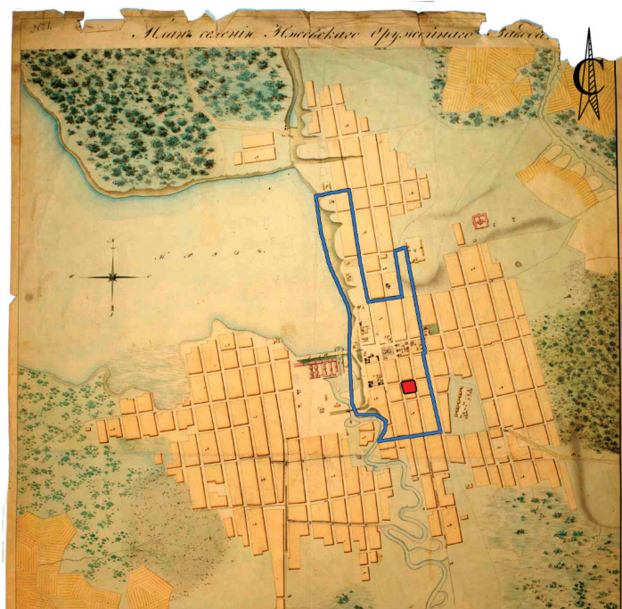
□ – границы выявленного ОАН «Поселение Ижевский завод» ■ – расположение исследуемого квартала

В советское время дома продолжали использовать с небольшими трансформациями с внешней стороны: к ним были пристроены с разных сторон двухэтажные деревянные флигели. Дома выделяли под расселение уже большего количества семей. В 2013–2014 гг. при реконструкции центральной части города Ижевска проезжая часть улицы К. Маркса была расширена. В итоге восточная часть квартала, где располагались жилые здания, оказалась под тротуарами и проезжей частью с полной утратой домов. Оставшаяся часть квартала с ветхими домами была снесена через несколько лет. В южной половине исторического квартала находится двухэтажное здание, в котором на данный момент размещено Министерство здравоохранения.