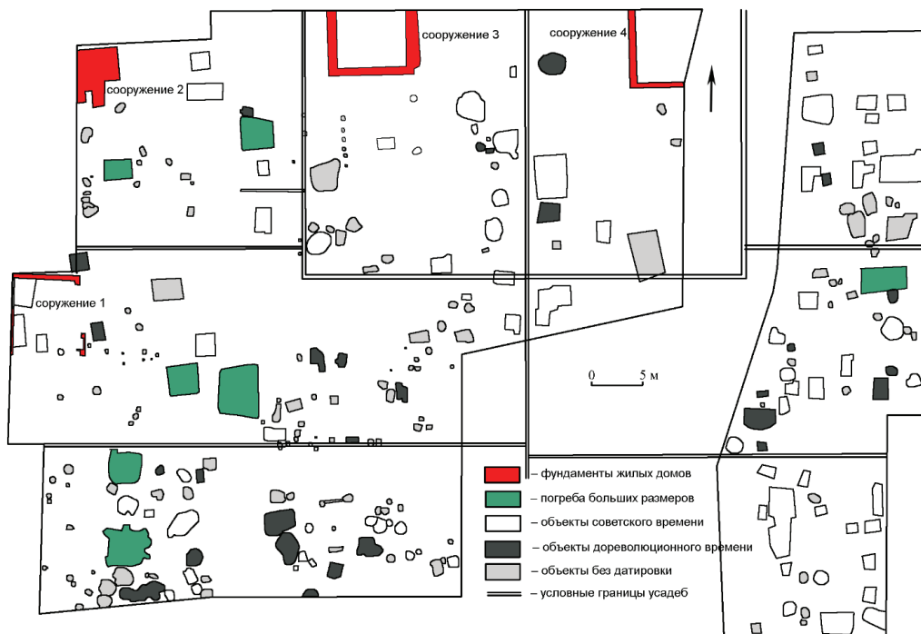
Рис. 2. План расположения изученных объектов с условным выделением усадеб Fig. 2. Layout of the studied objects with conditional allocation of estates

из возможных причин — снос линии жилых домов при расширении улицы К. Маркса. Всего в изученной северной части исторического квартала, ограниченного улицами Красной, Пастухова, К. Маркса и переулком Интернациональным, насчитывалось восемь домов: три дома выходили на улицу Красную, три — на ул. К. Маркса и два — на ул. Пастухова. Скорее всего, южная часть квартала была симметрична по строению.