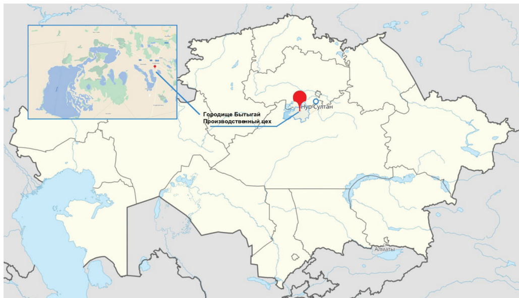
Рис. 1. Карта расположения средневекового городища Бытыгай

Городище Бытыгай, памятник XIII–XVI вв., находится на левом берегу р. Нура, в 1 км к востоку от села Коргалжин Акмолинской области Республики Казахстан (рис. 1). Памятник расположен в северной части Сарыарки, состоящей из серии низкогорий, невысокого мелкосопочника и степи (Вилесов, Науменко, Аубекеров, 2009, с. 92; Бейсенов, 2000, с. 113–116).