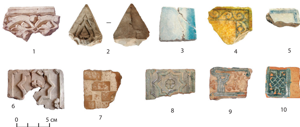
Рис. 4. Строительные и декоративные материалы: 1–5 — мавзолей Бытыгай; 6–10 — мавзолей Жанибек-Шалкар Fig. 4. Construction and decorative materials: 1–5 — Bytygay mausoleum; 6–10 — Zhanibek-Shalkar mausoleum

На территории городища Бытыгай также применялся метод двойного обжига. Первый обжиг делали с целью укрепления основания, второй обжиг проводили для стабилизации орнамента и глазури. Подобный обжиг производился в печах непрерывного действия при температуре от 900 до 1250 °С и выше. После охлаждения плитка приобретала высокую механическую прочность. Обжиг изделий завершает технологический процесс изготовления плитки. Конечным продуктом стали терракотовые кирпичи и плитки разных размеров и типов, покрытые глазурью.