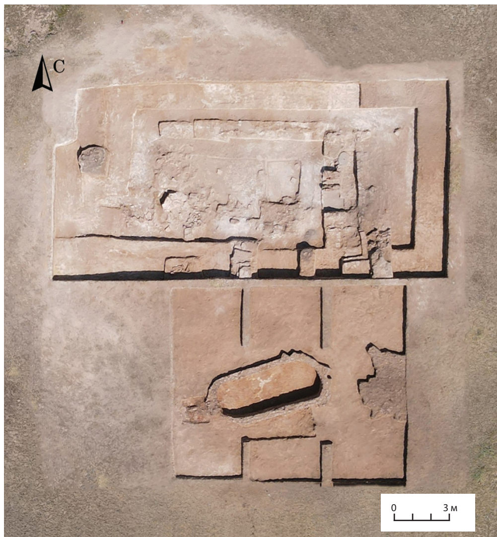
Рис. 2. Аэрофотосъемка городища Бытыгай и план раскопа Fig. 2. Aerial photography of the Butygai settlement and excavation plan

ние осуществлялся с южной стороны через лестничную конструкцию (рис. 3.-8). Основа ступенек сделана из материкового останца, а затем обложена обожженными кирпичами; их ширина 0,9 м, высота 0,2 м. Размер кирпичей 12×12×4 см.