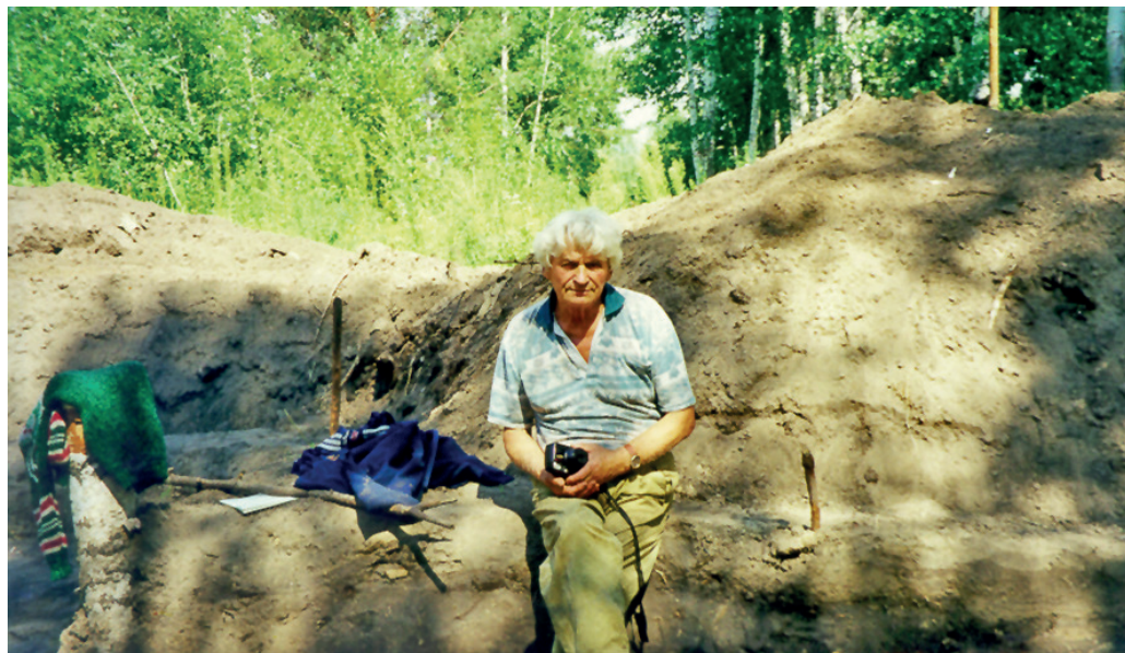
Рис. 6. На раскопках в Окунево