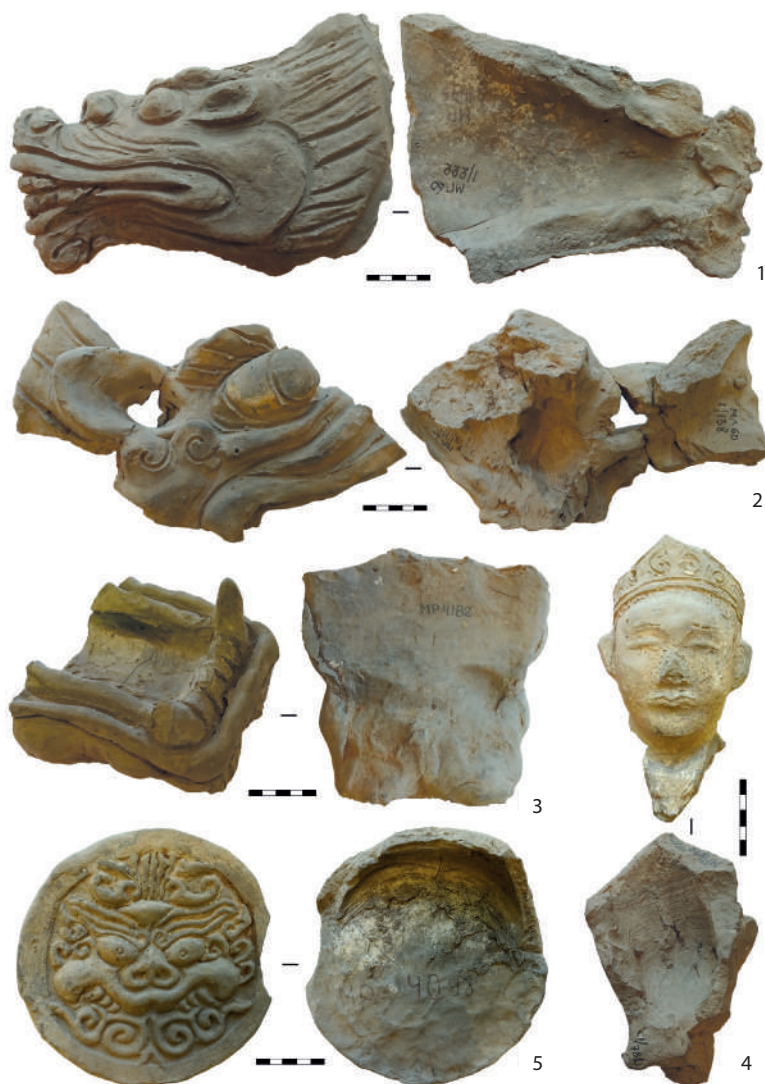
Рис. 3. Находки из коллекции: 1 – архитектурный фрагмент в виде головы дракона (инв. № МР-4175, размеры 15×9 см); 2 – архитектурный фрагмент в виде части головы дракона (инв. № МР-4113, длина 25 см); 3 – архитектурный фрагмент в виде части нижней челюсти дракона (инв. № МР-4182, длина 17 см); 4 – архитектурный фрагмент в виде головы человека (инв. № МР-4122, длина 14 см); 5 – диск полуцилиндрической черепицы (инв. № МР-4098, диаметр 15,5 см)

Fig. 3. Finds from the collection: 1 – an architectural fragment in the form of a dragon's head (Inventory No. MP-4175, dimensions 15 × 9 cm); 2 – an architectural fragment in the form of a part of a dragon's head (Inventory No. MP-4113, length 25 cm); 3 – an architectural fragment in the form of a part of the lower jaw of a dragon (inv. No. MP-4182, 17 cm long); 4 – an architectural fragment in the form of a human head (inv. No. MP-4122, length 14 cm); 5 – a disk of a semi-cylindrical tile (Inventory No. MP-4098, diameter 15.5 cm)