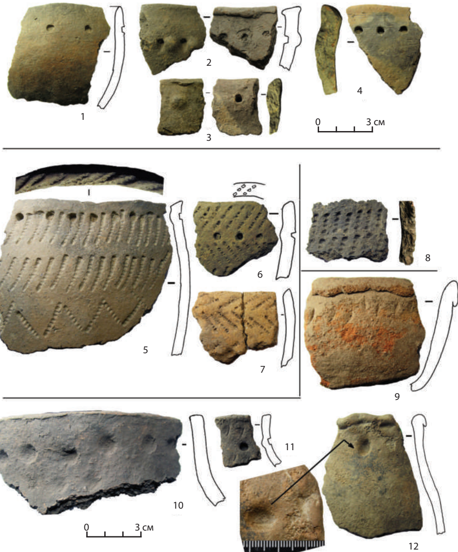
Рис. 1. Поселение Курлек. Фрагменты керамической посуды: 1–4 — быстринская культура; 5–7 — фоминский этап кулайской культуры; 8–12 — майминская культура Figure 1. Kurlek settlement. Fragments of ceramic ware: 1–4 — Bystryanskaya culture; 5–7 — Fominskii stage of Kulaiskaya culture; 8–12 — Mayminskaya culture

поля, в другом — отделял одну орнаментальную строку от другой. Ямки наносились уже поверх отпечатков гребенчатого штампа либо отпечатки гребенчатого штампа перекрывали ямки, т. е. последовательность нанесения орнаментальных элементов не прослеживается, однако можно констатировать, что во всех случаях, когда совмещаются ямки с другим элементом, они перекрывают друг друга.