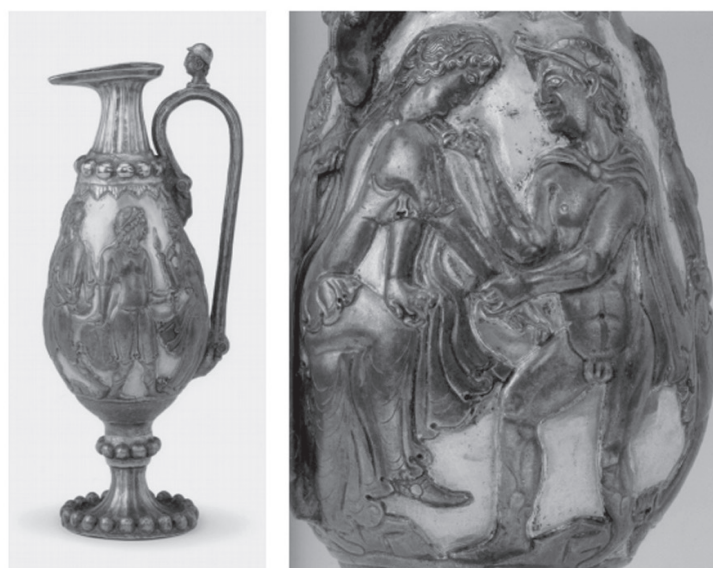
Рис. 3. Сосуд, обнаруженный в погребении Ли Сяня (504–569 г.) и его супруги со сценами в античном стиле (очевидно, изображение Париса и греческих богинь); 1 – прорисовка, 2 – фотография [Гэ Чэньюн, 2015: 117]

Fig. 3. A vessel found in the burial of Li Xian (504–569) and his wife with scenes in the antique style (apparently, the depiction of Paris and the Greek goddesses); 1 – drawing, 2 – photograph [Ge Chengyung, 2015: 117]