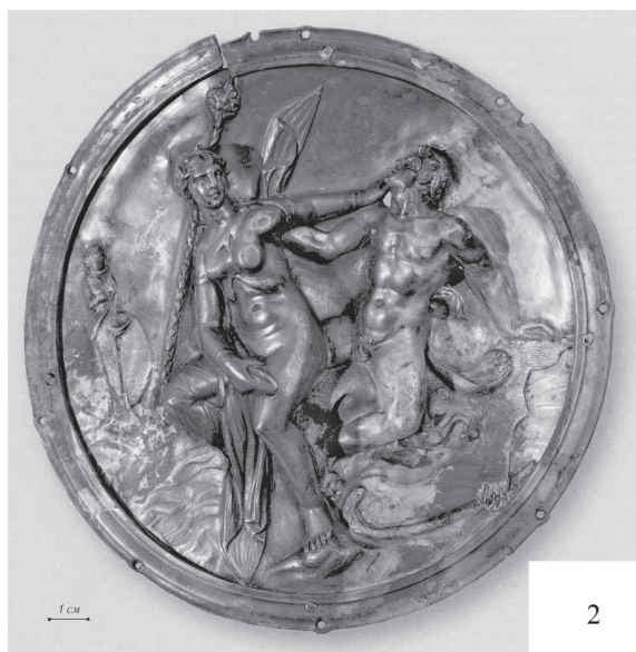
Рис. 1. 1 – копьеносец (а) и трубящий кентавр (б), изображения на ткани, могильник Сампул, Синьцзян-Уйгурский АР (радиоуглеродная датировка – I в. до н. э.) [Jones, 2009: 23]; 2 – серебряная бляха из Двадцатого ноин-улинского кургана [Полосмак и др., 2011: 111] Fig. 1. 1 – spear-bearer (a) and trumpeting centaur (b), images on fabric, Sampul burial ground, Xinjiang Uygur AR (radiocarbon dating – 1st century BC) [Jones, 2009: 23]; 2 – a silver plaque from the Twentieth Noin-Ula mound [Polosmak et al., 2011: 111]