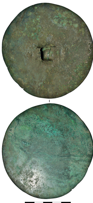
Рис. 5. Металлическое зеркало из захоронения объекта № 20 некрополя Карбан-1

На оборотной стороне в центре зеркала имеется петля из тонкой широкой пластинки. В месте крепления держателя к диску выделяются небольшие выступы, по-видимому, сделанные для лучшей фиксации ручки. Диаметр зеркала — 10,3×9,7 см, толщина — 0,2 см. Ширина петли — 0,7 см, толщина — 0,2 см, высота держателя по отношению к диску — 0,7 см. находка покрыта патиной, отличающийся по цвету с внешней и внутренней сторон.