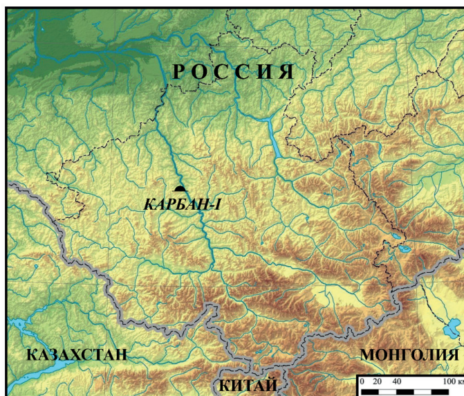
Рис. 1. Место расположения комплекса Карбан-I на карте-схеме Республики Алтай Fig. 1. Location of the Karban-I complex on the schematic map of the Altai Republic.

Курган № 20 выявлен в юго-западной части раскопа 2, включающего большую часть комплексов раннескифского времени. Обозначение «курган» в данном случае имеет условный характер, так как над каменным ящиком не была обнаружена насыпь из камней, которая, как правило, возводилась над погребениями рассматриваемого периода (рис. 2). При этом нельзя исключить, что наземная конструкция изначально была, но не сохранилась в связи со спецификой использованных материалов.