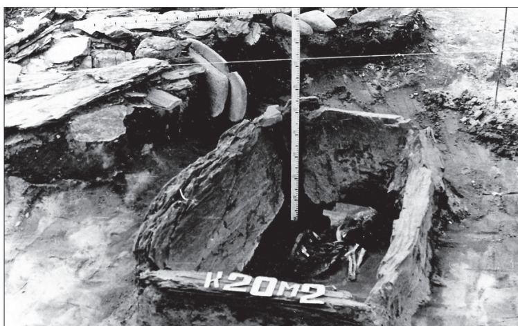
Рис. 2. Карбан-I. Вид с востока на каменный ящик объекта № 20 Fig. 2. Carbane-I. View from the east of the stone box of object No. 20

Курган № 20 выявлен в юго-западной части раскопа 2, включающего большую часть комплексов раннескифского времени. Обозначение «курган» в данном случае имеет условный характер, так как над каменным ящиком не была обнаружена насыпь из камней, которая, как правило, возводилась над погребениями рассматриваемого периода (рис. 2). При этом нельзя исключить, что наземная конструкция изначально была, но не сохранилась в связи со спецификой использованных материалов.