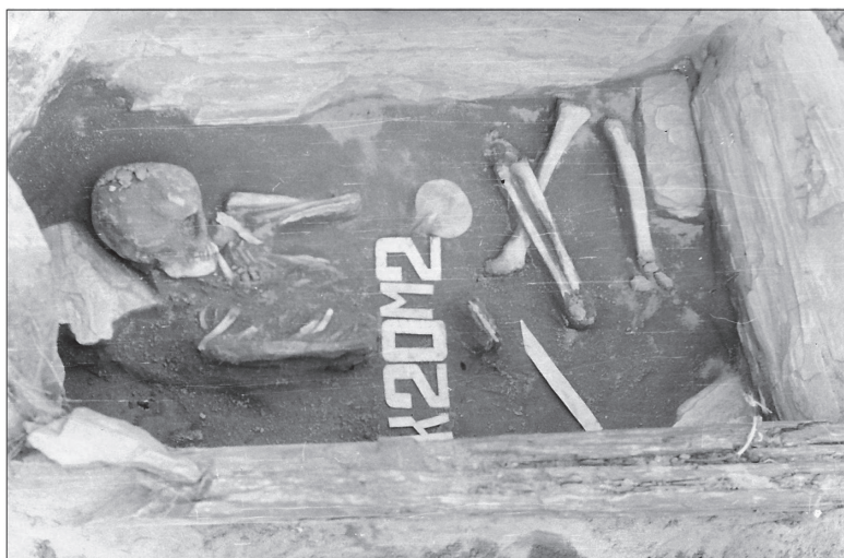
Рис. 3. Карбан-1. Погребение кургана № 20

В ходе раскопок обнаружен каменный ящик, сложенный из пяти крупных плит. Данная конструкция была заглублена в материк, и стенки ее не выступали над современной поверхностью почвы. Перекрытие ящика не обнаружено, но в юго-западной части заполнения находились три более крупных камня. Ящик, размеры которого по дну составляли 1,2×0,6 м, имел прямоугольную форму и был ориентирован длинными сторонами по линии запад — северо-запад — восток — юго-восток (рис. 4.-1-2). Длинная северо-восточная стенка состояла из двух плит, за счет чего северный угол сооружения был немного скруглен.