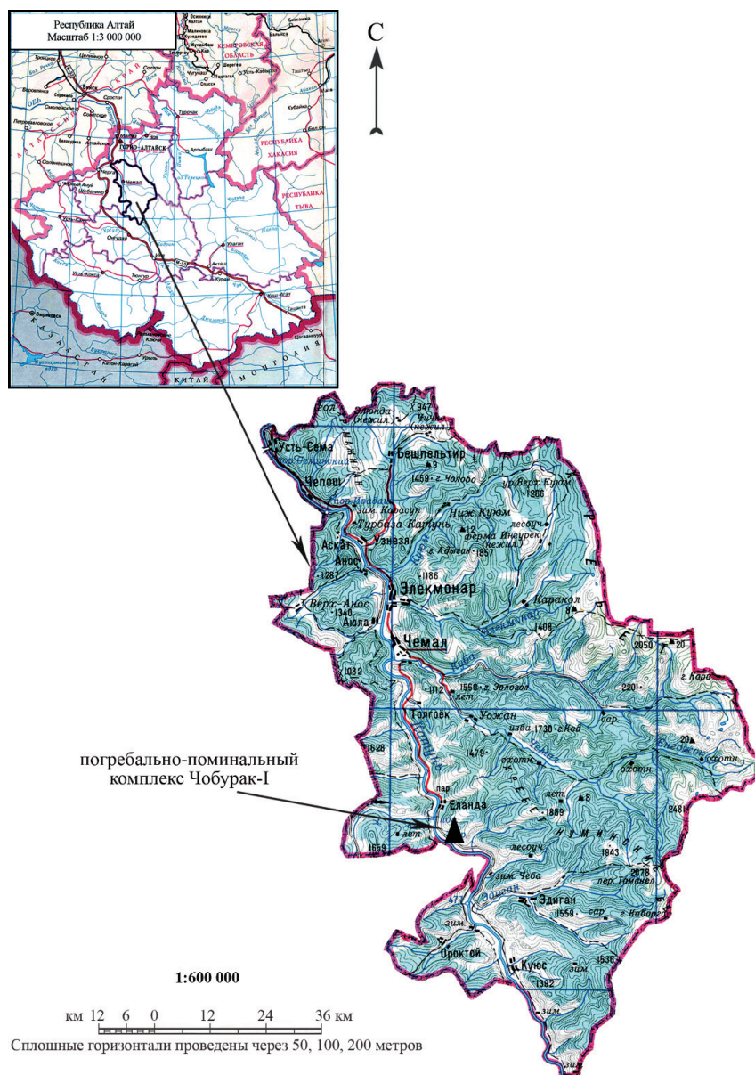
Рис. 1. Расположение погребально-поминального комплекса Чобурак-1