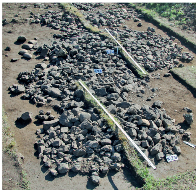
Рис. 2. Часть цепочки курганов булан-кобинской культуры памятника Чобурак-I Fig. 2. Part of the chain of mounds of the Bulan-Kobin culture of the monument Choburak-I