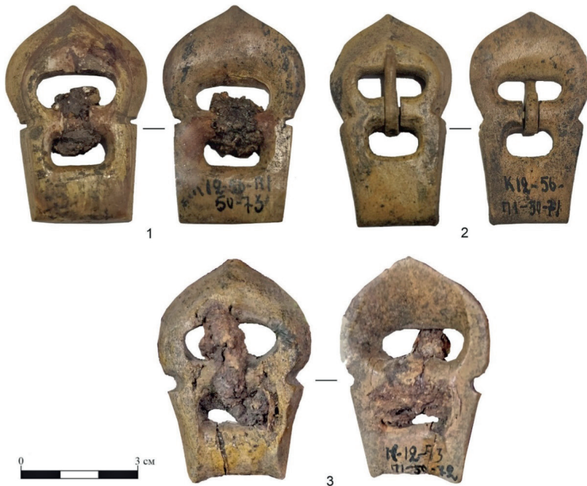
Рис. 5. Подпружные пряжки. Курган № 12, могила 1: 1, 2 — КМАЭЭ ВА 74/146, 283;

Третья пряжка (ПГКМ КП 412) также фигурно вырезана из рога животного, состоит из полукруглой заостренной рамки и неподвижного щитка. Щиток трапецевидной формы, заужен к основанию. Основание щитка вогнутое. В рамке и щитке овальные прорезы разной величины для язычка и ремня. Язычок железный, деформирован из-за коррозии металла. Крепится язычок к круглой в сечении монолитной перемычке. Между рамкой и щитком с внешних сторон глубокие вырезы. Пряжка с обеих сторон обработана и отшлифована. На оборотной стороне нанесен полевой шифр — К 12-56-П1-50-72. Длина общая — 5,3 см, ширина щитка (max) — 2,7 см, ширина рамки — 3,4 см, длина язычка — 2,9 см, толщина изделия — 0,8 см (рис. 5.-3).