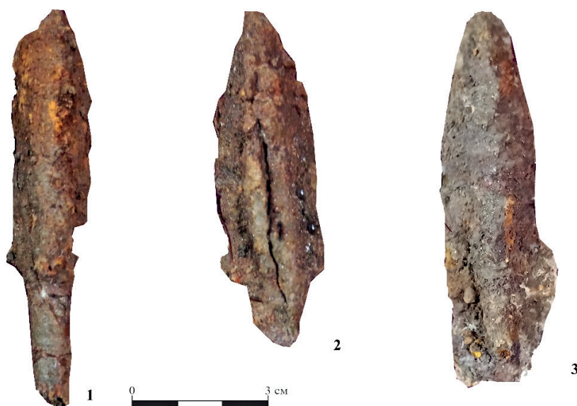
Рис. 7. Трехгранные наконечники стрел, железо. Курган № 12, могила 1. Фонды ПГКМ, 1 – КП 408; 2 – КП 410; 3 – КП 416

Фрагменты железных удил не позволяют точно указать их тип. Вероятнее всего, в могиле 1 были представлены удила с крюковым соединением [Горбунов, Тишкин, 2022: 63–63, 248, рис. 117; Тишкин, Горбунов, Казаков, 2002: 66, табл. 1.–1, 2].