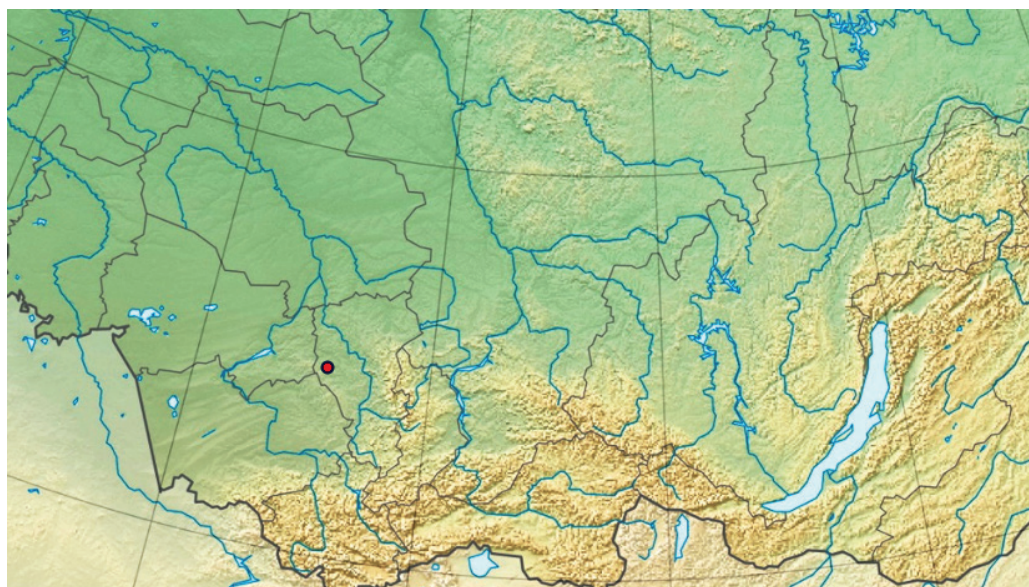
Рис. 1. Местонахождение могильника Ур-Бедари II Fig. 1. Location of Ur-Bedari II burial ground