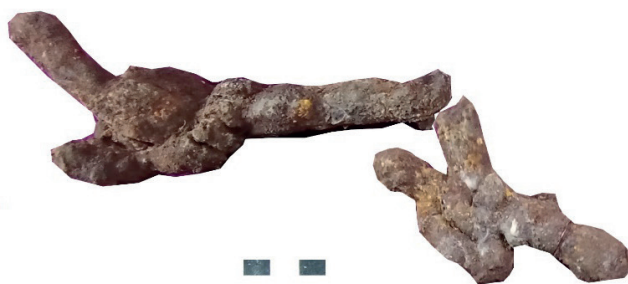
Рис. 6. Курган № 12, могила 1. Захоронение коня. Из грабительской ямы фрагменты удил, железо [Елькин, 1956: 4, 23, 44]. Фонды ПГКМ, КП 404 Fig. 6. Mound No. 12, grave 1. Horse burial. From a robbery pit. Fragments of fishing rods, iron [Yelkin, 1956: 4, 23, 44]. Funds of PGOM, KP 404

Из других артефактов в фондах музея Прокопьевского городского краеведческого музея представлены: фрагменты железных удил (ПГКМ КП 404) плохой сохранности (рис. 6); железный фрагмент подножия стремени (ПГКМ КП 405); три железных трехгранных наконечника стрел (ПГКМ КП 408, 410, 416) (рис. 7).