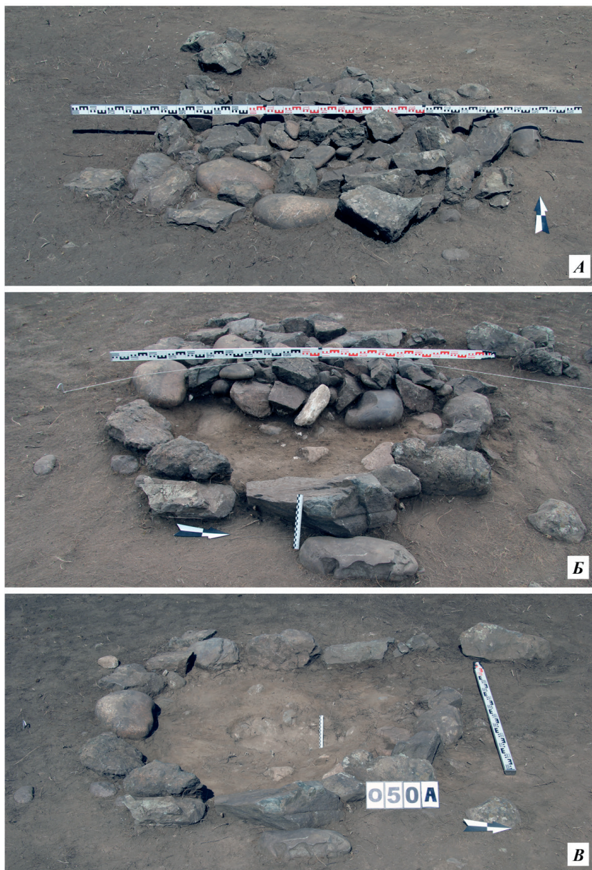
Рис. 2. Чобурак-I, оградка 50а: А – наземная конструкция после зачистки; Б – разрез объекта; В – подквадратная основа конструкции с ямкой в центре Fig. 2. Choburak-I, enclosure 50a: A – ground structure after clearing; B – section of the object; B – sub-square base of the structure with a hole in the center

дившимися в 10 м к югу рядом стоящими оградками 7–8 и 9–10, раскопанными в 2007 г. [Семибратов, Матренин, 2008: рис. 4, 5].