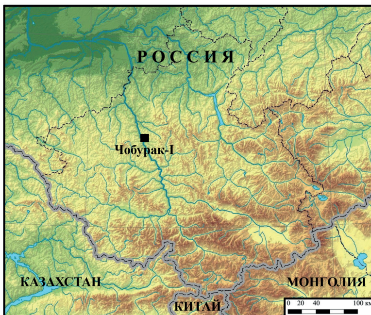
Рис. 1. Расположение погребально-поминального комплекса Чобурак-I

Различным аспектам анализа и интерпретации тюркских поминальных комплексов Алтая посвящено значительное количество публикаций, в том числе работ обобщающего характера [Васютин, 1983; Кубарев, 1984; Матренин, Сарафанов, 2006; Серегин, Шелепова, 2015; Серегин, Васютин, 2021]. Пристальное внимание к объектам данного региона не случайно — они остаются наиболее информативными для решения целого ряда ключевых проблем истории кочевников второй половины I тыс. н. э.: от вопросов происхождения культуры тюрков и особенностей ее трансформации на различных этапах до реконструкции материальной и духовной культуры номадов. Вместе с тем, в последние годы наблюдается практически полное отсутствие полевых исследований на Алтае, направленных на раскопки тюркских поминальных памятников. Редким исключением являются работы Чемальской экспедиции Алтайского государственного университета на комплексе Чобурак-I, в ходе которых происходит планомерное расширение корпуса источников по археологии кочевников рассматриваемой общности. В настоящей статье представлены результаты раскопок одной из раннесредневековых оградок обозначенного памятника.