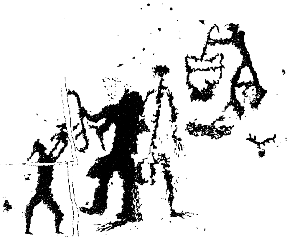
Рис. 2. Передача божественных символов власти на фоне древней системы традиционных верований (по: Ларичев В.Е., 2005, с. 135).