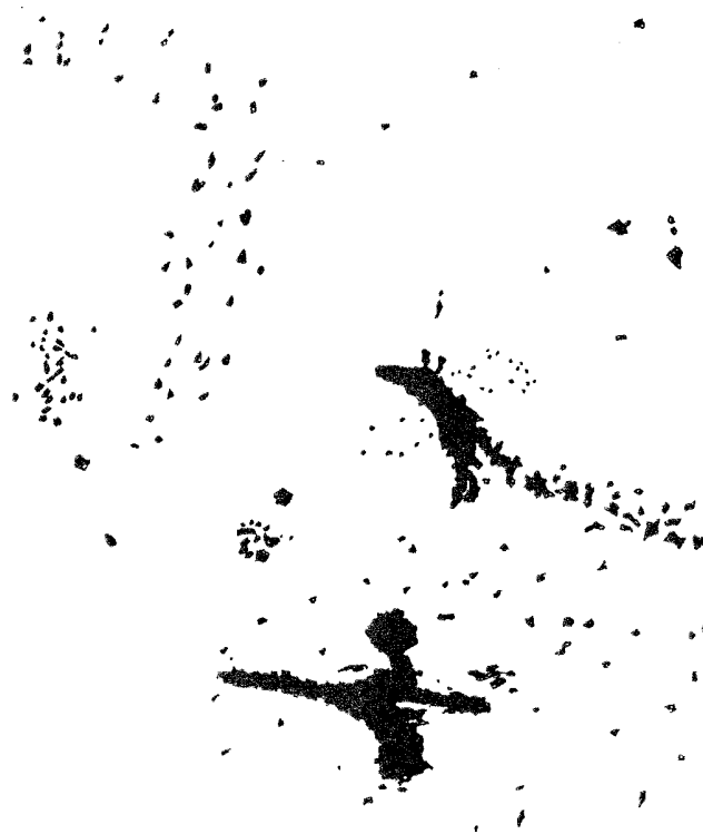
Рис. 4. Лось и Молодой Герой со «свастикой» в руках под предполагаемой линией «прецессии» (по: Ларичев В.Е., 2002, с. 219).