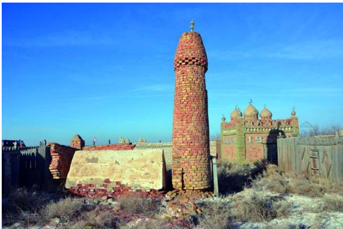
Рис. 7. Башнеобразный памятник в мусульманском кладбище с. Бирлик Казалинского района Кызылординской области.

Примечательно, что Э. Байтеновым были выявлены в Кызылординской области почти аналогичные огузским башням сооружения из сырца и обожженного кирпича у казахов XVIII–XX вв., воздвигнутые для душ умерших. Они также внутри не имеют следов захоронений (Байтенов Э., 1990, с. 337–344). Сооружения типа «дын» этнографического времени и небольших размеров зафиксированы и в Карагандинской области (Ошанов О.Ж., 2004, с. 97–99). В 70-х гг. XX в. в ряде узбекских поселений Южного Казахстана были выявлены небольшие башнеобразные сооружения для духов предков (Тайжанов К., Исмаилов Х., 1980, с. 87–93).