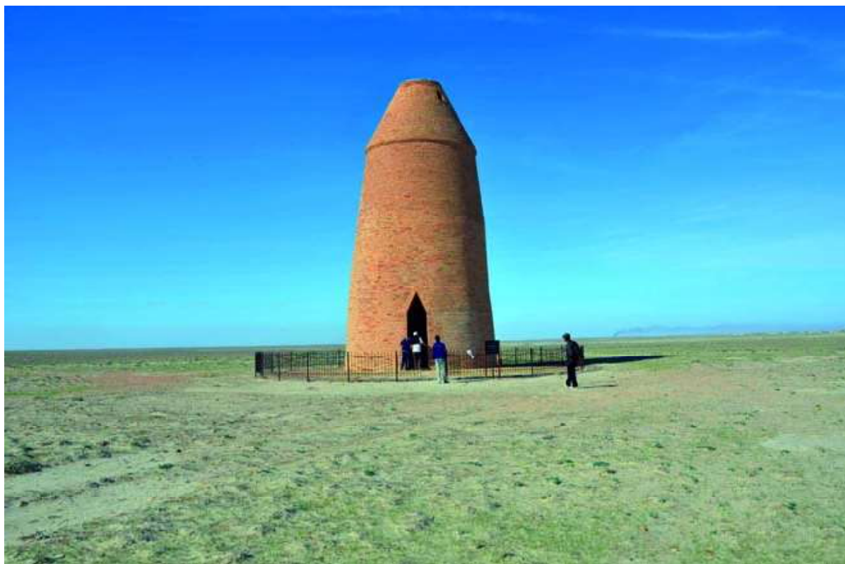
Рис. 4. Сооружение Сараман-Коса. XI в. 2012 г.

Сараман-Коса, Бегим-Ана и Узынтам архитектурными формами резко отличаются от синхронных по времени мусульманских мавзолеев Средней Азии. Сырдарьинские сооружения по времени близки с загадочной башней Ак-Сарай-Динг, которая располагается в северной части Туркмении и относится к XI–XII вв. (Хмельницкий С.Г., 1996, с. 160). В соответствии с туркменской легендой Ак-Сарай-Динг была возведена местным богачом, чья дочь умерла до того, как выйти замуж. Девушка явилась ему во сне и попросила его соорудить ей «кеджебе» – седло с балдахином, традиционно водружаемое на верблюда невесты во время туркменских свадебных процессий. Поэтому отец построил на могиле (?) дочери башню Ак-Сарай-Динг. По преданию, из-за боязни обрушения в начале XII в. нижний ярус башни был засыпан землей (Восстановление..., 2007, с. 33).