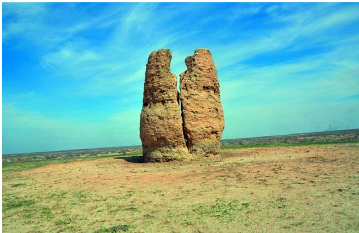
Рис. 2. Сооружение Узынтам. IX–X вв. 2012 г.

Менее чем в 15 км от Бегим-Ана располагается другая башня, известная как Узынтам. Сооружение в плане круглое, диаметр у основания около 7 м (рис. 2). Башня сооружена из сырцового кирпича размерами 22–23×22–23×5–5,5 см и имеет цилиндрическую, слегка сужающуюся в верхней части тело высотой до 10 м. Внутри располагается камера со сводчатым перекрытием. Выше сохранились остатки площадки, обнесенной парапетом.