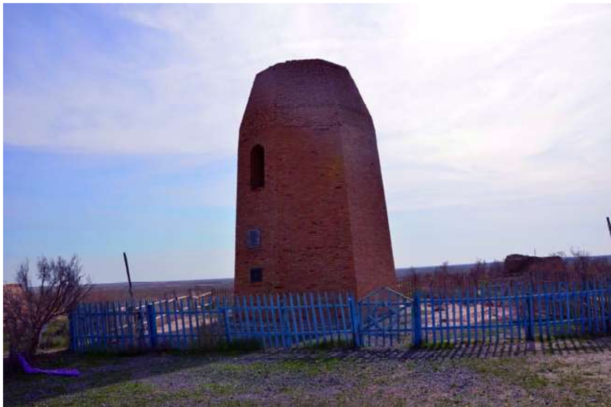
Рис. 1. Сооружение Бегим-Ана. X в. 2012 г.

Деггарон, Шабурган-ата (Пугаченкова Г.А., 1963, с. 30; Крюков К.С., 1964, с. 155–165). По мнению С.Г. Хмельницкого (1996, с. 48), квадратный кирпич со сторонами 20–23 см был характерен для построек среднеазиатского региона IX–X вв.