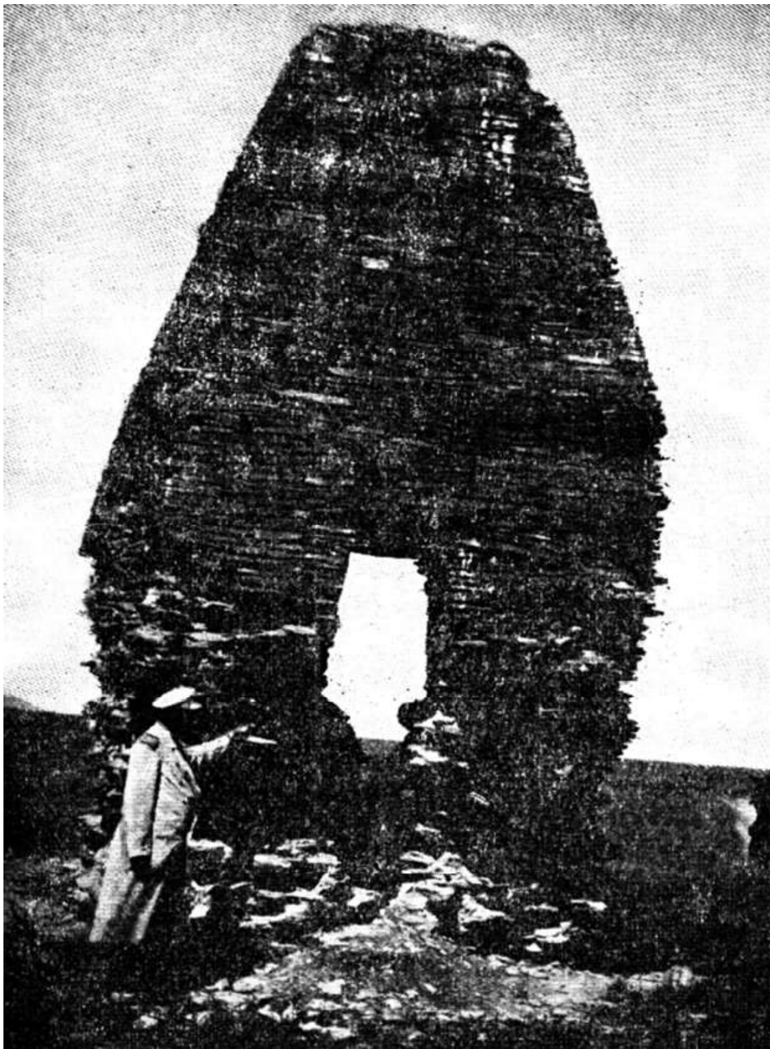
Рис. 6. Памятник Дынгек. IX в. Из книги Н. Пантусова 1902 г.

душа у тюркских народов представлялась в виде птицы: «...по турецким народным верованиям, душа обращалась в птицу или насекомое; об умершем говорится, что они улетают (учду)...» (Бартольд В.В., 1967, с. 30).