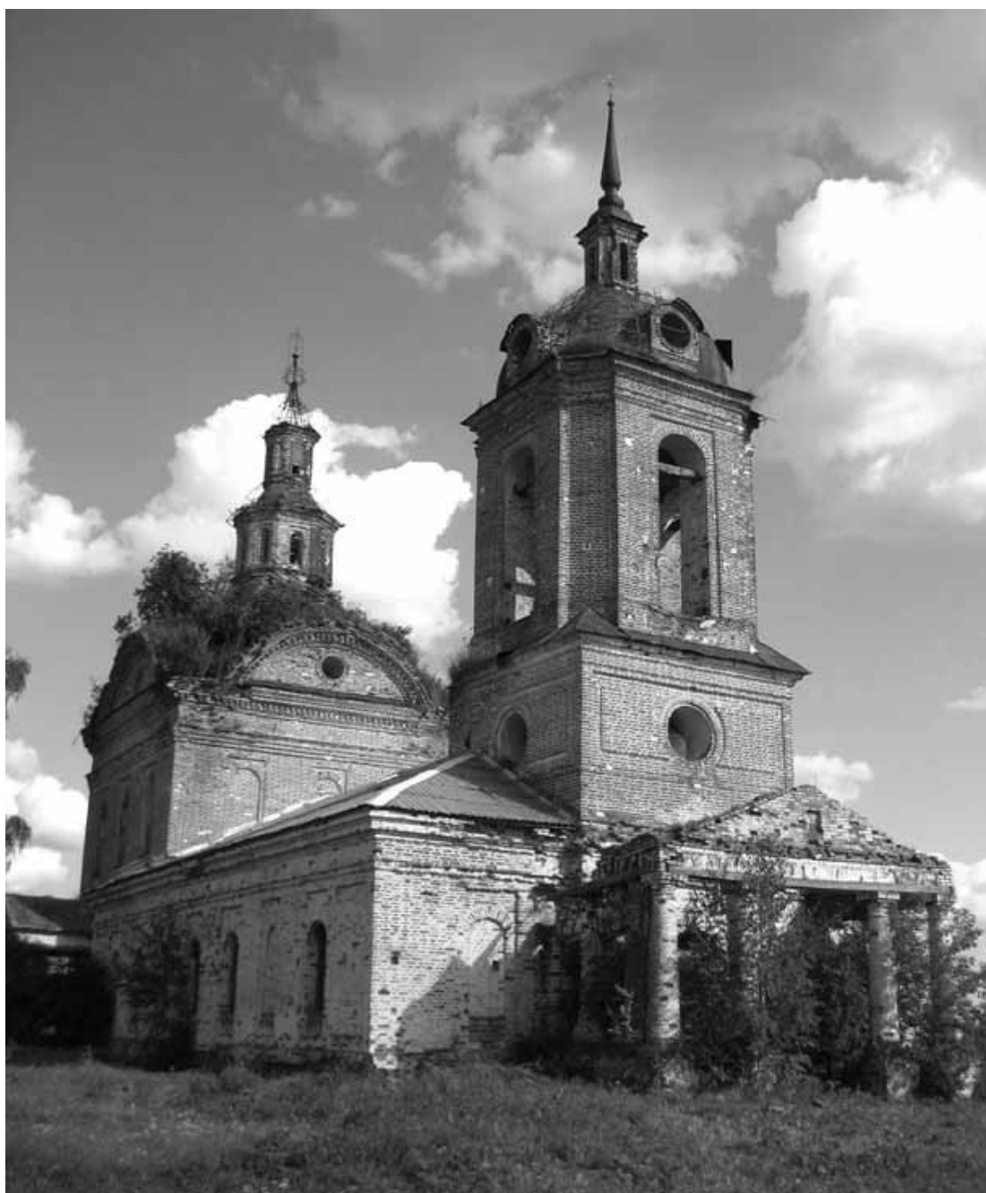
Рис. 9. Церковь Троицы Живоначальной. Елово. Удмуртия

Конец XVIII в. ознаменовался расцветом классицизма. В провинции, включая вятские земли, этот стиль утверждался медленно, сосуществуя с более ранними архитектурными формами. В этом отношении примечателен фотоснимок центральной площади города Слободского, сделанный в начале прошлого века. На нем видно, как на небольшом пяточке сосуществуют друг с другом стили нескольких культурных эпох, от древнерусской до эклектики конца XIX в., включая, разумеется, и классицизм (рис. 7).