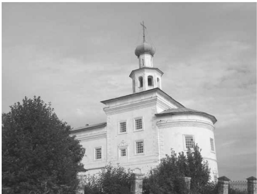
Рис. 4. Храм Иоанно-Богословского монастыря. Чердынь Пермского края