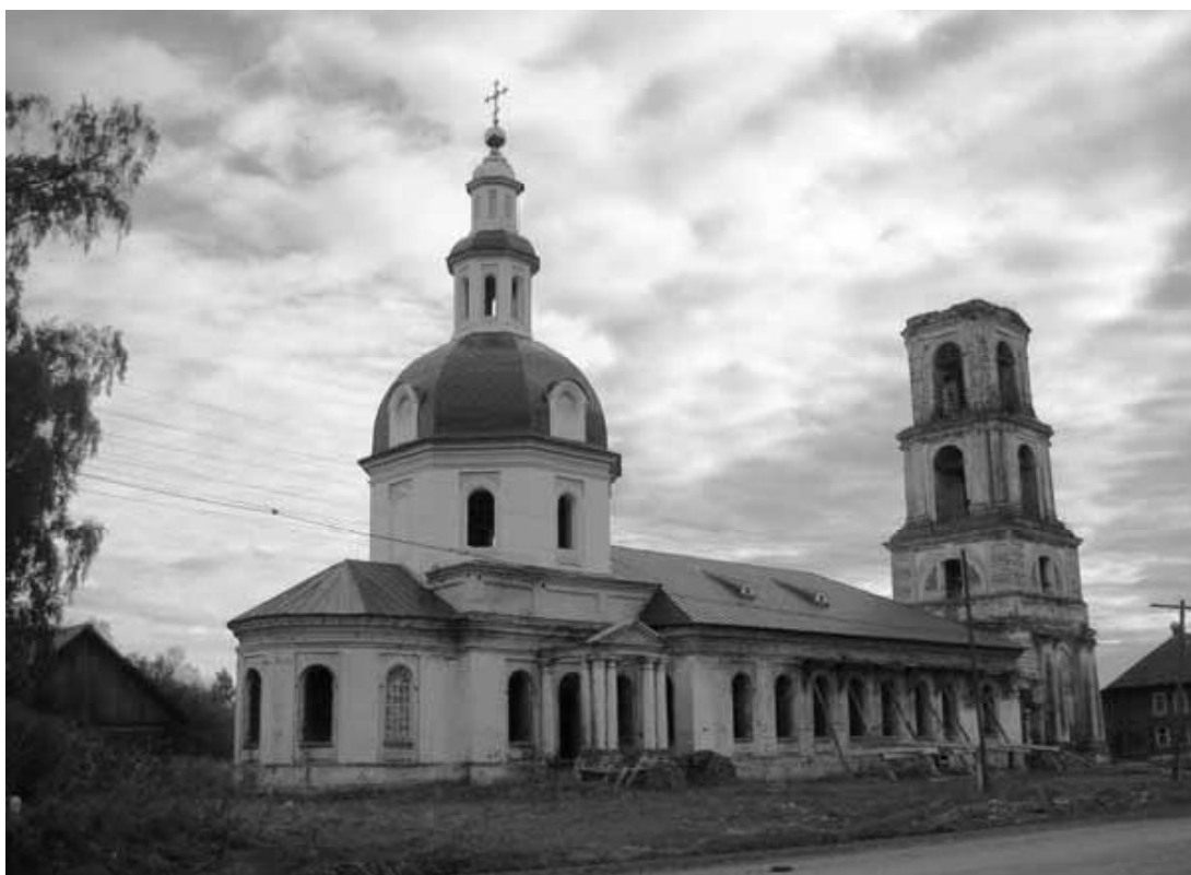
Рис. 8. Вознесенская церковь. Узи. Удмуртия