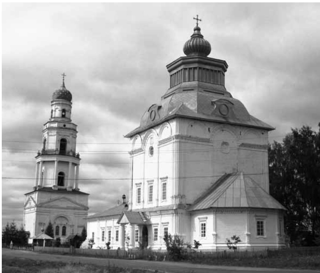
Рис. 6. Храм Спаса Преображения. Великорецкое Кировской области

Заключая этот раздел, вновь обратимся к мнению профессора В.В. Бычкова. Он заметил: «Все ли эти характеристики суть барокко и складывается ли на их основе особый вариант «русского барокко» или некое иное культурное образование, для нас в данном случае не столь важно. Главное, что почти все перечисленные особенности нового типа русской культуры в основе своей – эстетические характеристики и свидетельствуют о значительном развитии эстетического сознания того времени и притом в направлении усиления внимания к формам выражения и их динамизму и роста многообразия самих этих форм» (Бычков В.В., 1992, с. 508–509).