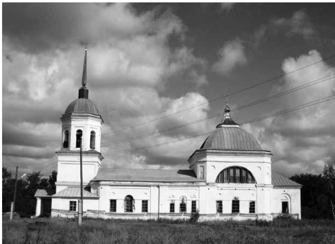
Рис. 10. Церковь Николая Чудотворца. Данилово. Удмуртия

Такие же вятские формы, слегка «разбавленные» классическими элементами, можно увидеть в Троицкой церкви с. Елово (Ярский район, Республика Удмуртия) (рис. 9). Едва уловимая вятская ярусность заметна также в конструкции Вознесенской церкви с. Чутырь (Игринский район, Республика Удмуртия), которая принадлежит уже к позднему классицизму.