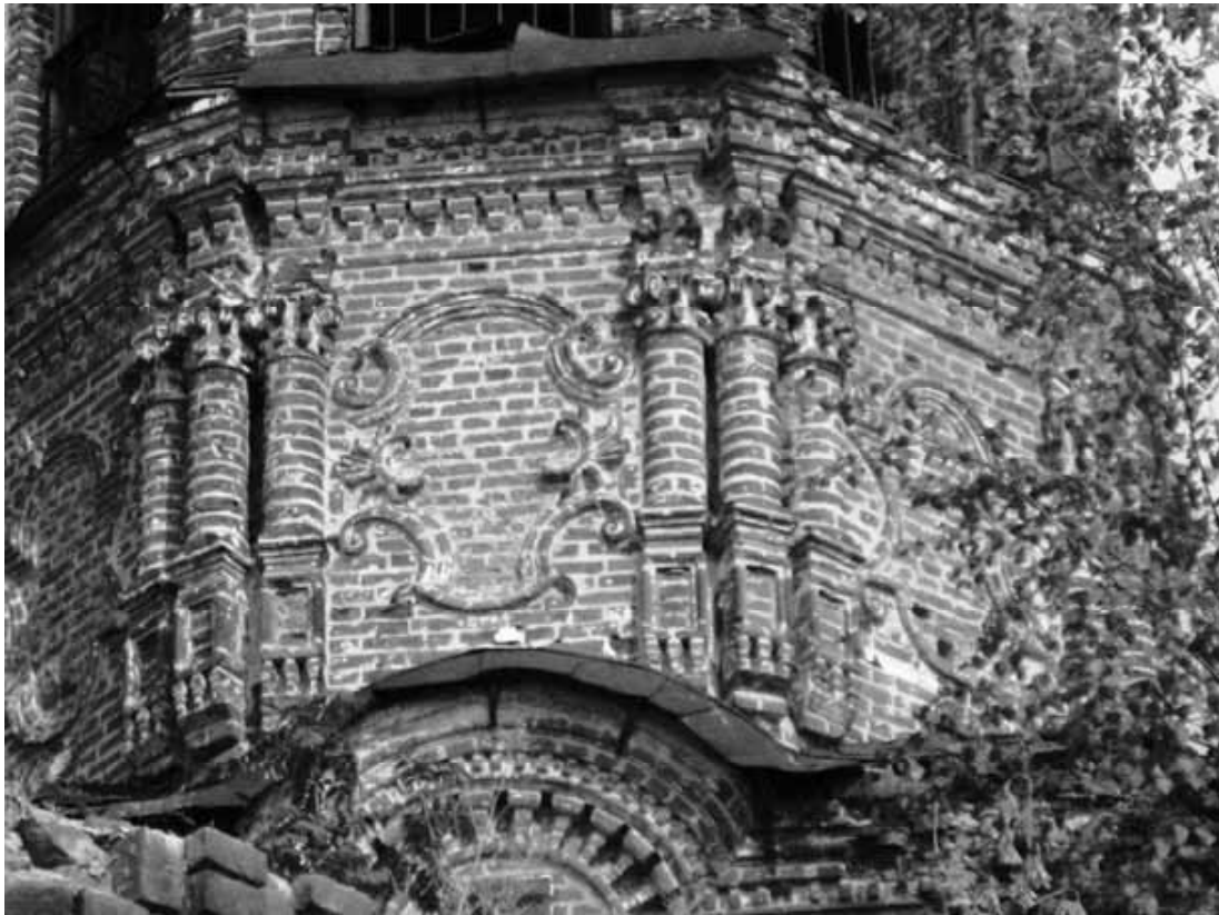
Рис. 3. Вятское узорочье. Никольская церковь. Истобенское Кировской области