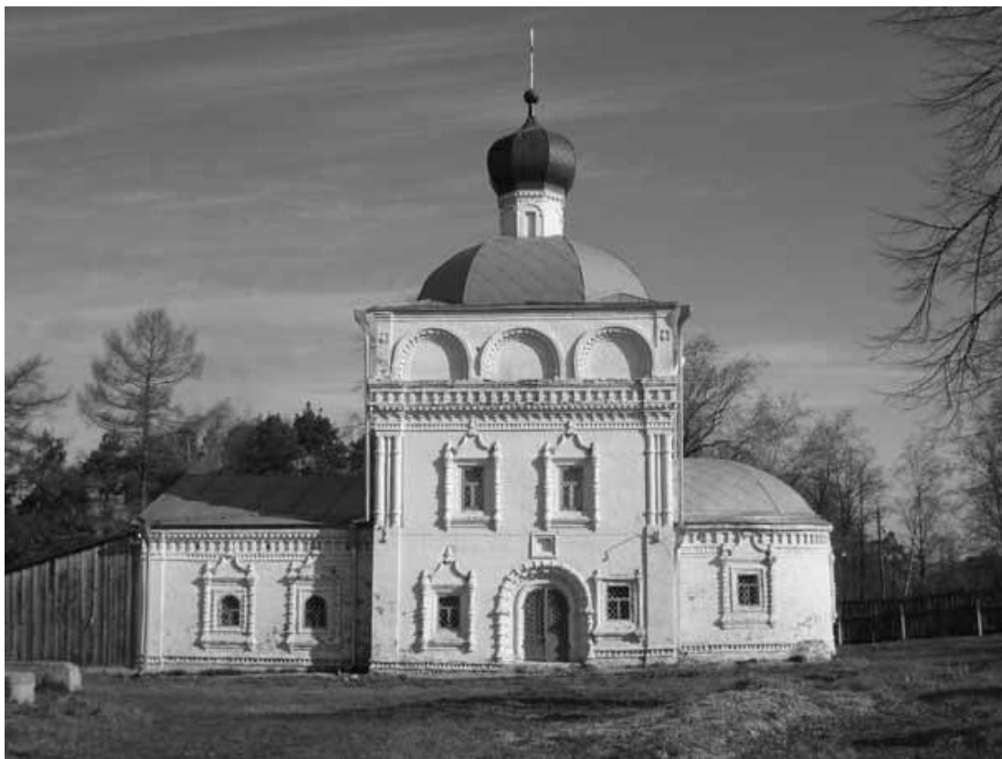
Рис. 5. Благовещенская церковь. Яранск Кировской области

В происхождении «вятского варианта русского храмового барокко» отмечают три источника: московская «нарышкинская» архитектура, переосмысленная в Великом Устюге, храмы Пермского края и южный «свяжский тип церкви, формировавшийся на землях бывшего Казанского ханства. Следует также заметить, что все эти направления культурного влияния сложились при деятельном персональном участии Трифона Вятского. Он, уроженец Мезенского Севера, неоднократно бывал в Сольвычегодске, подвизался в монастырях Пермской земли. Он же был в значительной степени инициатором прокладывания в вятские земли «южного пути» через Казань, Козьмодемьянск, Царевококшайск (совр. Йошкар-ола), Яранск, Санчурск и Уржум. Думается также, что немалый вклад в финансирование строительства «барочных» храмов на Вятке и за ее пределами внесло семейство купцов Строгановых. В связи с этим «русское барокко» получило также название «строгановского». Источники сообщают, что, даже несмотря на запрет на каменное строительство, изданный правительством в 1714 г. в связи с постройкой Петербурга, каменные церкви на вятской земле продолжали возводиться. Наряду с уже описанным нами «вятским барокко» в середине XVIII в. на Вятке появились и церкви иного ти-