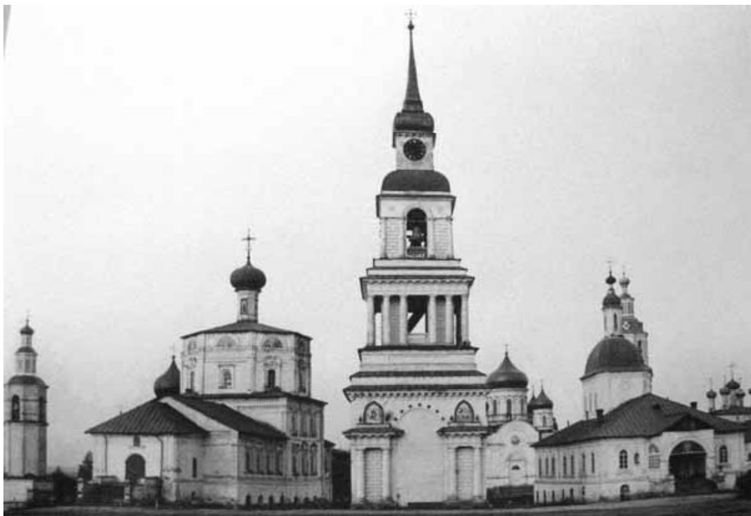
Рис. 7. Слободской центральный ансамбль. Вятская губерния. Фото начала XX в.