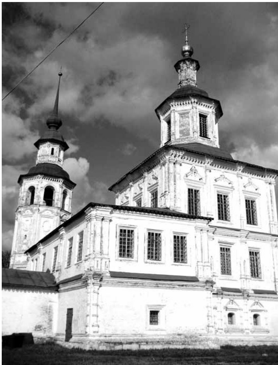
Рис. 1. Храм Николы Гостунского. Великий Устюг. Конец XVII в.

Говоря о «московском» происхождении такого типа храмов, следует, на наш взгляд, иметь в виду и возможности иных, более традиционных для Севера влияний. Так, архаичные четвериковые храмы с миниатюрным восьмериком-колокольней до настоящего времени сохранились в Северном Прикамье, в Чердыни и Чердынском районе (рис. 4). От вятских сооружений они отличаются значительной миниатюрностью форм. В то же время своеобразный «свияжский» вариант храма «восьмерик на четверике» шел на вятские земли с юго-запада, из Казани. Образцом такой архитектуры является Благовещенская церковь в г. Яранске, построенная в кон-