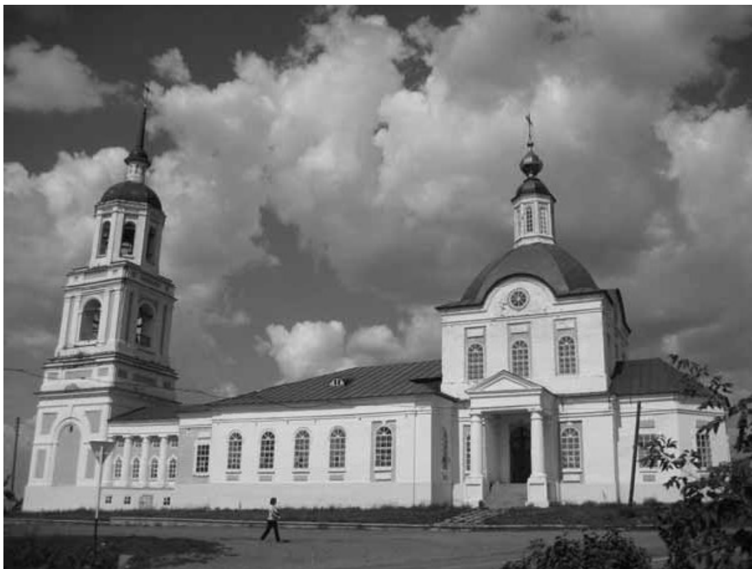
Рис. 11. Церковь Троицы Живоначальной. Мостовое. Удмуртия