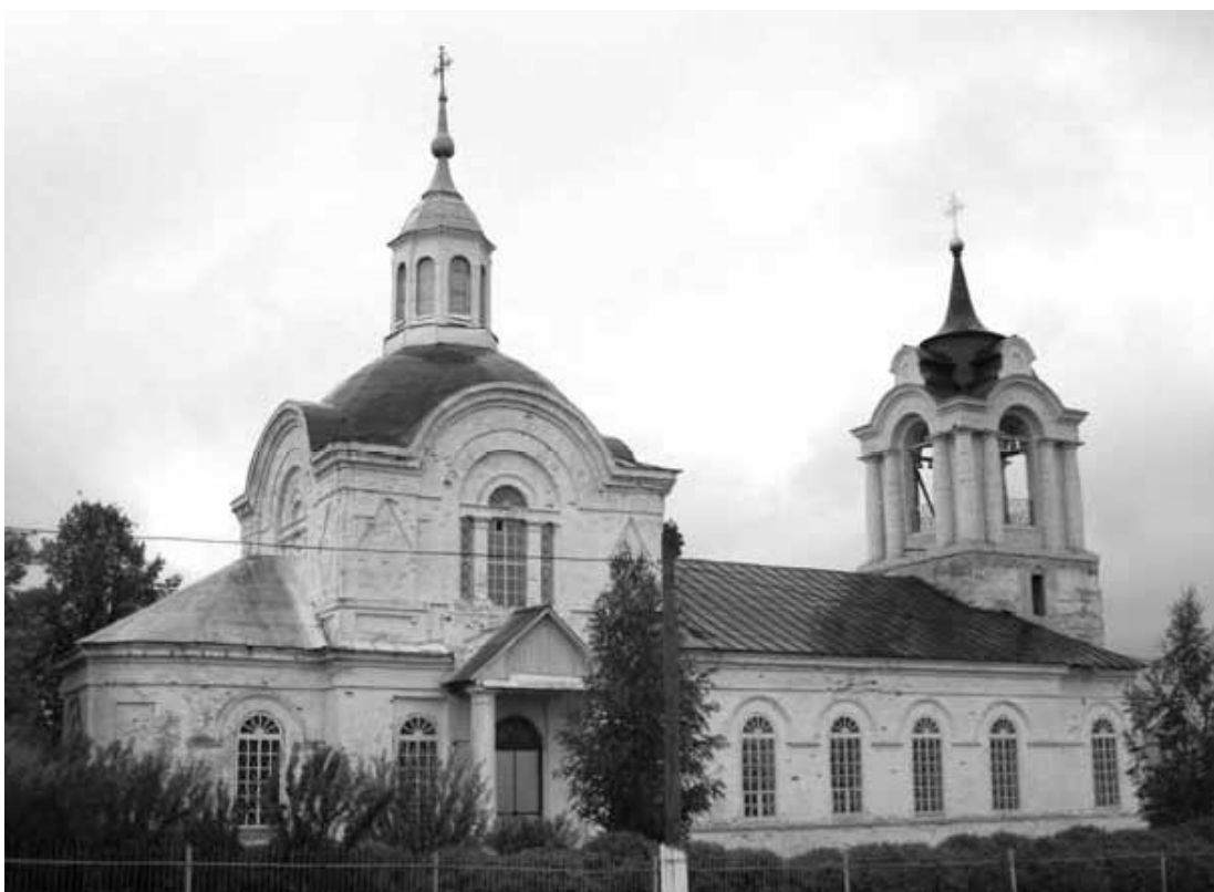
Рис. 12. Ранний вятский классицизм. Церковь Илии Пророка. Ильинское Малопургинского района. Удмуртия