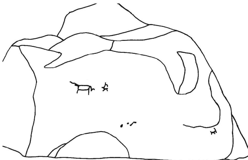
Рис. 2. Панно с коровой (Айрыдаш-I)