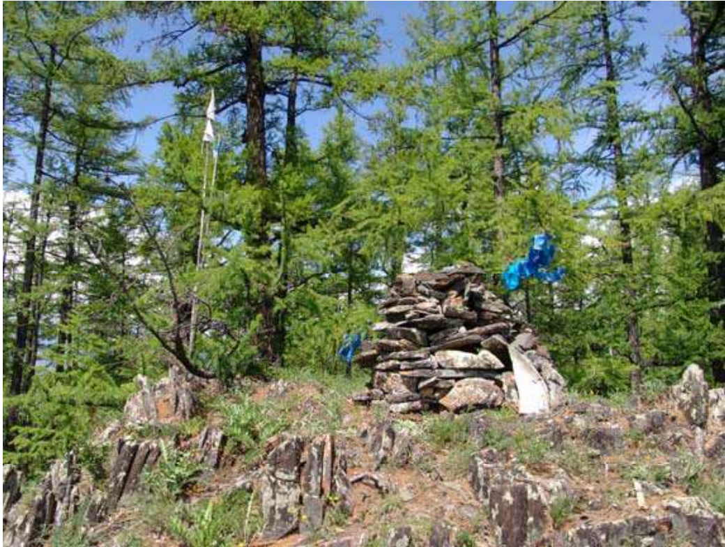
Рис.8. Столб с жертвенником на вершине. Вид с востока. Гребень горы Цыгыр;