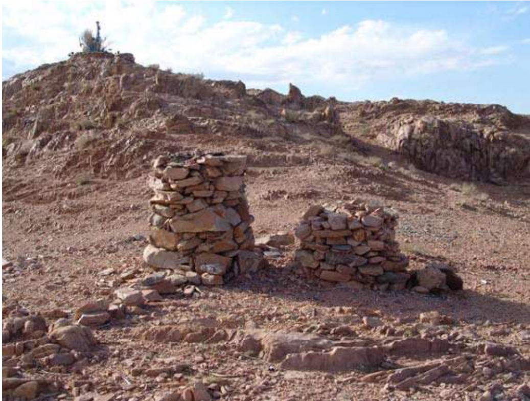
Рис.4. Индэры на террасе у южного окончания горы Хойт-Улан и Галданбошигт обо на вершине;