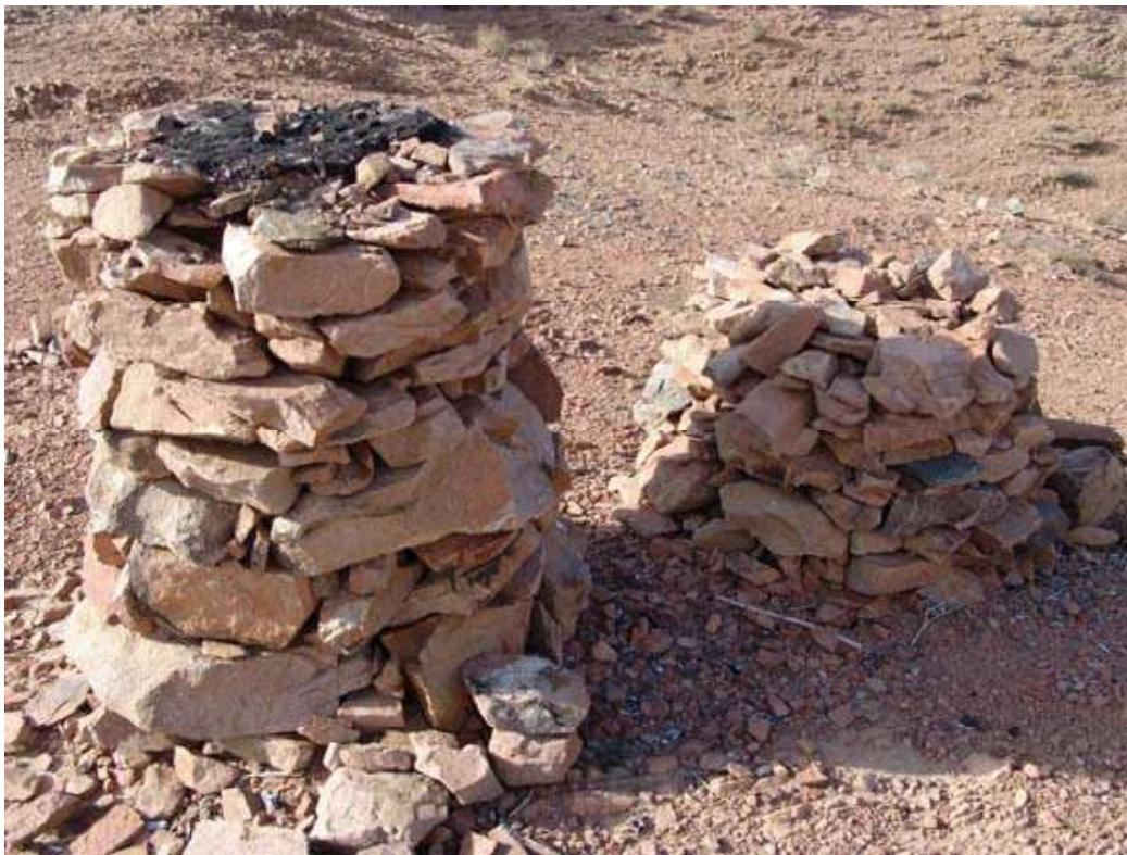
Рис.5. Индэры с 2-мя лучами у южного окнчания горы Хойт-Улан;