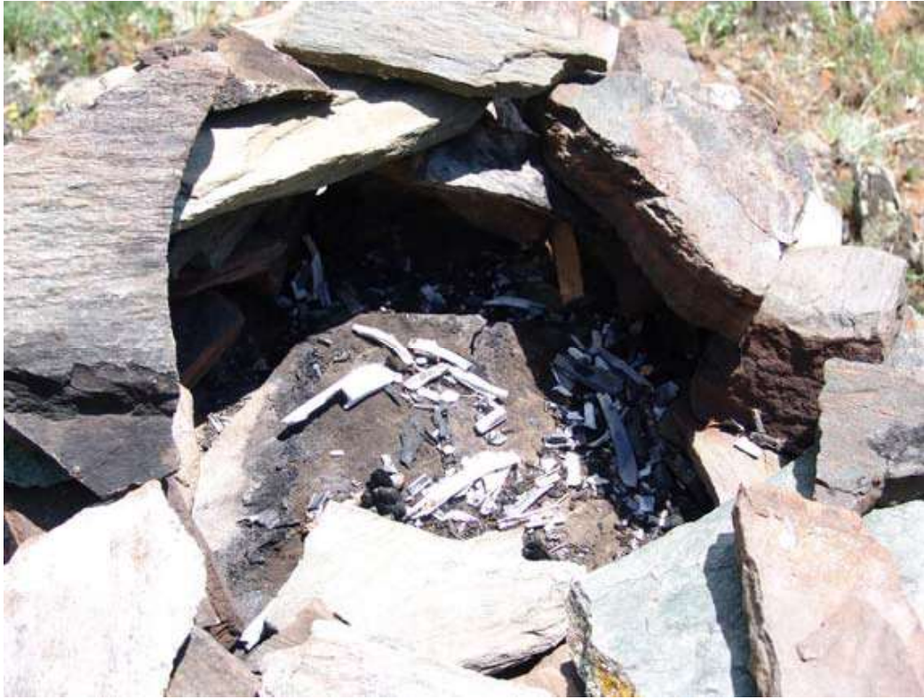
Рис.10. Жертвенник на столбе. Гребень горы Цыгыр;