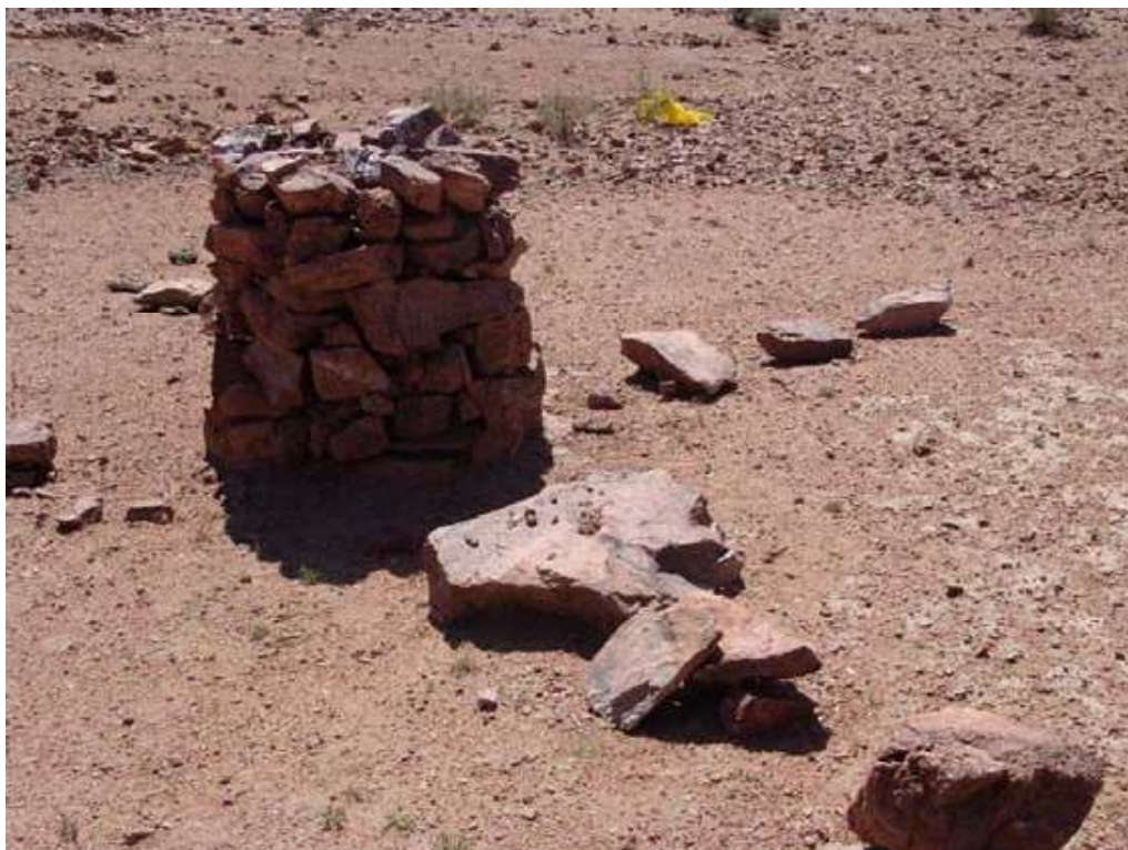
Рис.2. Индэр с 4-мя лучами на северном выступе горы Хойт-Улан;