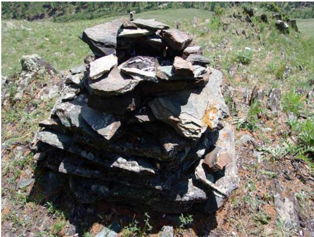
Рис.9. Столб с жертвенником на вершине. Гребень горы Цыгыр;