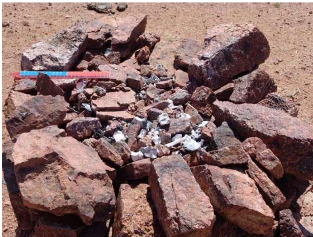
Рис.3. Жертвенник со следами сожжения на северном выступе горы Хойт-Улан;