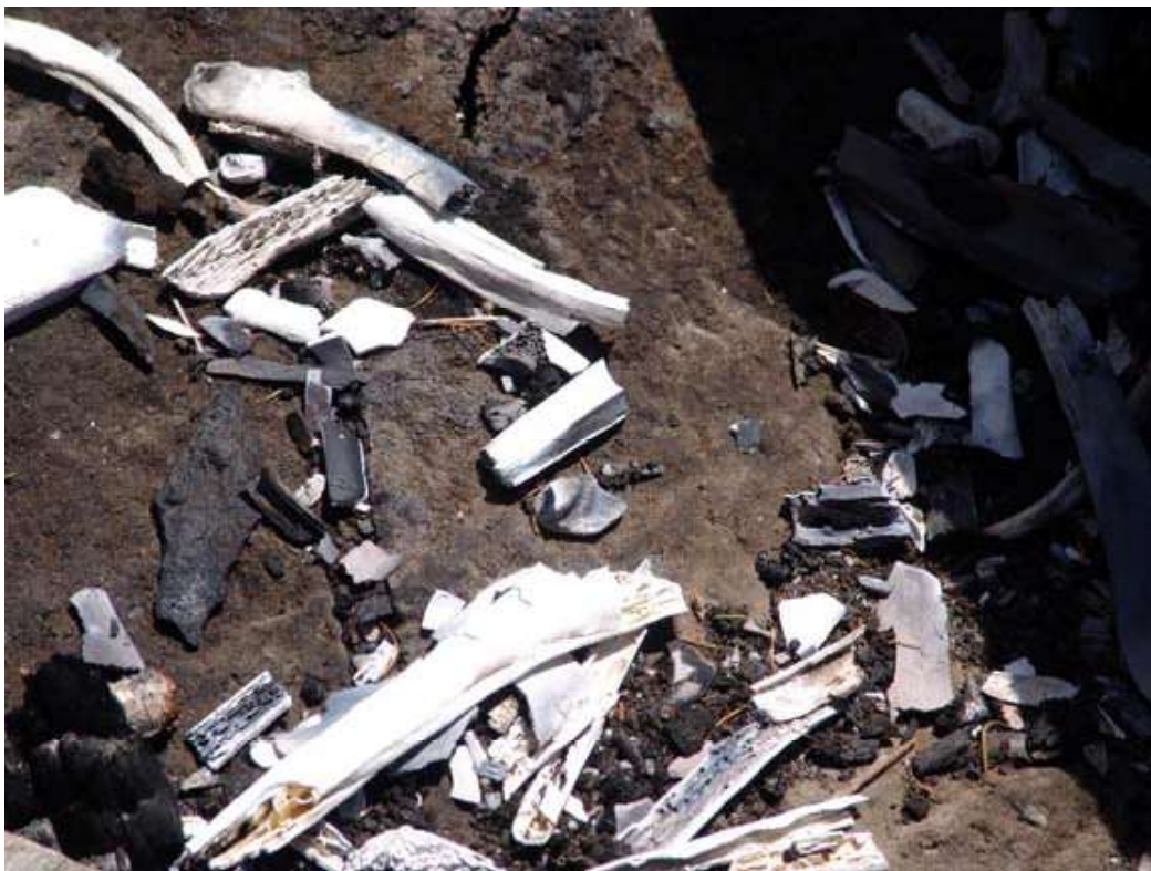
Рис.11. Остатки сгоревших жертвоприношений и дерева. Гребень горы Цыгыр;