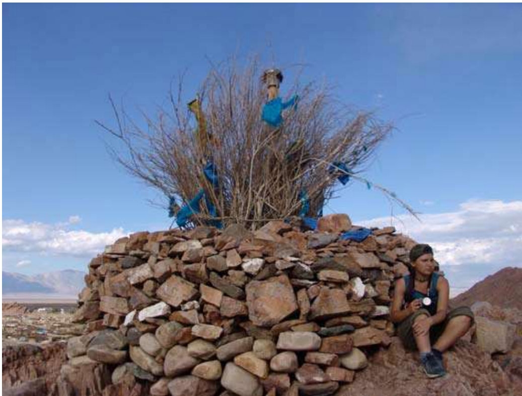
Рис.7. Галданбошигт обо. Вид с севера.