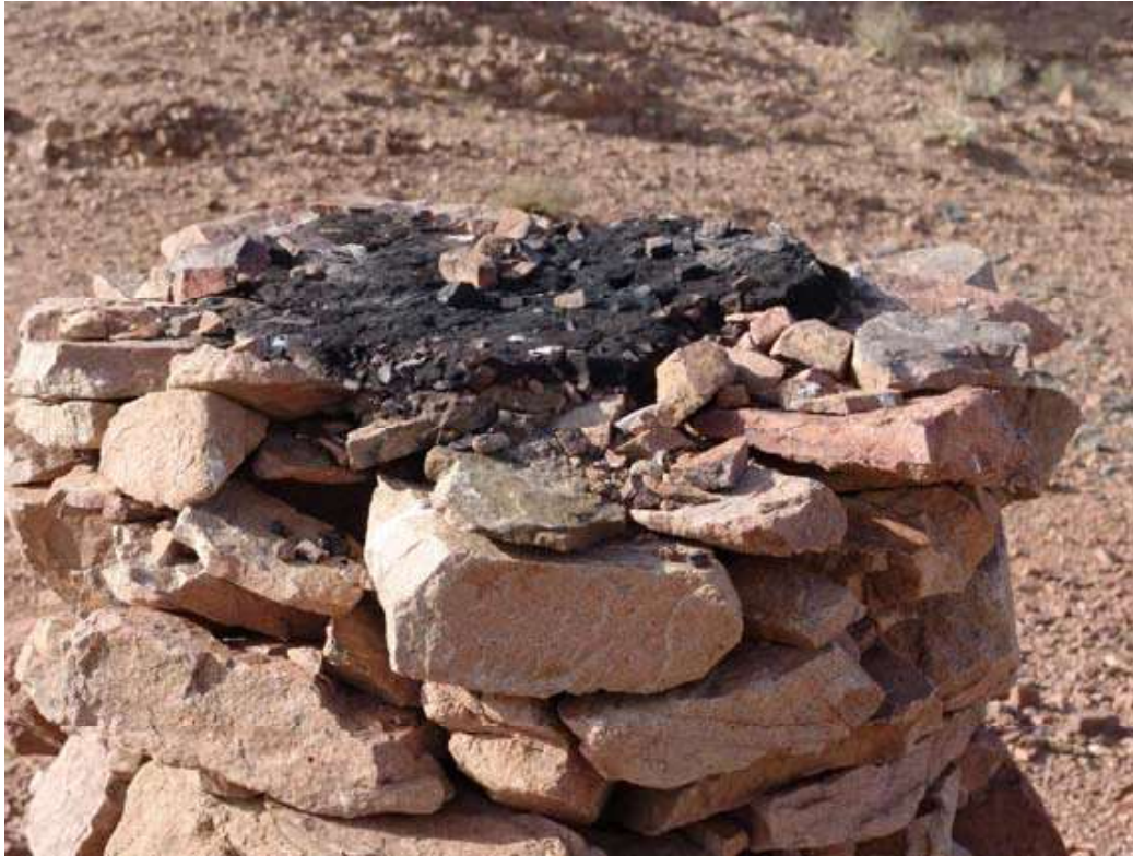
Рис.6. Жертвенник на большом индэре у южного окнчания горы Хойт-Улан;