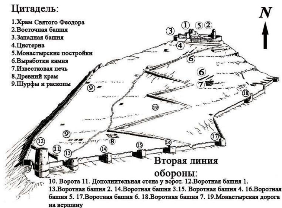
Рис. 2. Анакопия (укрепленная часть городища). По материалам раскопок 1957–1958 гг. Абхазского Института языка, литературы и истории

Руины церкви привлекали внимание многих исследователей. Одним из первых произвел осмотр памятника академик В. В. Латышев [Латышев, 1911: 169–198]. На основе эпиграфического анализа надписей, сохранившихся на плитах, Латышев смог установить время перестройки и реставрации храма. Так, надписи свидетельствуют об освящении храма Святого Феодора после реконструкции в XI в.