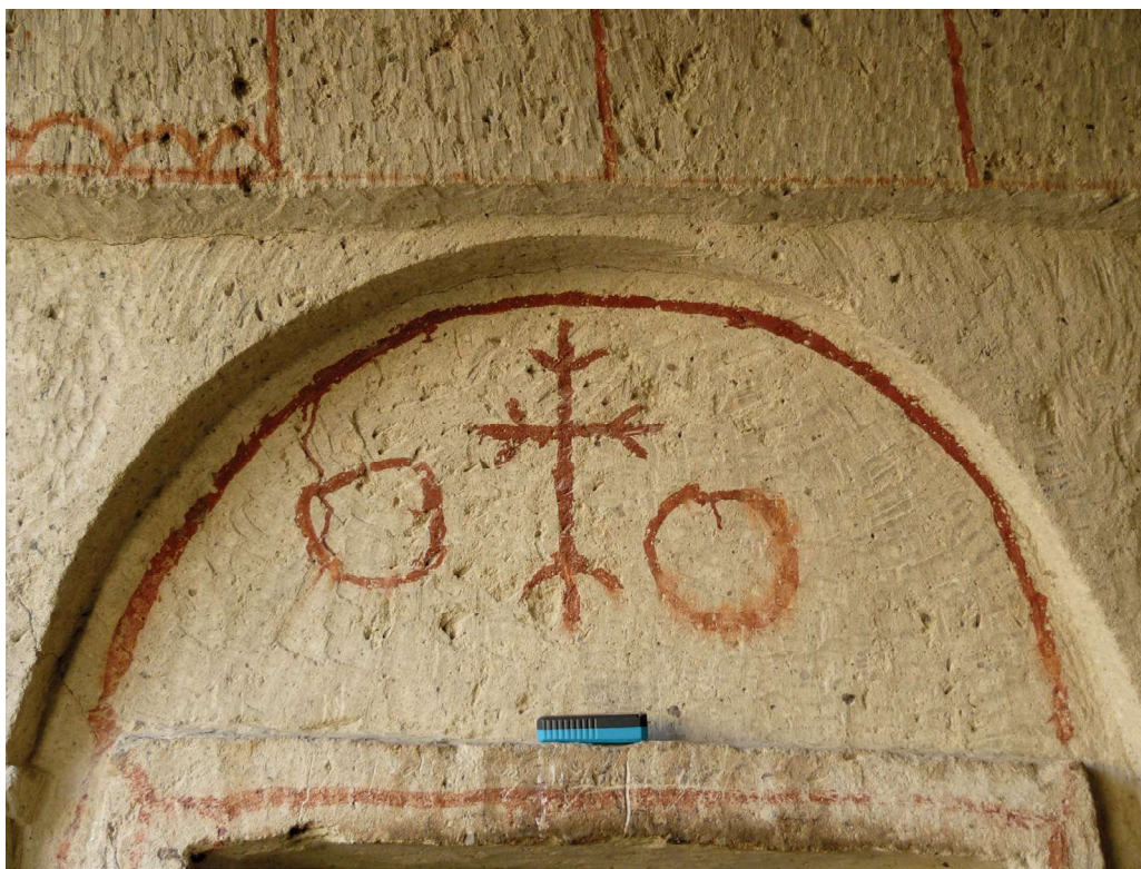
Рис. 5. «Крест-дерево» и солярные символы. Роспись на неоштукатуренной стене. Церковь Вседержителя. 11 в. Göreme Open Air Museum. Турция. Каппадокия

На наш взгляд, иконографическая традиция использования двойных солярных символов является закономерной и иллюстрирует очень древние, дохристианские представления о цикличности бытия. Можно допустить, что парные солярные символы, а также солярные символы, отличающиеся по размеру или находящиеся на разном уровне относительно друг друга, отображают дни солнцестояний и равноденствий, и выражают онтологическую идею борьбы света и тьмы и перехода из одного состояния в другое.