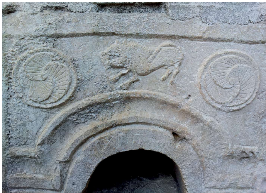
Рис. 4. Рельеф. Зооморфный образ и солярные знаки. Церковь Святого Феодора