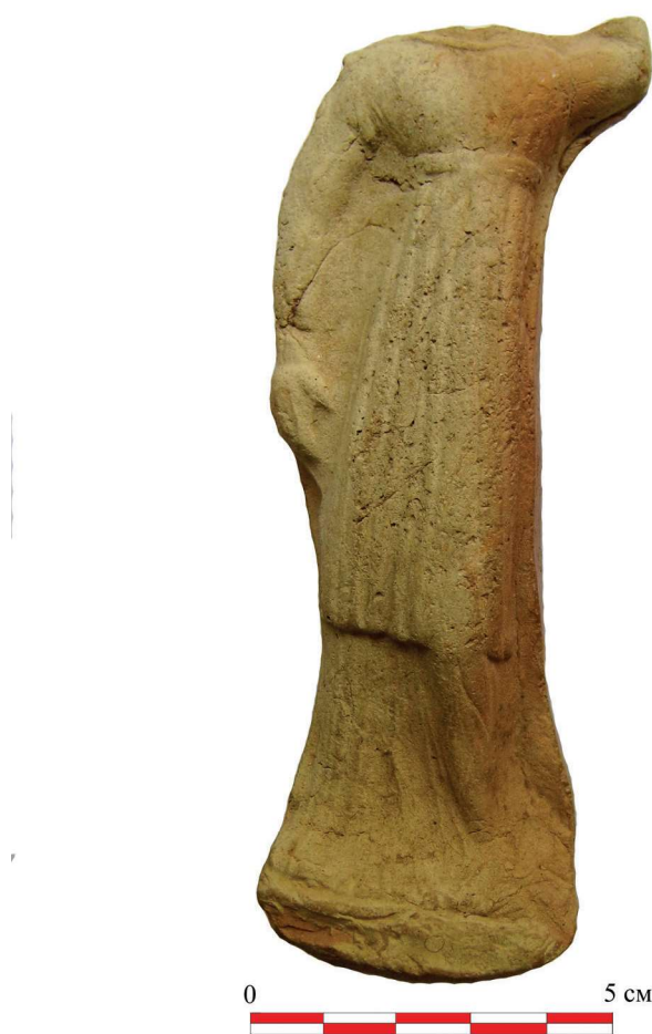
Рис. 3. Терракота из памятника Хантепа

Среди находок из помещения 11 наиболее интересной является терракотовая плакетка в образе молодой девушки (рис. 3). Терракота изготовлена из тонкоотмученной глины и не ангобирована. Сохранившиеся размеры терракоты: высота — 12,5 см, толщина — 2,5 см. Плохо сохранившаяся левая рука терракоты поднята вверх, а правая — свободно открыта и спущена вниз. На обратной стороне терракоты имеются следы неравномерного обжига, а также использования острого инструмента, с помощью которого выравнивалась поверхность.