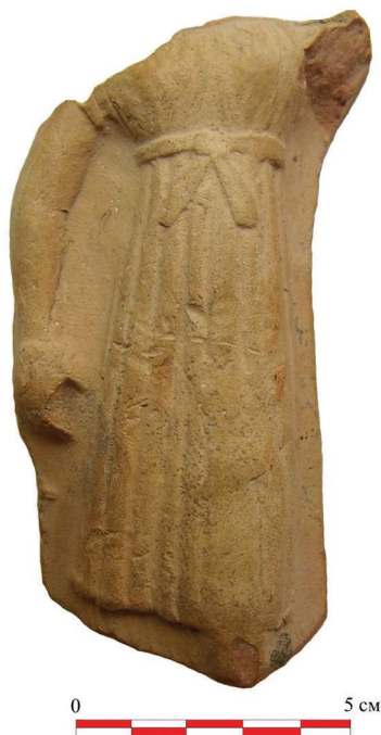
Рис. 4. Терракота из памятника Еркурган

дийцы играли немаловажную роль в развитии международных культурных отношений, так как в Согде иногда встречаются образцы разнообразных древних цивилизаций. Наша терракота может служить примером такой трактовки.