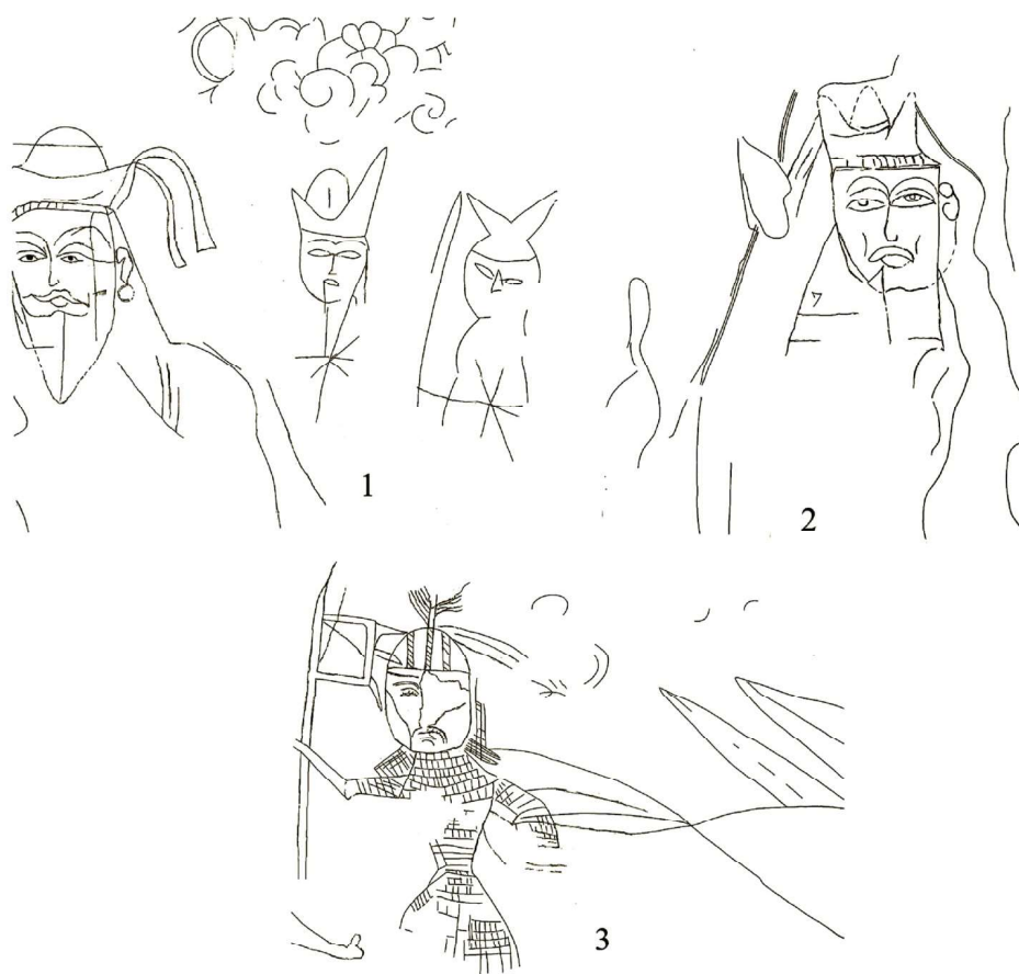
Рис. 5. Граффити с изображением правителей и воина с юго-западной стены помещения 2 [Акылбек, Смагулов, Яценко, 2016]

Спустя некоторое время после росписей на стены были нанесены граффити в разной авторской манере, которые иногда объединяются в смысловые композиции. По небольшому остатку краски на юго-западной стене предполагаются портретные изображения супружеской четы правителей, которые первоначально были выполнены краской внутри намеченного контура, а затем немного подновлены (рис. 5). Манера их изображения отличается большей реалистичностью и профессионализмом по сравнению с прочими граффити. Остальные гравировки на этой и других стенах выполнены в стилистике, близкой или идентичной раннетюркским наскальным рисункам. Специфические детали костюма, по мнению С. А. Яценко, подтверждают датировку дворца цитадели Кулана VIII в. При этом все они известны в соседнем Синьцзяне: один — в оазисах Куча (и более ранние — в оазисе Ния) и у поселившихся там в IX в. уйгуров (убор правителя на юго-западной стене) [Акылбек, Смагулов, Яценко, 2016: 53–63; Яценко, 2013: 593–594].