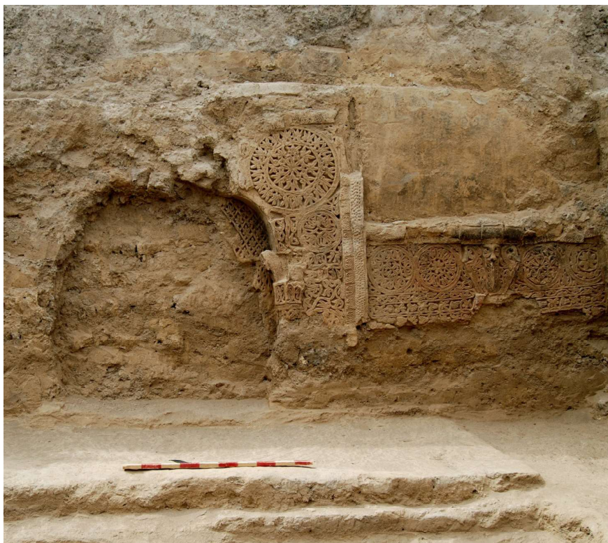
Рис. 3. Декор юго-западной стены помещения 1

К листьям снизу прикреплены по две расходящиеся в стороны ножки. На уровне верха колонки узор из ромбов ограничивается горизонтальной полосой. Ниже расположен небольшой кусок резьбы с изображением узких вытянутых ромбов с теми же листьями, но в отличие от описанных выше, они изображены опущенными вниз с парными ножками вверх и в стороны.