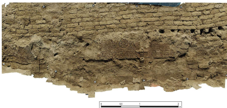
Рис. 4. Декор северо-западной стены помещения 1