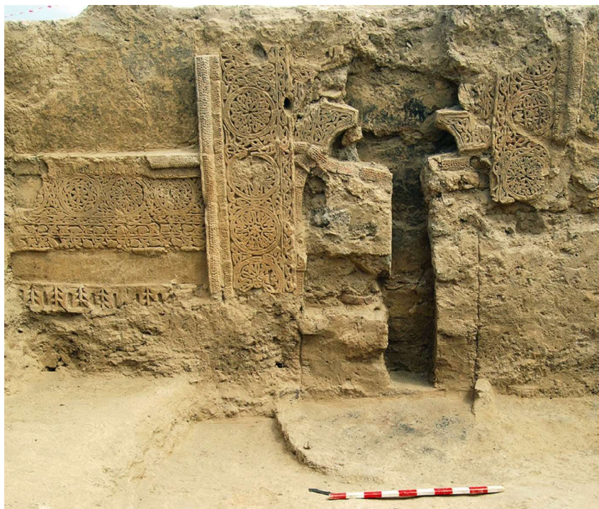
Рис. 2. Декор северо-восточной стены помещения 1

ми». Внутри основной рамы находится прямоугольная рамка, на нее с двух сторон опираются изогнутые дугой фрагменты арки. По краям они украшены полосой с кружками-перлами. Основная плоскость заполнена растительным узором «ислими».