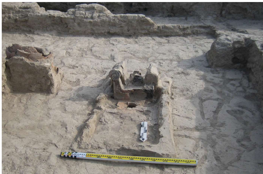
Рис. 1. Городище Жанкент. Помещение 6

но с небольшим наклоном наружу. С северной стороны вплотную к этой конструкции была приставлена керамическая очажная подставка в виде протом баранов (қошқар), развернутых в противоположные стороны на плоской, прямоугольной в сечении основе. Одна голова барана была отбита и лежала рядом (рис. 1).