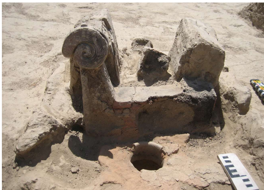
Рис. 2. Городище Жанкент. Помещение 6. Очажная подставка