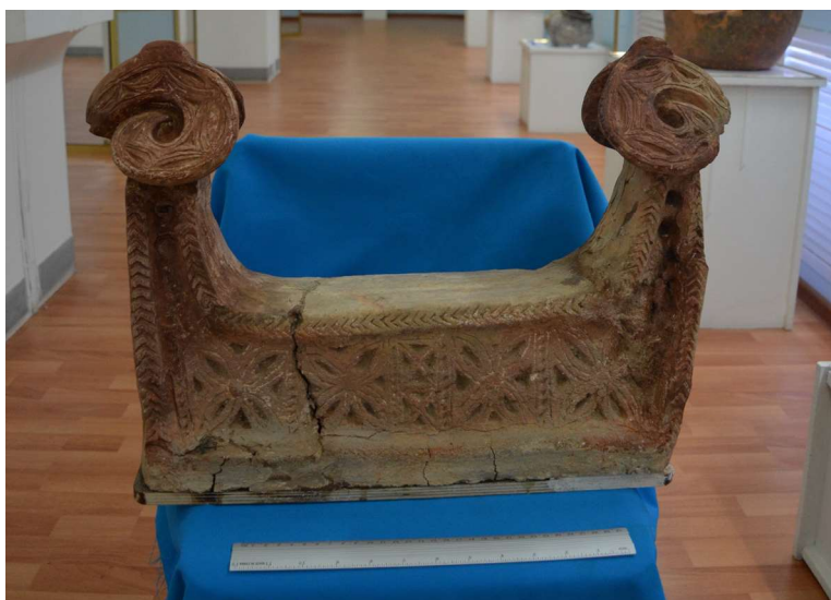
Рис. 7. Городище Сортобе. Реставрация очажной подставки (реставратор А. Ж. Назаров)

Другим помещением, открытым до уровня третьего строительного горизонта, является помещение 4. Комната квадратной формы размером 4,5 x 4,2 м. Внутренний интерьер помещения состоит из суфы, которая идет вдоль северной стены. Возможно, была еще западная часть, которая попала за бровку. Ширина суфы — 1,5 м. К северо-восточному углу суфы примыкала стена, защищающая комнату от сквозняков, создавая небольшой коридорчик длиной 2 м. Причем вход коридорчика был обрамлен дверным проемом (выявлены остатки столбовых ям). В центре комнаты был поставлен ритуальный очаг-подставка. Подставка, так же, как и в помещении 3, имеет X-образную форму, размеры 1 x 0,8 м. X-образная платформа имеет радиальную направленность с запада к ней приставлена ритуальная очажная подставка в виде стилизованного барана с двумя головами. Подставка также оформлена геометрическим декором с двумя головами баранов, смотрящих в разные стороны. Сохранилась нижняя часть размером