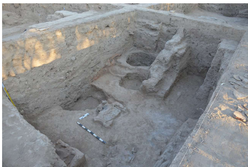
Рис. 9. Городище Сортобе. Помещение 4 (третий строительный горизонт)

Как видно, сортобинские очаги имеют другую форму, Х-образную. Сложены они также из сырцового кирпича, а сверху оштукатурены глиной. Очажная подставка ставилась всегда параллельно очагу на уровень пола. Расчистка показала, что очаг не имеет следов воздействия огня, скопление угольков и золы располагается на уровне пола