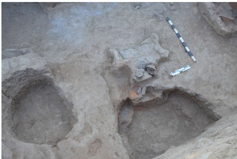
Рис. 10. Городище Сортобе. Помещение 4. Вид очажной подставки

за очажной подставкой в виде стилизованного барана. Выкапывалась неглубокая ямка (20–40 см глубины и диаметром до 50 см), куда ставился горшок или сосуд конической формы, слегка раздутый, в нижней части которого имелся поддон. По мнению С. Билалова, одного из участников раскопок, форма очага с городища Сортобе схожа с развернутой шкурой барана ( тулак ). У казахов такие шкуры могут стелить у порога. Сакрализация этого действия связана с тем, что входящий очищается от дурных мыслей и побуждений.