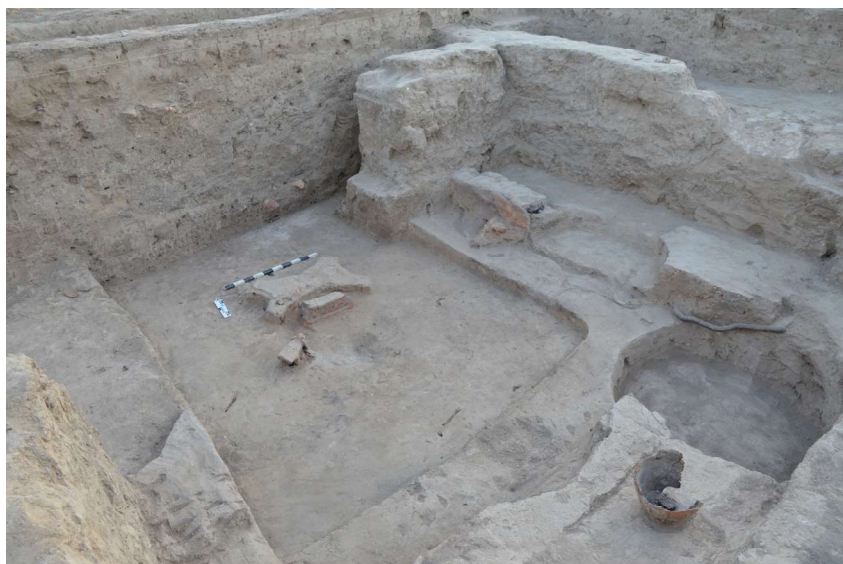
Рис. 5. Городище Сортобе. Помещение 3 (третий строительный горизонт)

Пол в помещении 3 был залит плотной, хорошо промешанной глиной. В центре комнаты находился очаг Х-образной формы, напоминающий растянутую шкуру барана. Очаг, вытянутый в широтном направлении, имел размеры 80 x 60 см, был сложен из крупного блока. По всей видимости, ему придавали Х-образную форму. С южной стороны платформы Х-образного очага находилась площадка из прокаленной докрасна глины размером 100 x 900 см. На ней была расположена ритуальная очажная подставка в виде стилизованного изображения барана с двумя головами. Подставка выполнена в классическом виде — декоративное тулово с отогнутыми двумя головами по сторонам. Размер подставки — 45 x 15 см. Зачистка прокаленной площадки показала, что там располагалась ямка для горшка размером 20 x 20 см (рис. 5–8).