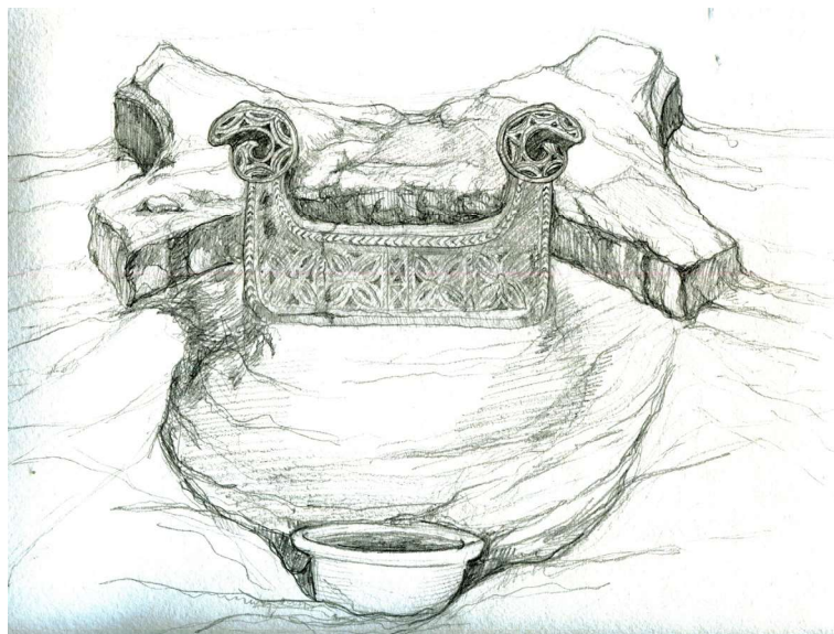
Рис. 8. Городище Сортобе. Графическая реконструкция очажной подставки (реставратор А. Ж. Назаров)

40 см. Головы баранов расположены к югу от подставок. Перед ритуальной подставкой стоит углубленный в пол сильно прокаленный горшок (рис. 9, 10).