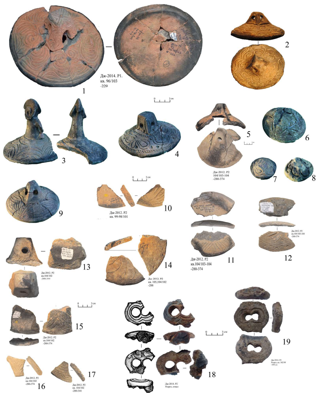
Рис. 11. Городище Жанкент. Керамические изделия

в себе некий скрытый смысл. Очень хорошо представлен на гончарных изделиях огузской керамики образ барана. Голову барана изображали не только на очажных подставках, но и на ручках керамических крышек. Причем в том же рельефно-реалистическом стиле.