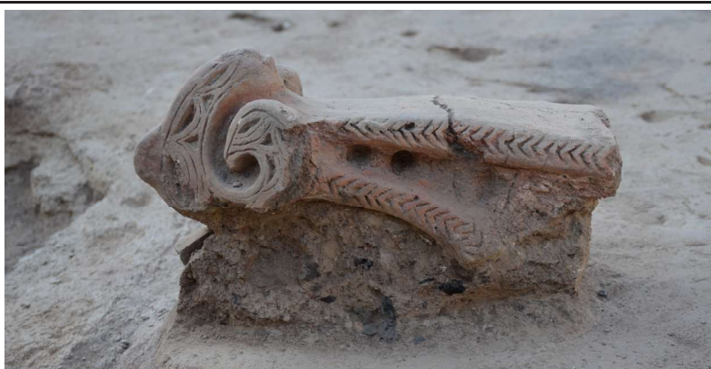
Рис. 6. Городище Сортобе. Помещение 3. Фрагмент очажной подставки