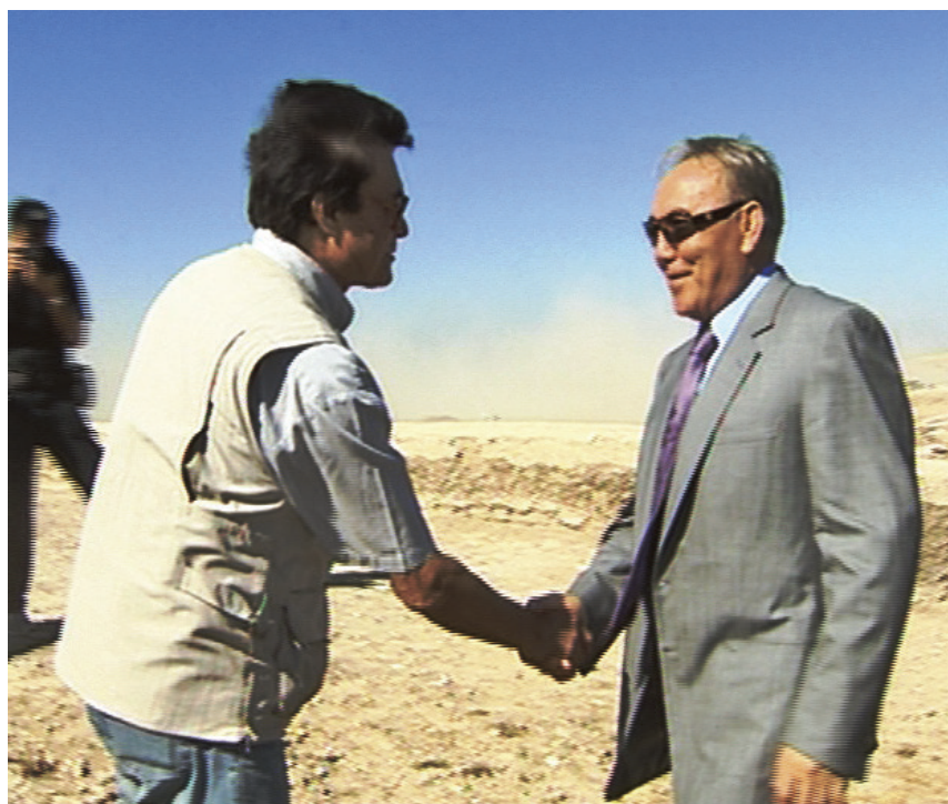
Рис. 13. К. М. Байпаков (слева) и Президент Республики Казахстан Нурсултан Назарбаев

В связи со скоропостижной кончиной академика НАН РК Карла Молдахметовича Байпакова соболезнования выразили Президент Республики Казахстан Н. А. Назарбаев, Госсекретарь Г. Абдыхаликова, Аппарат Президента, руководители Мажилиса и Сената Парламента, министры, послы РК в разных странах, руководители областей, где работал и проводил исследования ученый, Штаб-квартира ЮНЕСКО в Париже, Кластерное бюро ЮНЕСКО в Алматы, Институт археологии РАН, Институт истории материальной культуры в Санкт-Петербурге, Государственный Эрмитаж, вузы республик СНГ и Казахстана, многочисленные коллеги из Казахстана и других стран.