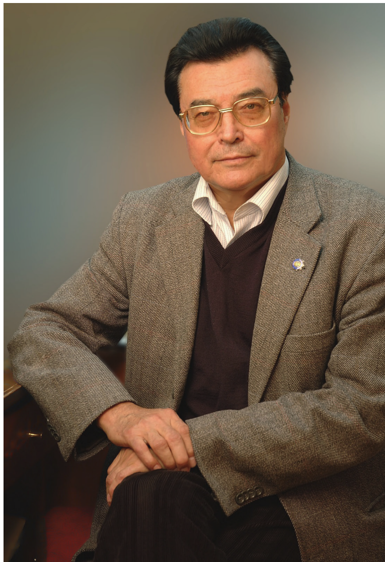
Рис. 1. Карл Молдахметович Байпаков. 2002 г.

Фараби, Межгосударственной премии Стран Экономического Содружества за вклад в изучение духовного развития мусульманских стран, медали ЮНЕСКО за вклад в мировую науку, заслуженный деятель науки и техники Республики Казахстан, кавалер орденов «Парасат» и «Барыс» третьей степени.