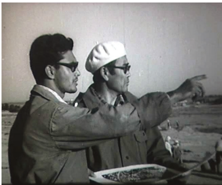
Рис. 7. К. М. Байпаков (слева) и К. А. Акишев. Кадр кинохроники

В 1994 г. Карл Молдахметович Байпаков был избран по конкурсу членом-корреспондентом Национальной Академии наук Республики Казахстан, а в 1995 г. ему присвоено звание профессора археологии. В 2003 г. Карл Молдахметович был избран академиком (действительным членом) Национальной Академии наук Республики Казахстан.