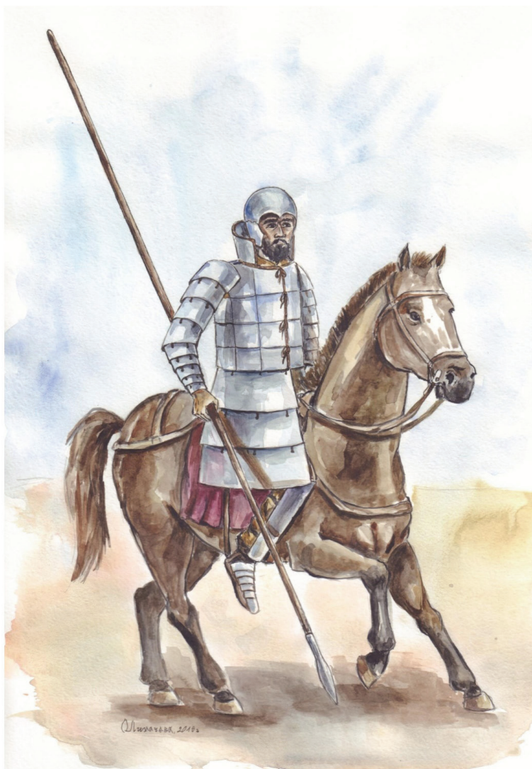
Рис. 3. Реконструкция средневооруженного воина каменной культуры IV–III вв. до н. э.

Высокий стоячий воротник, скорее всего, состоял из цельной пластины [Толстов, 1962: рис. 826]. Подол панциря показан тремя крупными полосами, демонстрирующими ламинарную структуру бронирования [Горелик, 1982: 89]. Защита рук представлена «браслетным» набором из семи сомкнутых пластин. Защита ноги составная: от колена до стопы она закрыта сплошной пластиной трапециевидной формы, закрепленной двумя ремешками на голени, внешняя часть стопы защищена неполными «браслетами» из шести сегментов. Шлем аналогичен изделиям, изображенным на описанных выше фигурках из могильника Бугры, но не имеет гребня, а нащечники снабжены фигурными вырезами (рис. 3) [Лихачева, 2016: 274–278].