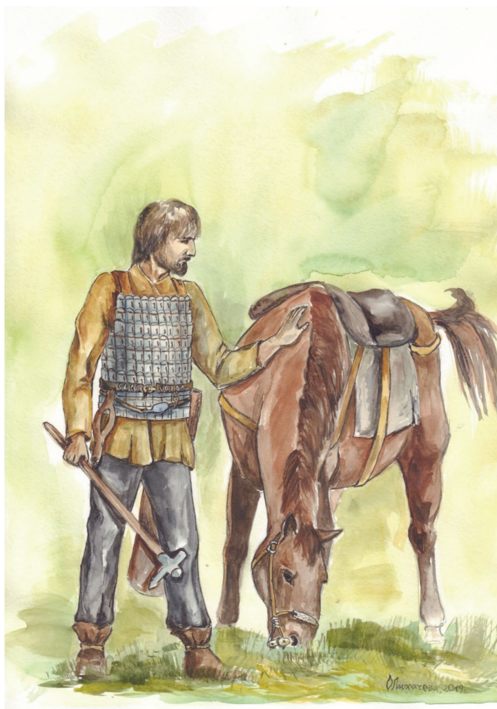
Рис. 4. Реконструкция средневооруженного воина каменной культуры II–I вв. до н.э.

остается дуговидной, а перекрестия становятся брусковидными [Лихачева, 2013с: 52]. О большей популярности мечей на завершающем этапе указывает также сокращение количества чеканов. На настоящий момент известен только один экземпляр, происходящий из могильника Камень-II [Могильников, Куйбышев, 1982: 117–119, рис. 4. — 1, 5. — 11]. По своей морфологии он идентичен образцам IV–III вв. до н.э., отличие заключается в отсутствии художественного оформления обуха. Наконечник копья известен по материалам могильника Масляха-I. Он более массивный, чем экземпляр IV–III вв. до н.э., кроме того, судя по сохранившимся остаткам пера, он имел килевидный абрис [Могильников, Уманский, 1992: рис. 5. — 21]. Подобные характеристики могут свидетельствовать о том, что этот вид оружия начинает использоваться для применения такого тактического приема, как таранный удар.