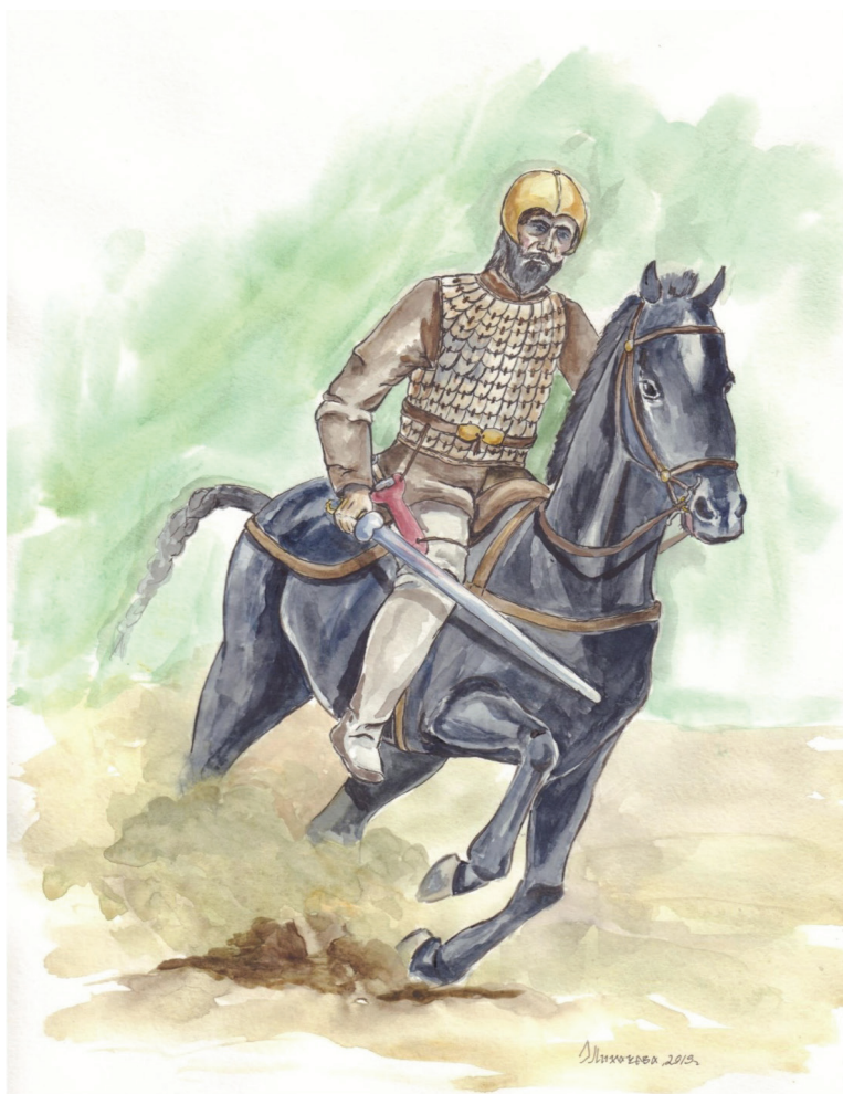
Рис. 2. Реконструкция средневооруженного воина каменной культуры VI–V вв. до н. э.

Первый, наиболее хорошо читающийся, комплект представлен на всаднике, находящемся в центре всей композиции [Лихачева, 2016: рис. 1. — 7]. Его панцирь состоит из нагрудника, наспинника и юбки, доходящей до колен. На изображении, видимо, показан покрое «халат» или «кафтан», при котором панцирь состоит из одной части, но имеет разрез впереди и разрез от крестца до края подола сзади, который призван облегчать посадку на лошадь [Лихачева, 2016: рис. 2. — 4]. Использование такого покроя встречается у синхронных им сакских изделий [Горелик, 1987: рис. 2. — 2]. Бронирование прослеживается плохо, но, видимо, оно аналогично тому, что показано на первом всаднике и включает три вертикальных и три горизонтальных ряда пластин. Исходя из размера пластин и их формы наиболее близкой аналогией среди вещественных находок являются железные пластины чешуйчатого бронирования из комплекса Чирик-Рабат [Толстов, 1962: рис. 82а; Горелик, 2003: табл. LIII-21а].