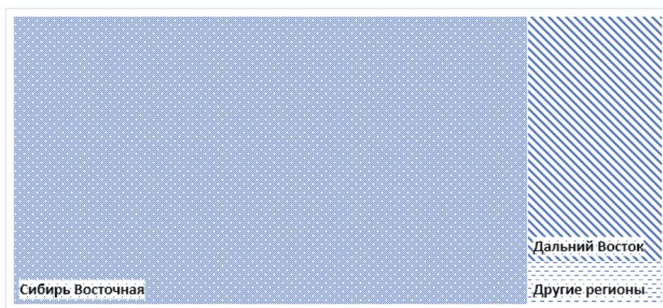
Рис. 2. Географическая структура документального потока БД Научная Сибирика

певтический архив, Суицидология, International Journal of Circumpolar Health, Human Biology, American Journal of Human Biology.