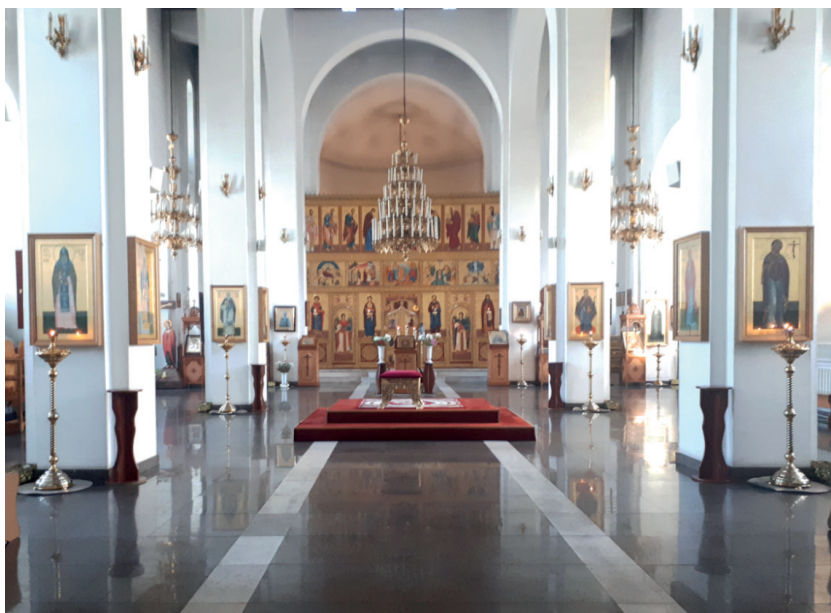
Рис. 2. Интерьер Воскресенского кафедрального собора Кызыла. Фото 2019 г.