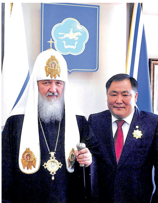
Рис. 3. Патриарх Московский и всея Руси Кирилл и глава Республики Тыва Ш. В. Кара-оол. Кызыл, 2011 г. [ГА РТ. Ф. П-392. Оп. 1. Ед. хр. 31]

Его святейшество провел церемонию освящения Воскресенского собора и одобрил предложение архиепископа Ионафана учредить в республике отдельную епархию [ГА РТ. Ф. П-392. Оп. 1. Ед. хр. 30, 31] (рис. 3). Глава Тувы Ш. В. Кара-оол в честь знаменательного события, по благословению его святейшества, подарил архиепископу Ионафану православный крест [ГА РТ. Ф. П-392. Оп. 1. Ед. хр. 33] (см. рис. 4). Сегодня крест расположен в алтаре главного храма Кызыльской епархии (см. рис. 5–6). На официальной встрече Патриарха Московского и всея Руси Кирилла и V Камбы-ламы РТ Тензина Цультама (Николая Бугажиновича Куулара) была высказана идея создания Буддийско-православного межрелигиозного совета, который незамедлительно был создан с целью обеспечения и поддержания межрелигиозного и межконфессионального согласия в РТ [ГА РТ. Ф. П-392. Оп. 1. Ед. хр. 32] (см. рис. 7).