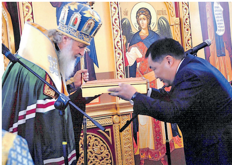
Рис. 4. Глава Республики Тыва Ш. В. Кара-оол преподносит патриарху Московскому и всея Руси Кириллу православный крест. Кызыл, 2011 г. [ГА РТ. Ф. П-392. Оп. 1. Ед. хр. 33]

проводящего патриарха Московского и всея Руси Кирилла. 13 ноября 2011 г. архиепископ Кызыльский и Тывинский Феофан совместно с архиепископом Абаканским и Хакасским Ионафаном совершил первую литургию в Воскресенском кафедральном соборе в Кызыле (см. рис. 8).