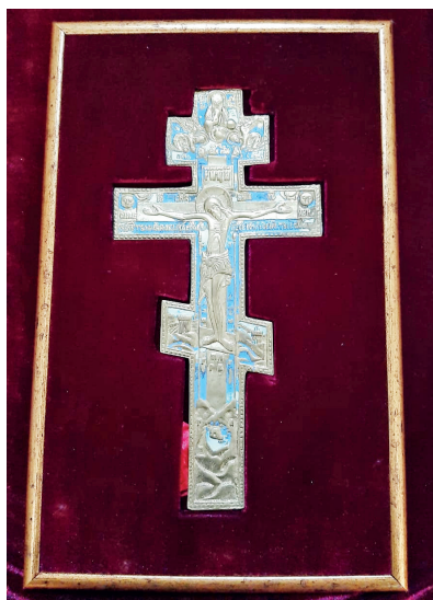
Рис. 5. Лицевая сторона православного креста, преподнесенного патриарху Московскому и всея Руси Кириллу