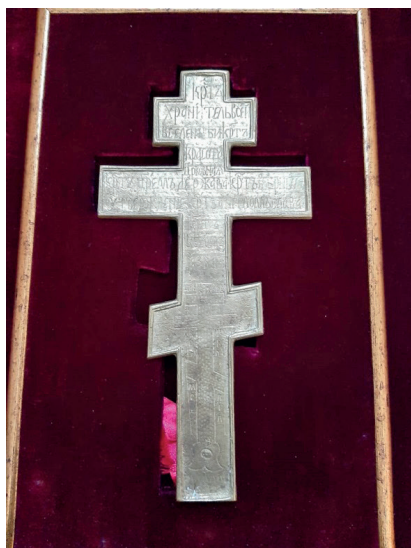
Рис. 6. Обратная сторона православного креста, преподнесенного патриарху Московскому и всея Руси Кириллу