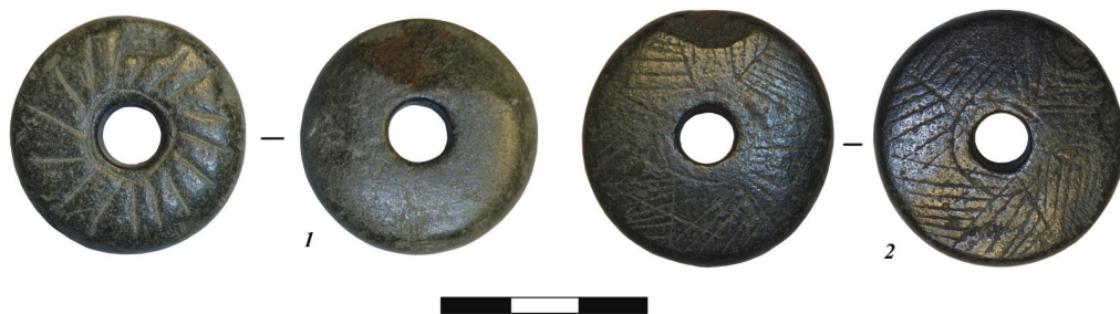
Рис. 1. Каменные пряслица из могильника Чобурак-I. 1 — курган № 32а; 2 — курган № 34.

В кургане № 34 пряслице обнаружено у правого плеча умершей женщины. Изделие представляет собой каменный диск диаметром 3,7 см, толщиной 0,9 см, со сквозным отверстием (размерами 0,7х0,7 см) посередине и поперечным сечением, напоминающим прямоугольник с округлыми углами. Изделие декорировано с двух сторон резными линиями в виде окружности (вокруг отверстия) и множеством линий, которые образуют узор, напоминающий «звезду» с сетчатой штриховкой (рис. 1.–2; 2.–2).