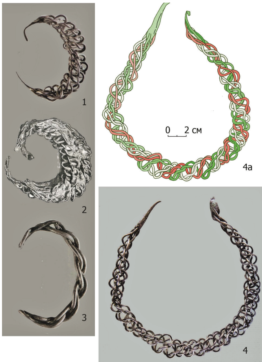
Рис. 8. Спасский клад 1964 г. Серебряные браслеты (1–3) и плетеная гривна (4). 4а – прорисовка К. А. Руденко.