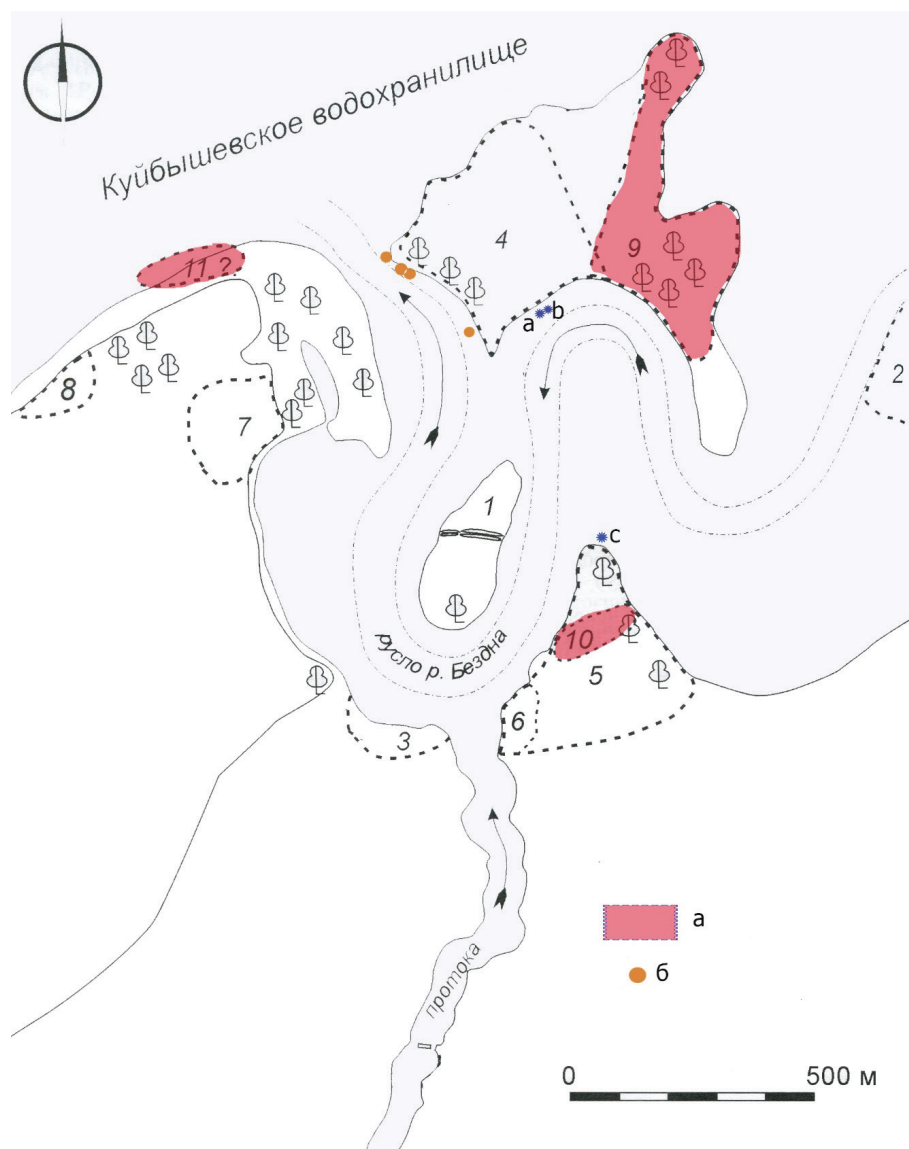
Рис. 2. Схема расположения средневековых археологических памятников Старо-Куйбышевского комплекса (основа: [Валиев, 2017: рис. 1]): 1 – городище; 2 – селище II; 3 – селище III; 4 – селище IV; 5 – селище V; 6 – селище VI; 7 – селище VII; 8 – селище VIII; 9 – могильник I; 10 – могильник II; 11 – могильник III. А – территория могильников; б – медная бытовая посуда. а – клад медной посуды; б – клад серебряных изделий; с – отдельные находки медной посуды (по Е. П. Казакову)