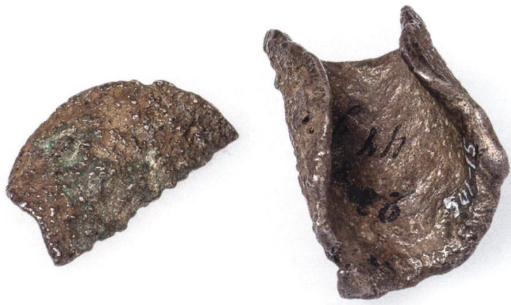
Рис. 7. Спасский клад 1869 г. Слитки серебра [Путешествие, 2016: 401, кат. 318]

№ 2. Клад серебряных украшений 1964 г. 1 (рис. 8). Обнаружен Е. П. Казаковым в юго-западной части IV Старо-Куйбышевского селища 2 [Казаков, 1988: 72–73; 1991: 123–124, рис. 42. — 2, 6, 8, 9; Руденко, 2015: 438, 439, 448, 231, 232, 252].