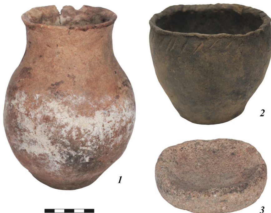
Рис. 4. Керамические сосуды и каменная курильница из Новоалтайского могильника (АГКМ. ОФ 13471/13, ОФ 13471/32, ОФ 13471/17).

В русле обозначенной тематики определенное значение имеют также сборы, проведенные Э. М. Медниковой в окрестностях с. Крестьянка Мамонтовского района Алтайского края. Обнаруженные фрагменты керамики демонстрируют черты, характерные для большереченской культуры, таежного северного населения позднего бронзового века и общностей степного Алтая финальной бронзы. Эти материалы в определенной степени позволяют уточнить границы проникновения в местную среду «таежных» компонентов [Папин, 1996: 98–100].