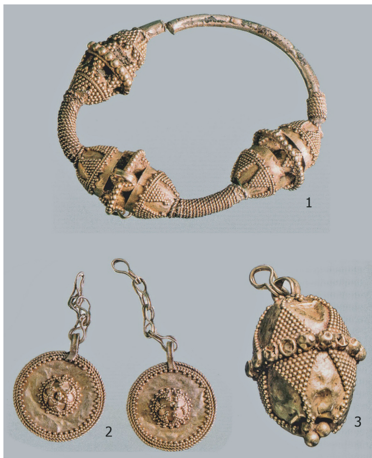
Рис. 9. Спасский клад 1998 г. Золотые височное филигранное кольцо (1), подвески (2,3) [Руденко, 2015: 497, кат. 387–390]

Из клада сохранилось несколько предметов, часть которых в начале 2000-х гг. была приобретена Государственным музеем изобразительных искусств Татарстана 2 [Руденко, 2015: 497, кат. 387–390]. В его составе были: 1) подвеска височная филигранная трехбусинная (4,9x1,8x3,7 см) без фигурки птицы и подвесок на цепочках, хотя на средней бусине имеются три колючка-петельки для них (рис. 9. — 1). Не исключено, что аналогичная подвеска из фондов Болгарского государственного историко-архитектурного музея-заповедника (БГИАМЗ) (инв. № 1114/4, арх.406) происходит из этого же клада [Ру-