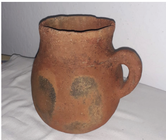
Рис. 2. Керамическая кружка. Казыкурт

Аналогичные погребальные сооружения, исследованные в непосредственной близости к Казыкурту, датируются V–III вв. до н. э. [Байтанаев, 2003: 80–81]. К периоду ранних кочевников следует отнести случайную находку 2020 г. у подножия горы на территории с. Енбекши (рис. 2).