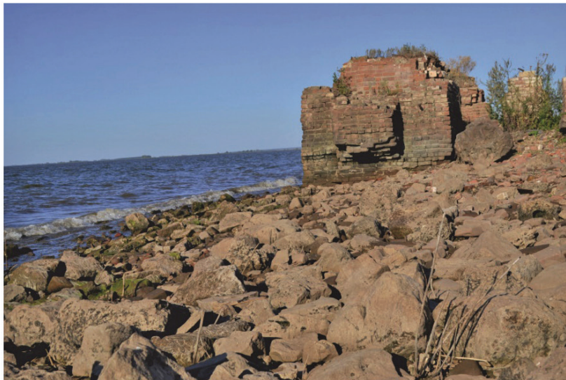
Рис. 3. План Старо-Куйбышевского городища (1) по Н. Ф. Калинину [Калинин, Халиков, 1954: 69, рис. 19–19] и схема расположения городища и селища IV с нанесенными раскопами (2) [Халикова, 1976: 48, рис. 4]; 3 – Спасск. Современный вид (фото 2011 г.)