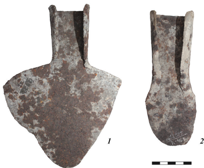
Рис. 6. Орудия труда из пятого культурно-хронологического комплекса городища Елбанка (АГКМ. ОФ 12909/75, ОФ 12985/465).

Эпохой Средневековья датируется пятый культурно-хронологический комплекс городища Елбанка (рис. 6). Первоначально находки различных изделий и фрагментов керамики были отнесены к монгольскому времени [Абдулганеев, 2001: 75–81]. Более детальный анализ этих материалов стал основанием для их датировки в рамках позднего этапа сrostкинской культуры (вторая половина XI–XII вв. н. э.) [Горбунов, Тишкин, Кунгуров, 2016: 221; Горбунов, 2017: 230]. Рассмотренный комплекс данного городища расширяет представления об устройстве укрепленных поселений населением Алтая в конце раннего Средневековья. Кроме того, к IX–XI вв. н. э. отнесены материалы, собранные Э. М. Медниковой у пос. Лесная Дача Первомайского района [Фролов, Горбунов, 2006: 298].