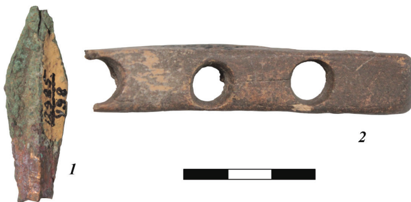
Рис. 3. Бронзовый наконечник стрелы и фрагмент костяного (рогового) псаля из второго культурно-хронологического комплекса городища Елбанка (АГКМ. ОФ 12985/498, ОФ 12985/468).

К рассматриваемому периоду также относятся материалы второго культурно-хронологического комплекса уже упомянутого городища Елбанка (рис. 3).