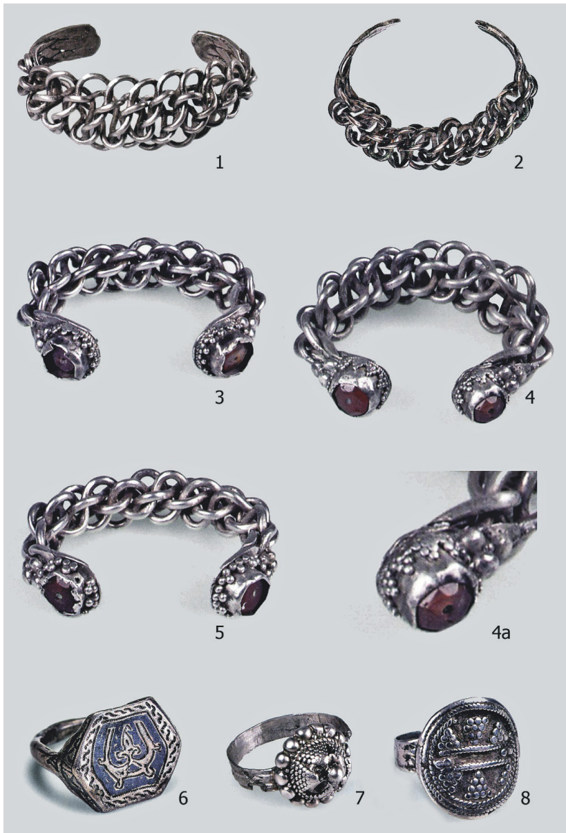
Рис. 4. Спасский клад 1869 г. Серебряные плетеные браслеты (1–5) и перстни (6–8); 4а – деталь [Путешествие, 2016: 395–396, 401–402, кат. 309–311, 317, 319]

После революции 1917 г. к указанным артефактам обратился в своей монографии советский искусствовед А. С. Гуцин [1936: 12–16, 80–81, табл. XXX, XXXI]. Дав краткое описание изделиям по И. И. Толстому и Н. П. Кондакову, он вслед за ними указал наличие в кладе монеты. По его мнению, клад был зарыт в XI в. [Гуцин, 1936: 38]. В дальнейшем на эту публикацию и датировку ссылались многие исследователи, например,