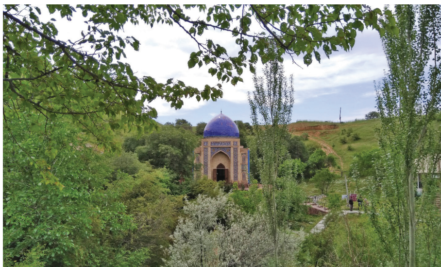
Рис. 3. Могила Акбура-ата. Казыгурт