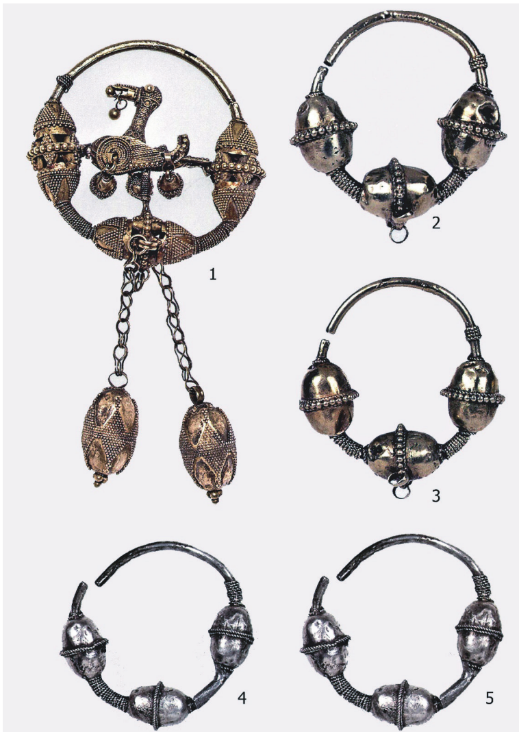
Рис. 6. Спасский клад 1869 г. Золотые (1–3) и серебряные (4, 5) височные кольца [Путешествие: 397–399, кат. 312–314]

11) золотая цепочка (фрагмент) длиной 9,7 см с 13 желудевидными подвесками (2,4x1 см), украшенными зернью (рис. 5. — 2) (ГЭ, инв. № 501/10–11). Аналогичные цепочки как с медальонами, так и с подвесками встречены в Жигулевском кладе булгарских ювелирных украшений домонгольского времени;