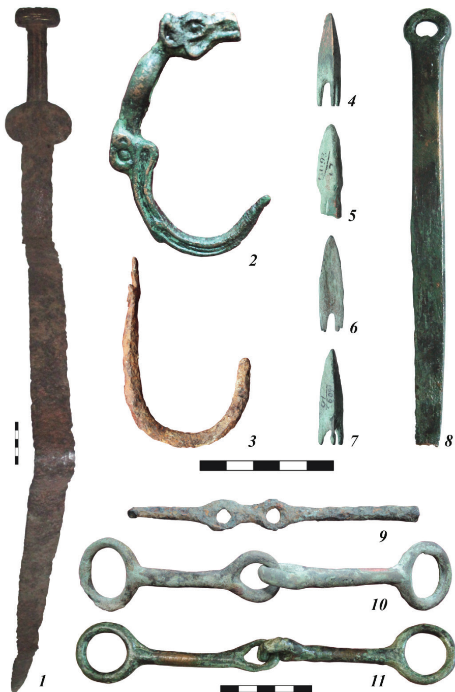
Рис. 5. Материалы комплекса Новообинка (АГКМ. ОФ 13093а).