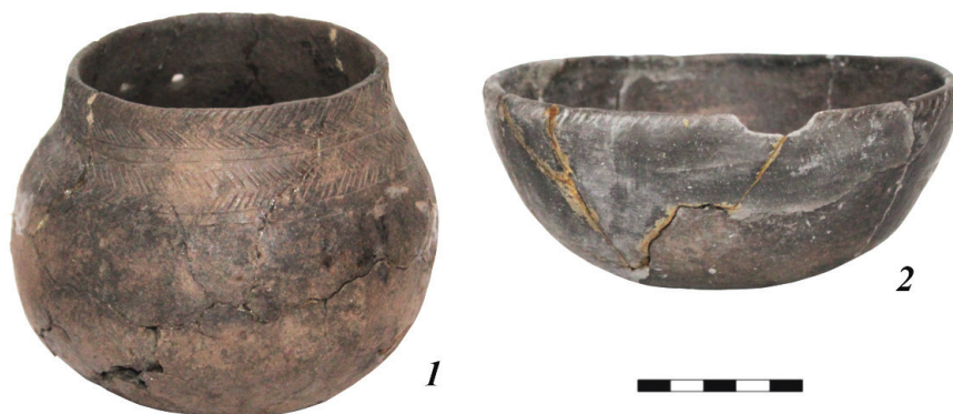
Рис. 2. Керамическая посуда из Бобровского грунтового могильника (АГКМ. ОФ 12700/170, ОФ 12700/165).

зиса населения обозначенной общности. Установлено, что именно результаты раскопок Бобровского могильника наиболее наглядно демонстрируют ирменский и андронидный (еловский, корчажнинский) компоненты, принявшие участие в формировании большереченской культуры [Тур, Фролов, 2001а: 69–81]. Помимо этого, материалы обозначенного некрополя привлекались при выявлении общих и особенных черт погребального обряда населения Верхнего Приобья переходного времени от эпохи бронзы к раннему железному веку [Фролов, 2008: 96–99].