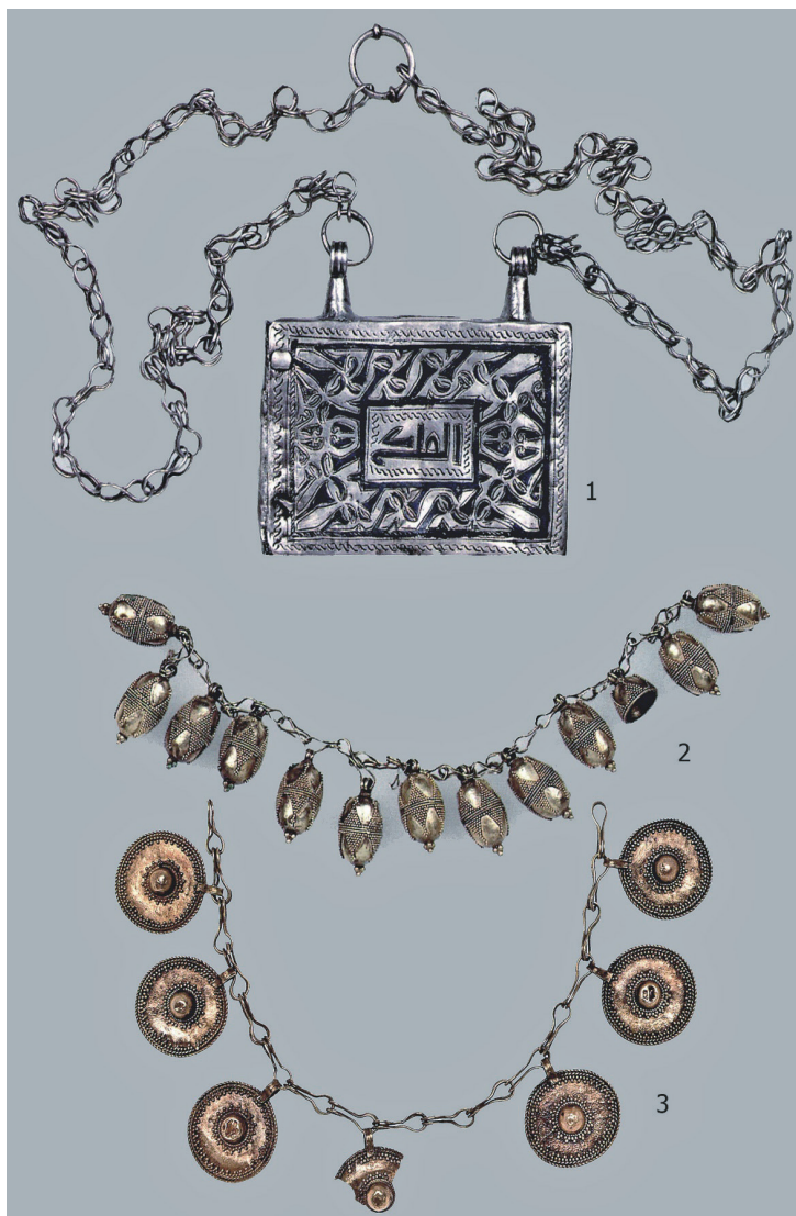
Рис. 5. Спасский клад 1869 г. Серебряная капторга (1) и ожерелья с золотыми подвесками (2, 3) [Путешествие, 2016: 394, 399, 400, кат. 308, 315, 316]

пляре. Правда, на Билярском городище была найдена бронзовая матрица для изготовления заготовок подобных изделий [Руденко, 2015: 67, илл. 118]. Ближайшая аналогия (пластина от коранницы) имеется в коллекции Насера Халили (Nasser D. Hallili), атрибутированная как иранское изделие X–XII вв. При совпадении размеров артефактов, единстве композиционного решения декора стиль оформления тут иной: основное орнаментальное поле занимает кувфическая надпись на фоне спиралевидных растительных побегов, как, собственно, и надпись в центральном медальоне. Фон на всем изделии покрыт чернью [Spink, Ogden, 2013: 253, cat. 213];