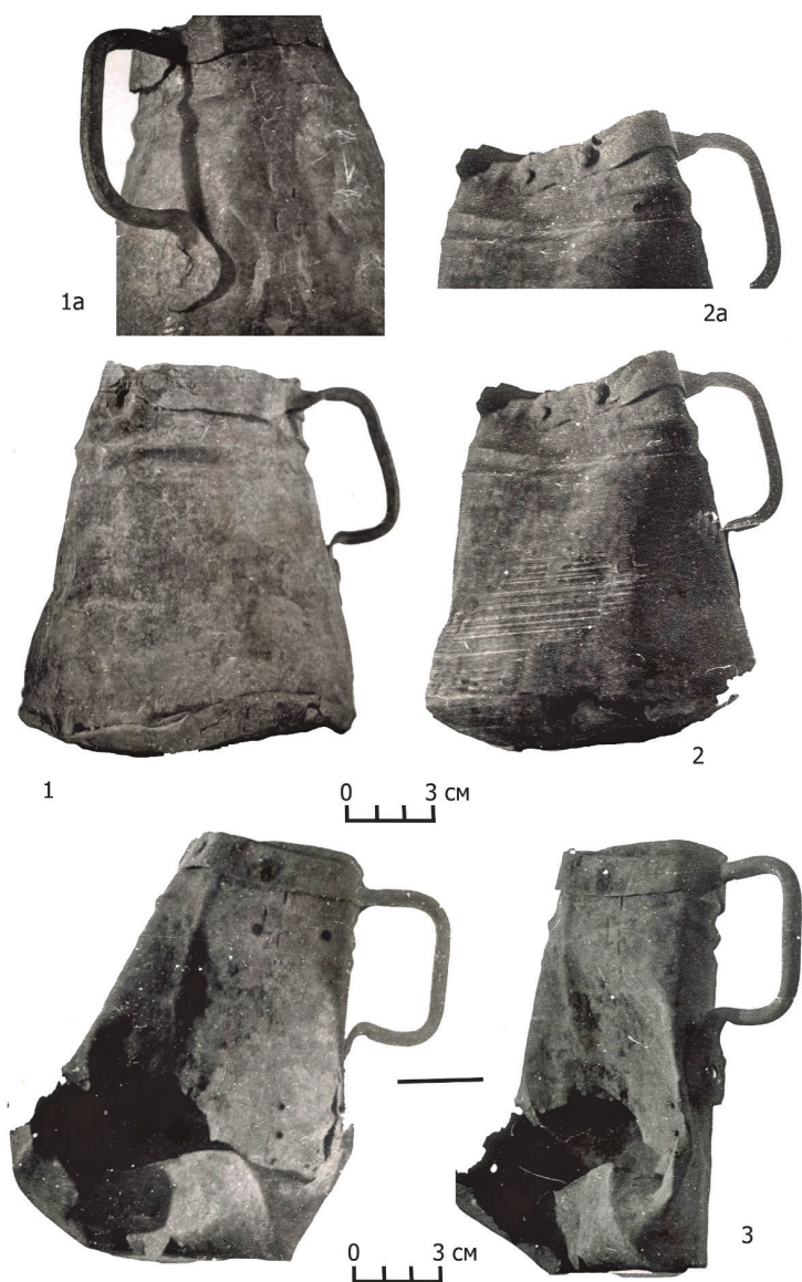
Рис. 12. Спасский клад медной посуды 1982 г. с V Старокуйбышевского селища.

Клады, обнаруженные до середины XX в. (№ 1, 4), были найдены на пашне, т. е. к юго-востоку от Спасска — на одном из левобережных селищ, вероятно, V–VI (рис. 1. — 2; 2). Остальные выявлены на размываемых селищах: селище IV (№ 2, 5, 6, 8) и селище V (№ 7 и, вероятно, № 1 и 3). Не будет большой ошибкой предположить, что клад № 3 происходит с селища V. Такая привязка кладов связана с характером этих поселений. Сели-