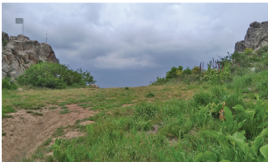
Рис. 1. Так называемое место стоянки корабля Ноя. Казыкурт

Для выяснения вопроса о времени появления сказания о Ноевом ковчеге на вершине Казыкурта важны сообщения источников об указанном топониме. Впервые Казыкурт фиксируется как населенный пункт Газкерд на пути из Шаша (Ташкента) в Испиджаб (Сайрам) в сочинении арабского географа IX в. Ибн Хордадбега, который, как считается, использовал данные, восходящие к середине или к концу VIII в. [Волин, 1960: 74].