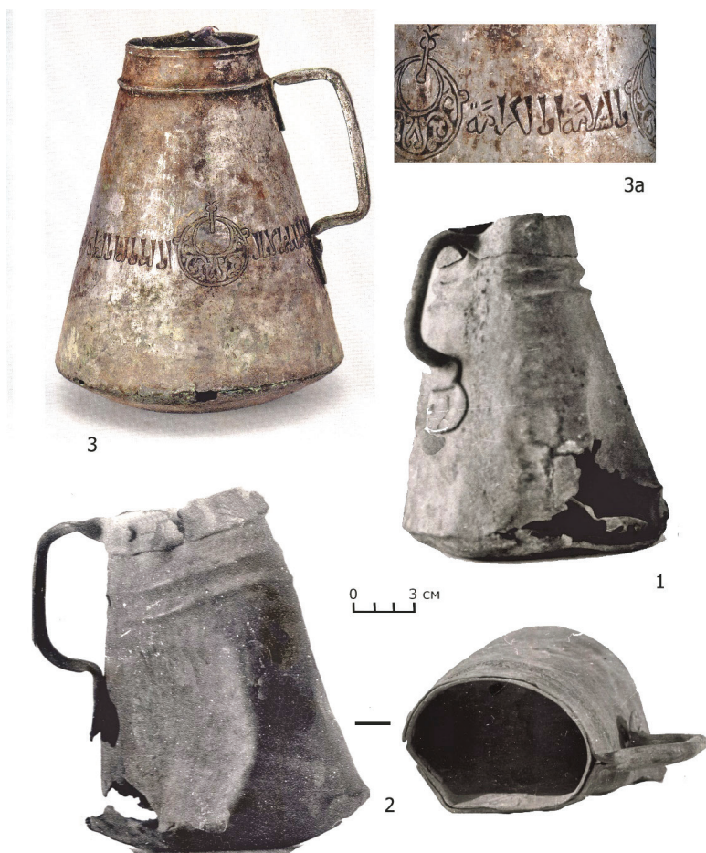
Рис. 11. Спасский клад медной посуды 1981 г. с IV Старокуйбышевского селища (1,2). Аналогия (3,3а): медный мерный сосуд. Собрание Фонда Марджани [Подарок созерцающим, 2015: 326–327, кат. 161].

№ 5. Клад серебряных слитков 1998 г. Обнаружен в конце 1990-х гг. Е. А. Беговатовым на IV Старо-Куйбышевском селище. Он состоял из 26 слитков серебра. Три, самых крупных из них, представляли собой круглые слитки, свёрнутые в трубку (КССТ) (13,1; 20,9; 60,1 г), остальные — разрубленные или распиленные на мелкие кусочки те же по форме слитки (1,6; 1,7; 1,8; 2,4; 2,5; 2,6; 3,5; 4,5; 5,2; 6; 7,9; 8,1; 12,5; 12,8; 12,9; 13,1; 13,2; 17,1; 20,4; 20,9; 31,8; 38,4; 60,1; 76,1 г). Как отмечал Е. А. Беговатов, на многих слитках имеются следы несколько срезов — по-видимому, они подгонялись под определённый вес [Беговатов, 1999: 83].