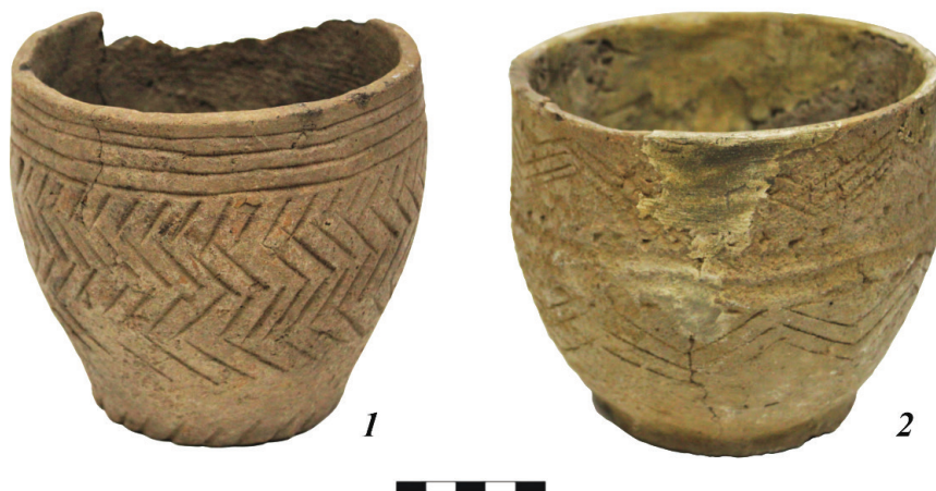
Рис. 1. Керамические сосуды из могильника Подтурино (АГКМ. ОФ 12903/13, ОФ 14779/1).

ней Оби эпохи развитой бронзы [Кирюшин, Лузин, 1993: 67–94; Кирюшин, Папин, Федорук, 2015: 30–31].