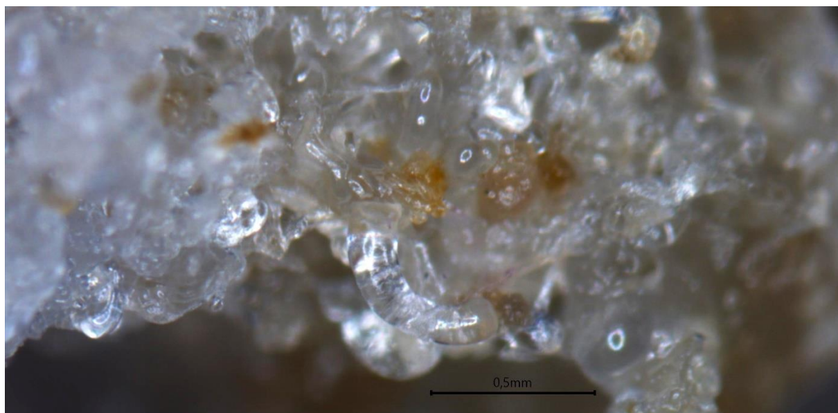
Рисунок 2. Вызревание соматических зародышей Pinus sylvestris в культуре in vitro

питательной среде, как описано в работе Нагџи с соавторами [8], будет оказывать благоприятное влияние на процесс созревания соматических зародышей.