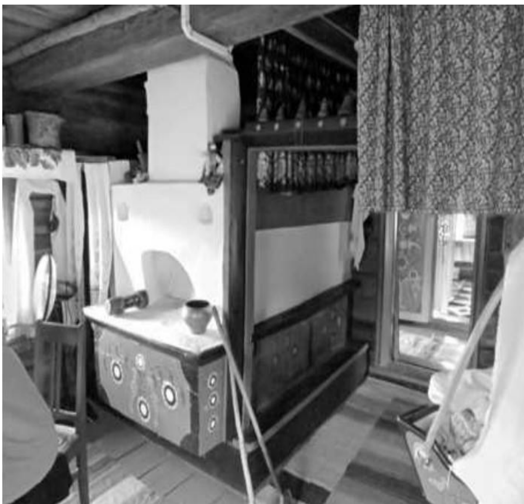
Рис. 4. Печь в музее Уймонской долины, с. Верх-Уймон, Усть-Коксинский р-он, Республика Алтай.

В то же время важное значение – и архитектурное, и символическое – в избе выполняла печь. Приведем для сравнения печь в избе в одном из домов Республики Алтай. Хотя это и другой российский регион, тем не менее убранство избы, в которой располагалась печь, было типичным для обустройства дома в двух соседних территориях (Коляскина 2015: 113) (рис. 4).