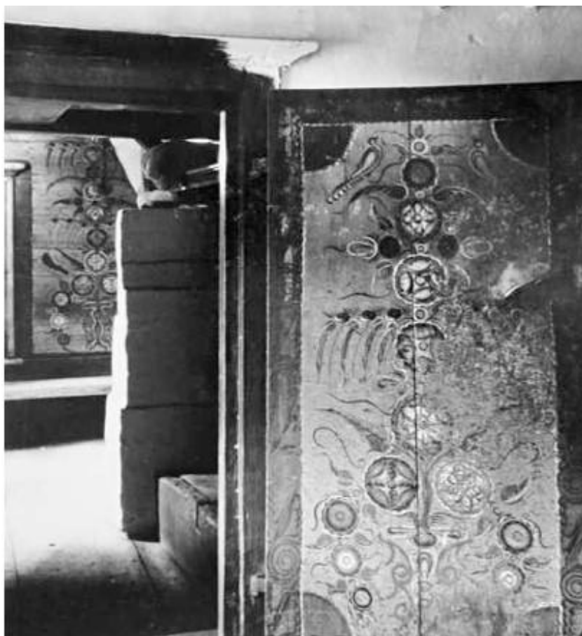
Рис. 6. Входная дверь в избу в доме И.Я. Жеманова, с. Топольное, Солонешенский р-н, Алтайский край Фото Линевича М.С., 1956 г.

Интерьер русского крестьянского дома в Алтайском крае представлял собой сложное символическое пространство, отражающее мировоззрение, социальные отношения и религиозные представления русских переселенцев и старожилов. Каждая зона и предмет быта несли определенную семантическую нагрузку, формируя целостную картину мира, где сакральное и профанное, утилитарное и символическое были тесно переплетены. Исследование символики интерьера позволяет глубже понять особенности традиционной культуры русских на Алтае, ее адаптацию к природным условиям и взаимодействие с культурами других народов.