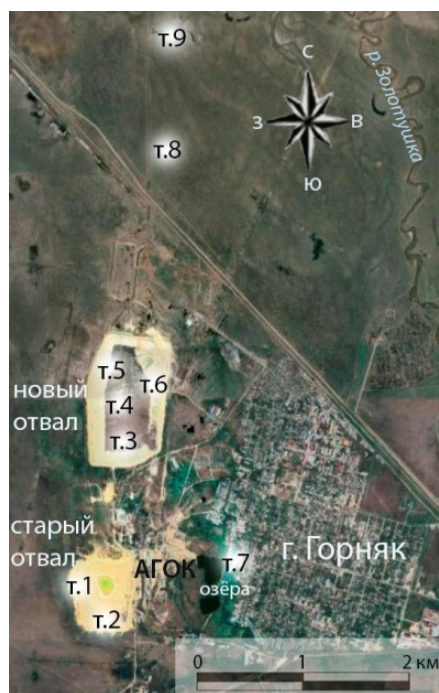
Рис. 1. Карта-схема расположения пунктов отбора проб люцерны и грунта на хвостохранилищах АГОКа и в его окрестностях (Основа взята из открытого источника Google Maps)