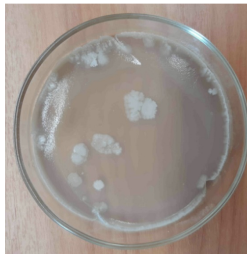
Рис. 2. Рост дрожжей Saccharomyces cerevisiae в присутствии 0.1% веществ спиртового хвойного экстракта

* даны наименования веществ в соответствии с номенклатурой IUPAC.