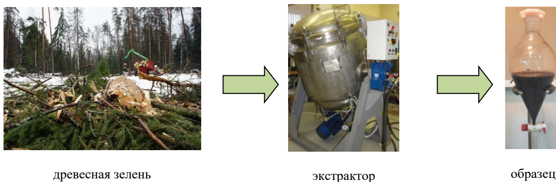
Рис. 1. Схема получения образцов для исследований

Образцы для исследований были получены в процессе масштабирования эмульсионной экстракции хвойной ДЗ в промышленном экстракторе (рис. 1). Выход экстрактивных веществ представлен в таблице 1.