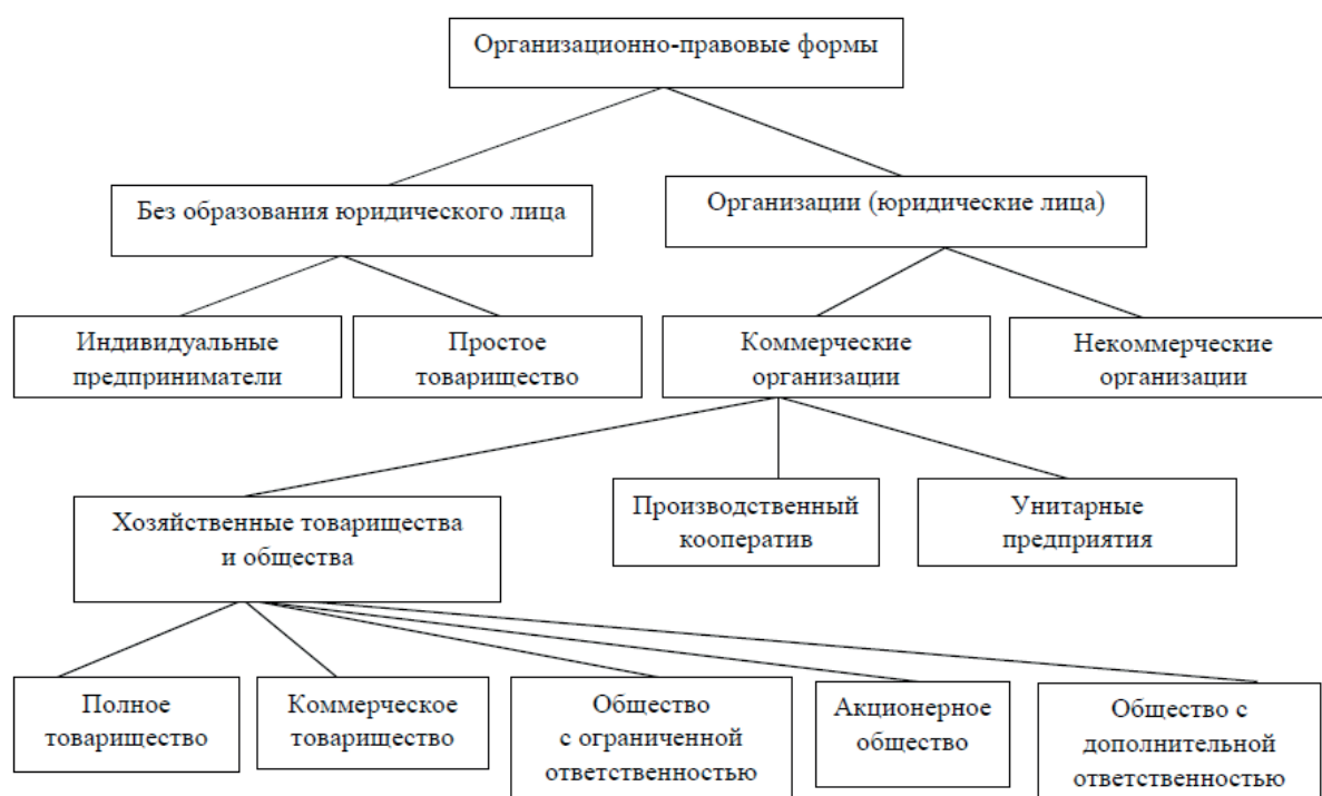
Рис. 1. Формы предпринимательской деятельности

Рассмотрим формы предпринимательской деятельности (рис. 1), а далее разберем их более подробно [8]: