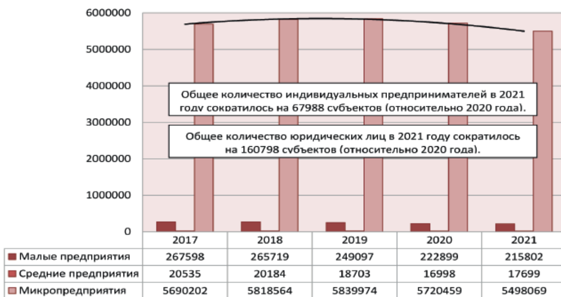
Рис. 3. Тенденции в изменении количества субъектов малого и среднего предпринимательства в 2017–2021 гг.

Текущая пандемия и связанные с ней ограничительные меры оказали серьезное влияние на покупательскую способность граждан, доходы которых резко сократились, а общий уровень закредитованности возрос. Со снижением потребительского спроса замедлились темпы развития частного хозяйствования: краткосрочные меры государственной поддержки в период пандемии лишь ненадолго продлили сроки присутствия многих малых фирм на местных рынках [18].