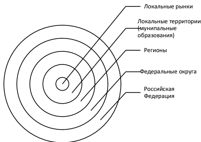
Рис. 4. Структура территориальной локализации РФ

Также мы исходим из того, что локальный рынок способен интегрироваться в локальные области, включающие государственные (внешние) и (или) (внутренние) национальные рубежи, определяющие составные части страны (государства) (рис. 4).