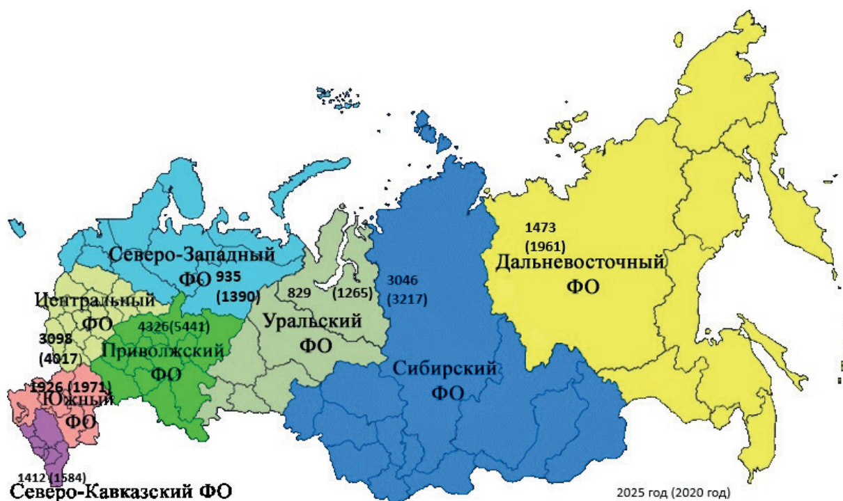
Рис. 5. Территориальная локализация муниципальных образований по территории РФ 2025 год

Сложившаяся структура территориальной локализации муниципальных образований отражает исторические, экономические и географические особенности каждого федерального округа. Дальнейшее развитие территориальной структуры будет зависеть от реализации государственной политики, направленной на сбалансированное развитие регионов и повышение качества жизни населения.