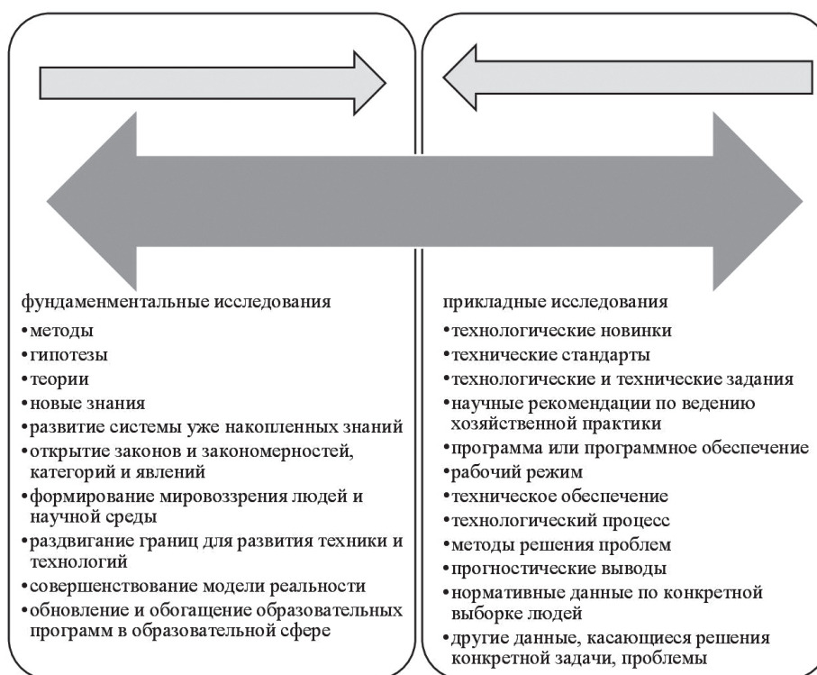
Рис. 1. Виды научных исследований

В данном аспекте следует остановиться на основных подходах к определению основополагающего понятия — рынок. Анализируя доступные источники информации, следует отметить, что существует несколько основных подходов к изучению рынка как экономического явления: фундаментальные и прикладные исследования (рис. 1).