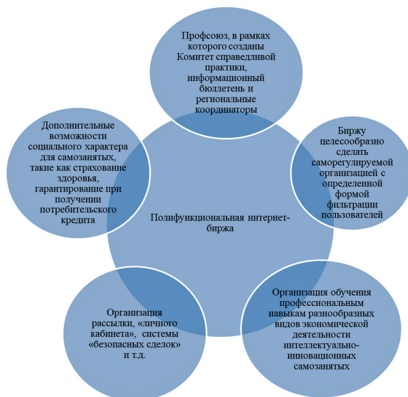
Рис. 3. Концептуальная модель функционирования интернет-биржи для самозанятых

Концептуальная модель функционирования интернет-биржи фриланса, которая могла бы способствовать решению указанных выше задач, представлена на рисунке 3.